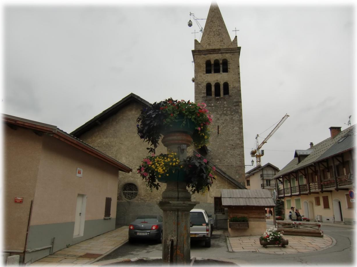
We komen in het mondaine skioord Montgenèvre (1.859 m) dat in 2006 het decor was van de Olympische Spelen.