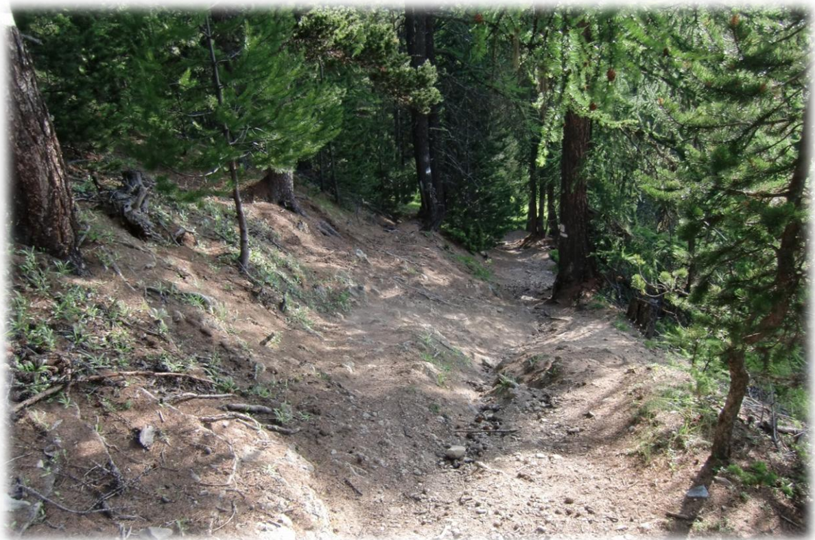
Het is een steile en moeilijke afdaling door het bos naar het “Chateau-Queyras” (1.350 m).