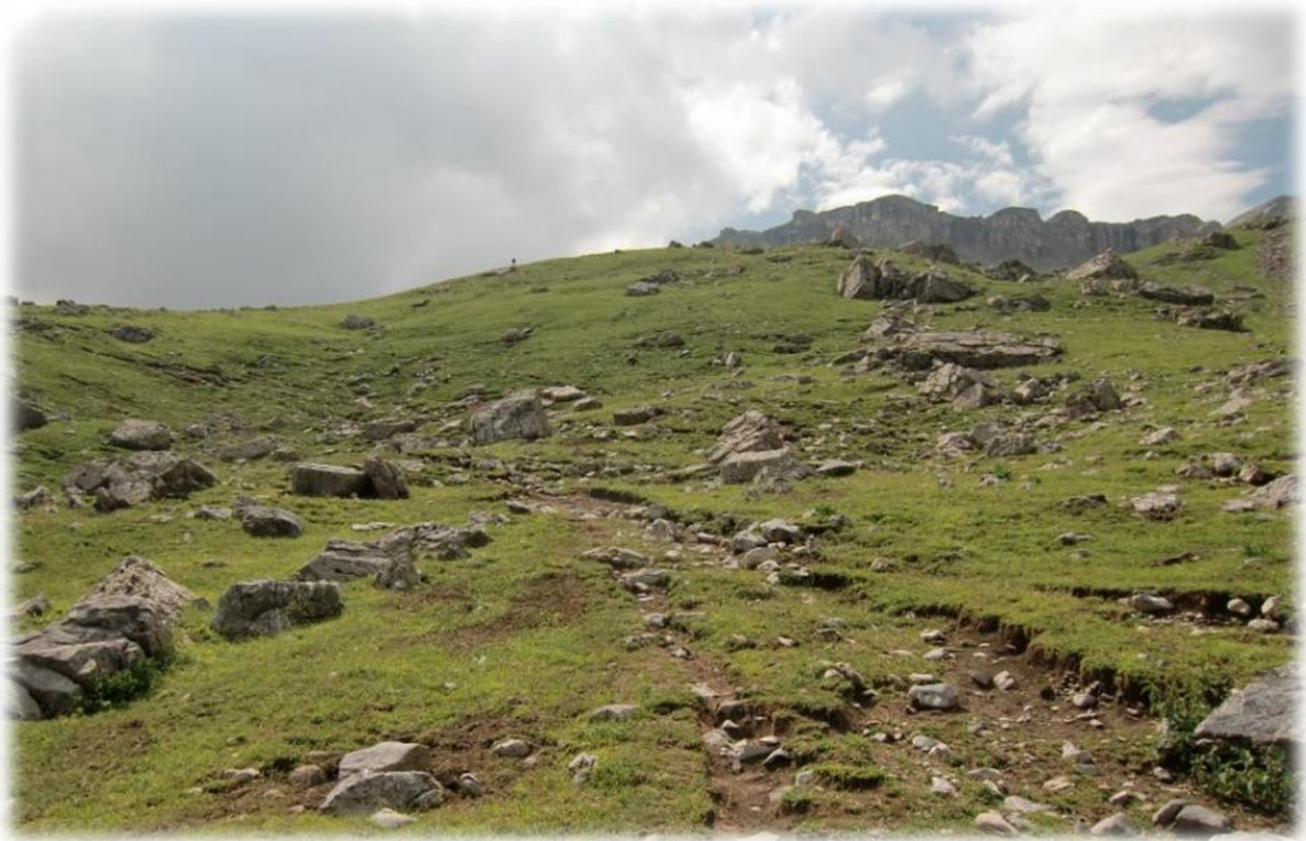
We beginnen aan de klim van de Col de Crousette. Het is een lange en toch wel lastige klim.