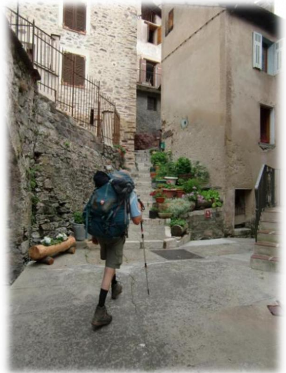
Roure is gebouwd op de flank van een berg. Het heeft een mooi kerkje. Het dorpje heeft vrijwel enkel maar smalle straatjes waar geen auto's kunnen rijden.