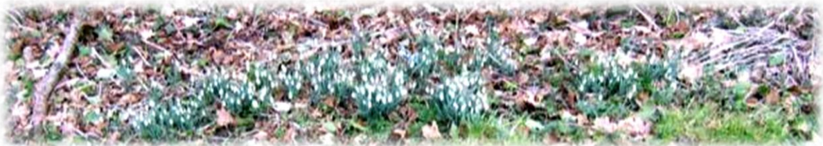
De sneeuwklokjes staan nog in volle bloei.