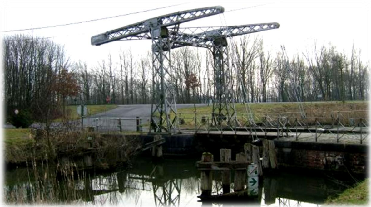
De Sint-Pietersbrug op het kanaal van Kortrijk naar Bossuit. Dit kanaal verbindt de Schelde en de Leie en is bevaarbaar voor schepen tot 1.350 ton.