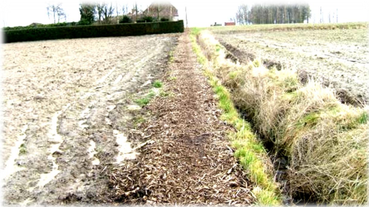
Eens we de Leie verlaten hebben, volgen we vooral paadjes tussen velden, akkers en weiden.