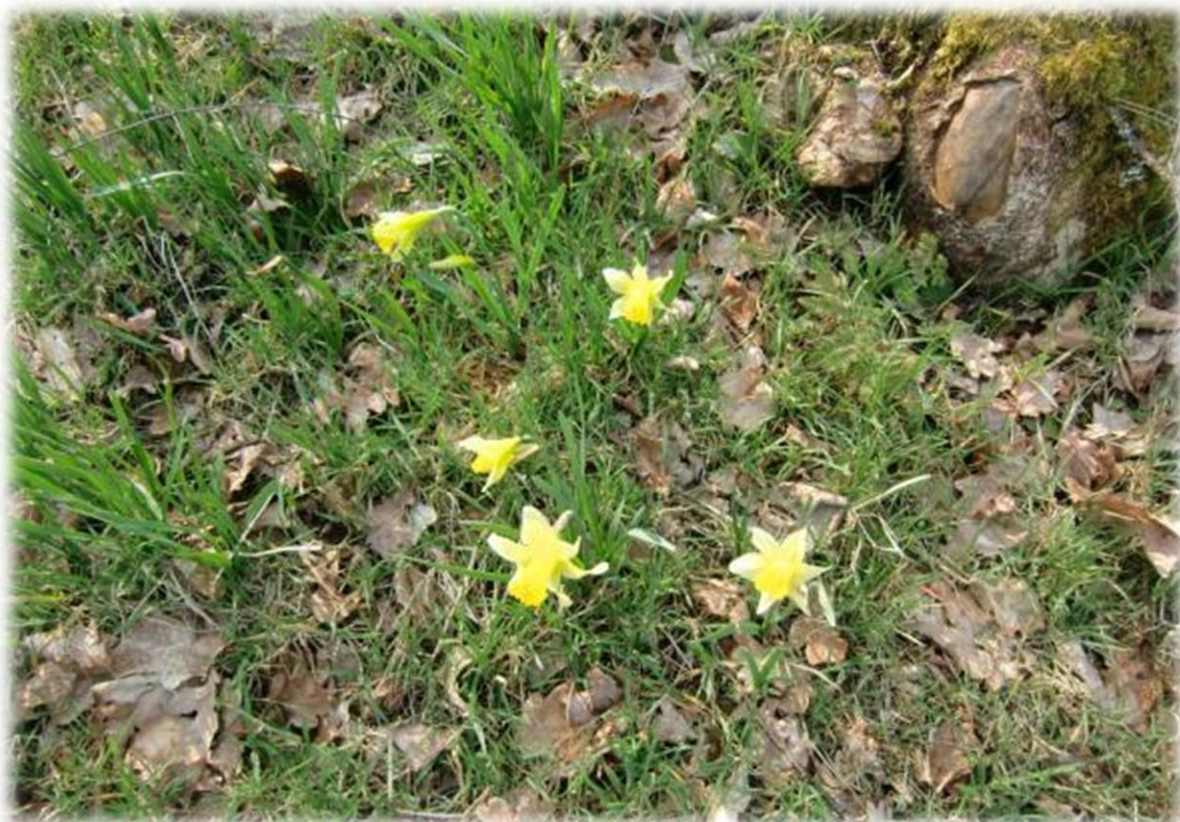
Hier en daar treffen we al narcissen aan.