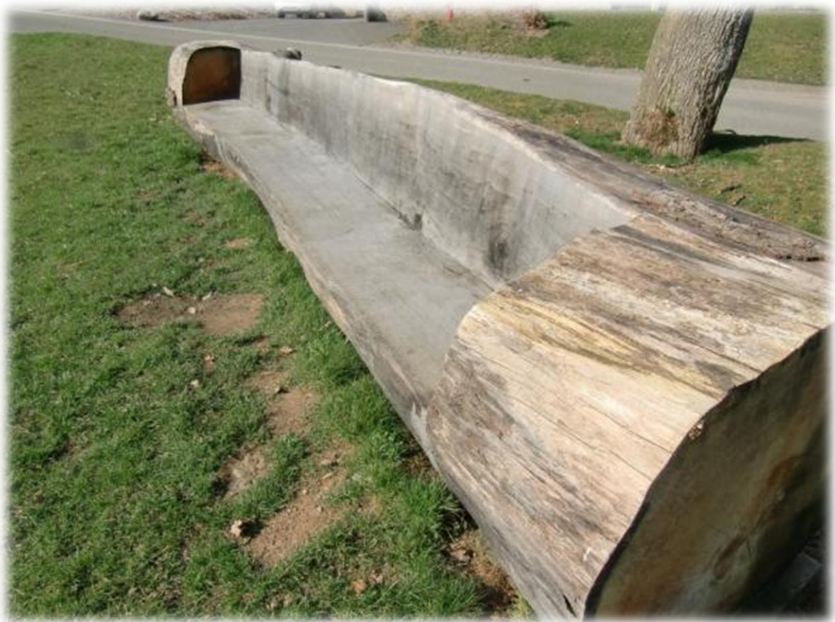
Aan zitplaatsen geen gebrek.