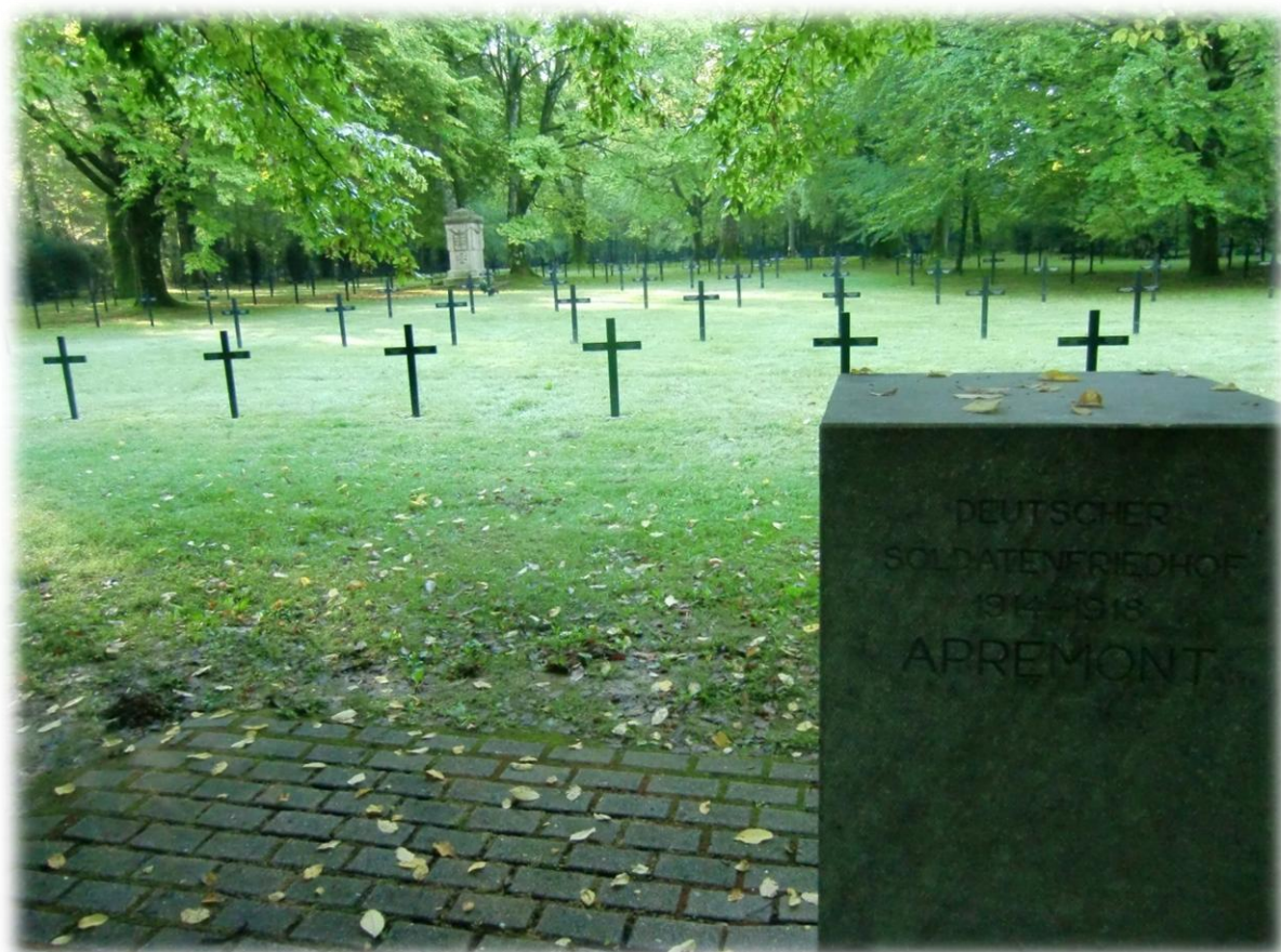
In Apremont passeren we terug een militair kerkhof waar welgeteld 1.111 Duitse soldaten begraven liggen. Elk graf heeft een zwart kruis.