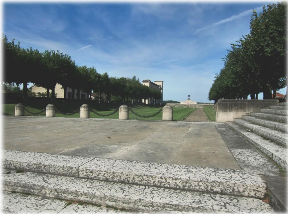
Het Monument Américain Pennsylvanie domineert het dorp. Het werd opgericht in 1927 ter ere van de bevrijding van de Duitse bezetter door de Amerikanen.