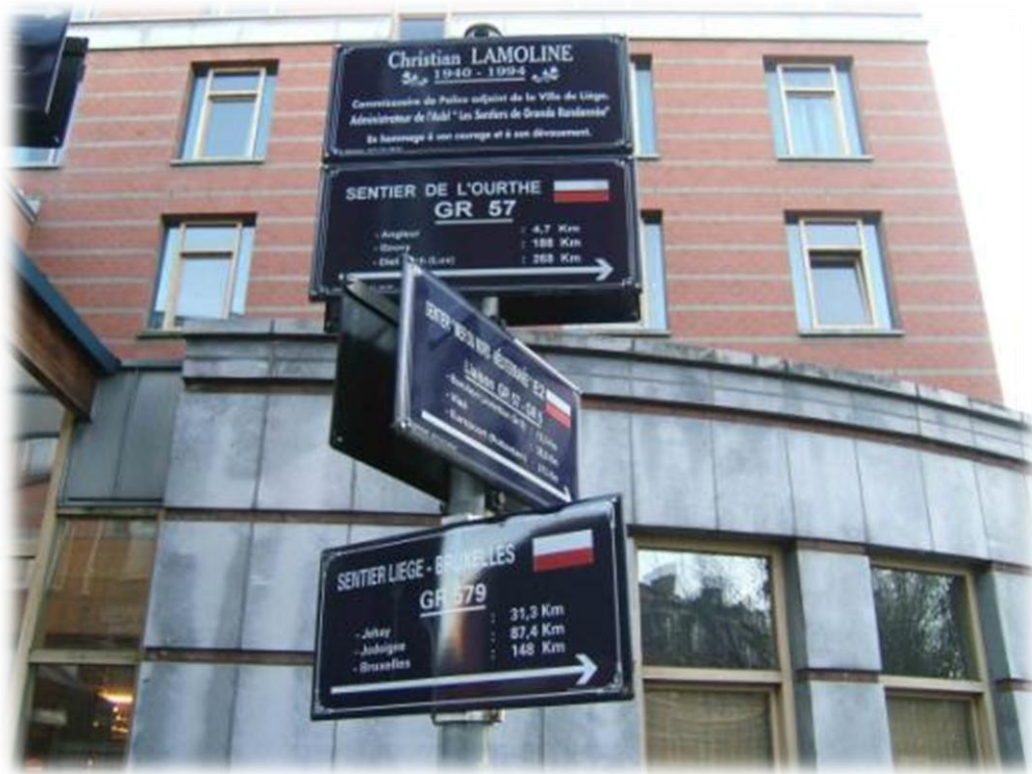
De jeugdherberg bevindt zich op de achtergrond.

Na 27 kilometer bereiken we de jeugdherberg in Luik. We worden er warempel te woord gestaan in het Nederlands. De verantwoordelijke is tevens zo vriendelijk om ons een jaar lang gratis lid te maken van de jeugdherbergcentrale. We krijgen er een kamer toegewezen die we moeten delen met een jonge Engelsman, die op stage is in een labo, en met een Oost Berlijner, die in de streek op zoek is naar werk. De jeugdherberg is volledig vernieuwd en bevindt zich in een bijgebouw van de aanpalende kerk.