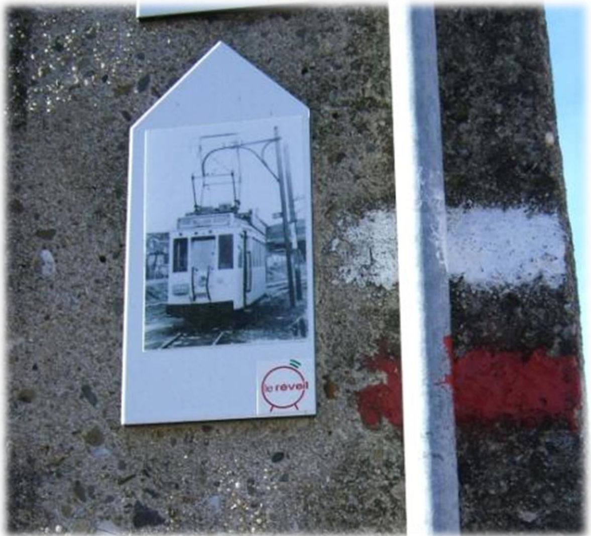
Blijkbaar heeft de tram hier nog gereden.