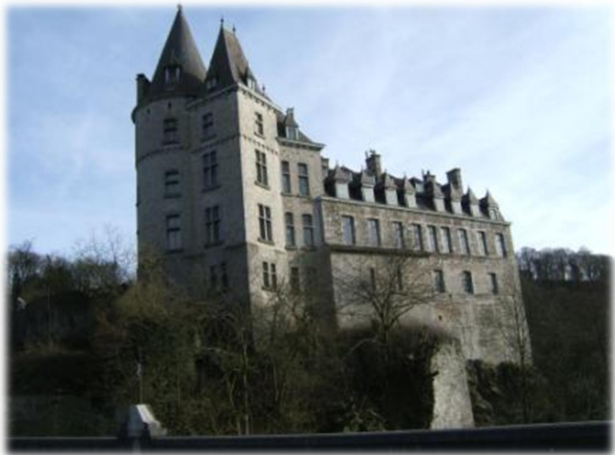
Het kasteel van Durbuy