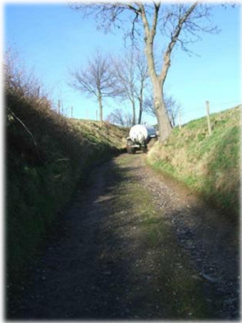
Met dit mooie weer zijn de boeren in de weer