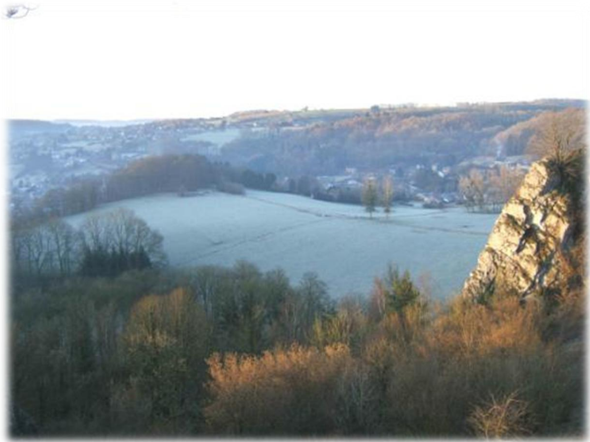
De wit bevroren akkers van Comblain-au-Pont