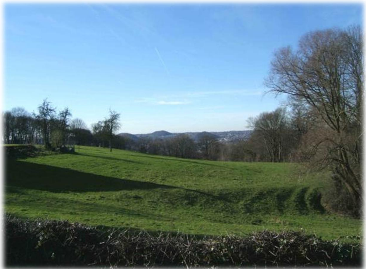
Op de achtergrond kun je al enkele mijnterrils waarnemen in de omgeving van Luik