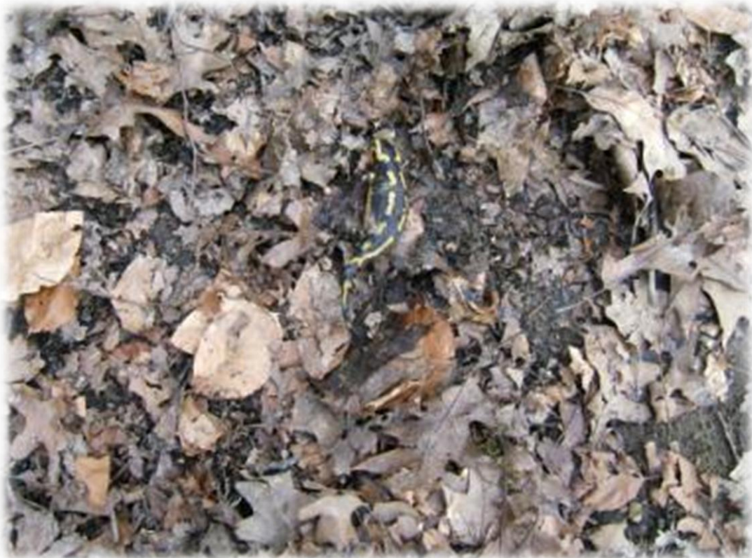
Een dode vuursalamander

Soms moet je ook eens door wat ondiep water ploeteren, maar dat deert ons niet. We zijn immers geen watjes.