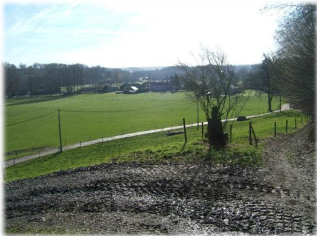
Zicht op Dalhem