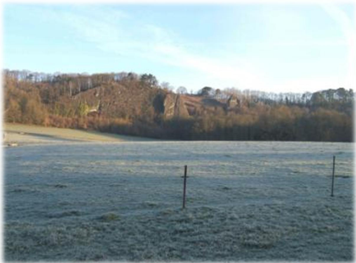
Op de achtergrond “Les Roches Noires”