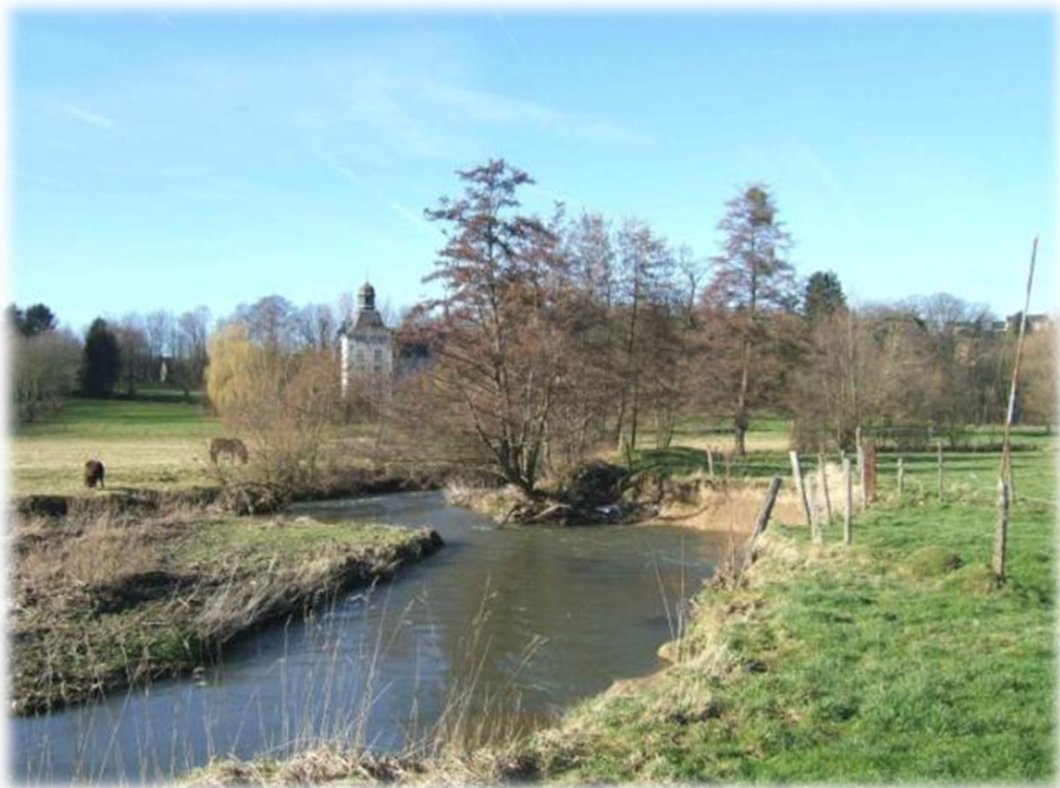
Het kasteel van Dalhem. We zitten nog steeds op de aanlooproute naar de GR 57