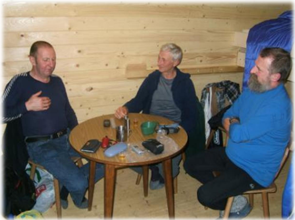
Lekker keuvelen, napraten en opwarmen