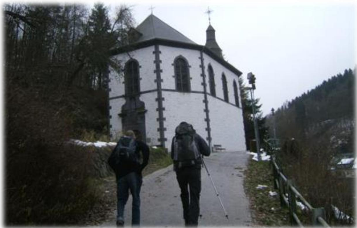
De kapel boven in Clervaux