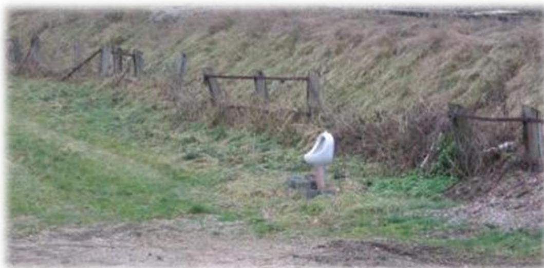
Op de GR57 vind je overal openbare toiletten