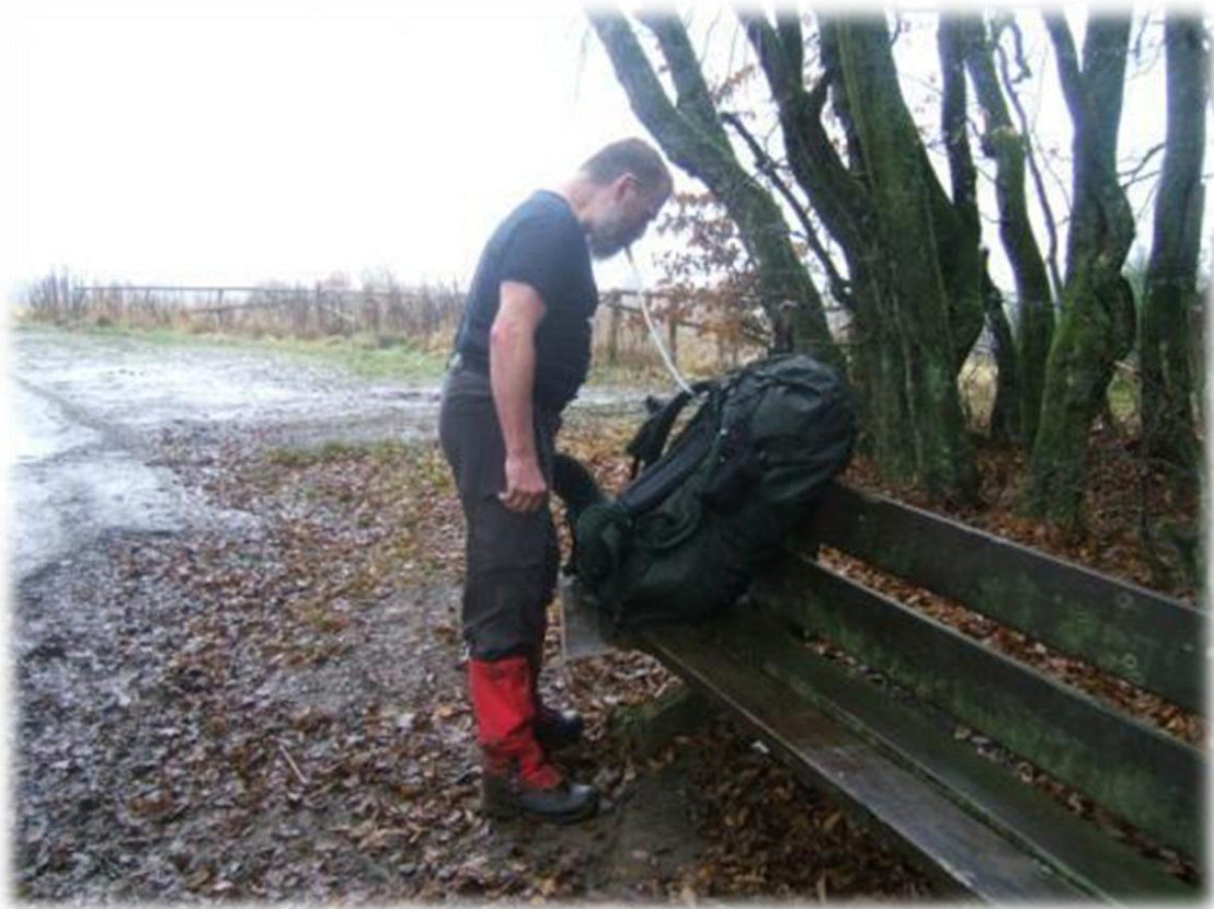
Staf blaast zijn rugzak op