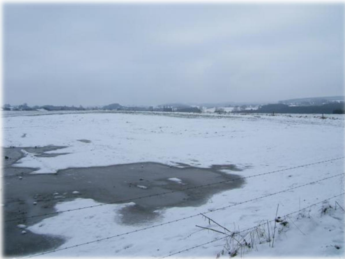
Winterlandschappen strelen het oog