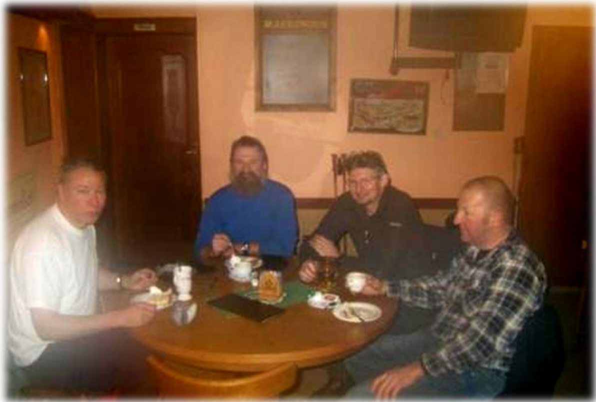
In Clervaux warmen we ons wat op in een bruine kroeg aan een warme chocomelk of koffie en appeltaart.