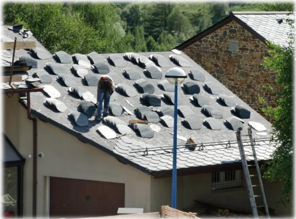
Dakwerker aan het werk. De kleine, natuurlijke ronde, leien zijn in werkelijkheid toch wel wat groter dan men op het eerste zicht zou denken.