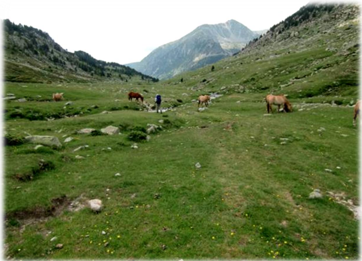
We ontmoeten paarden die, net als de koeien, een bel rond de nek hebben.