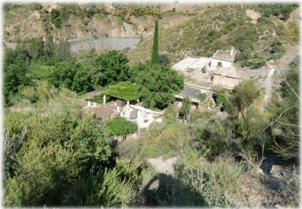
Links is de kleine woning die de Duitser mag betrekken. Rechts is de woning van de eigenaar waarvoor de Duitser werkt.