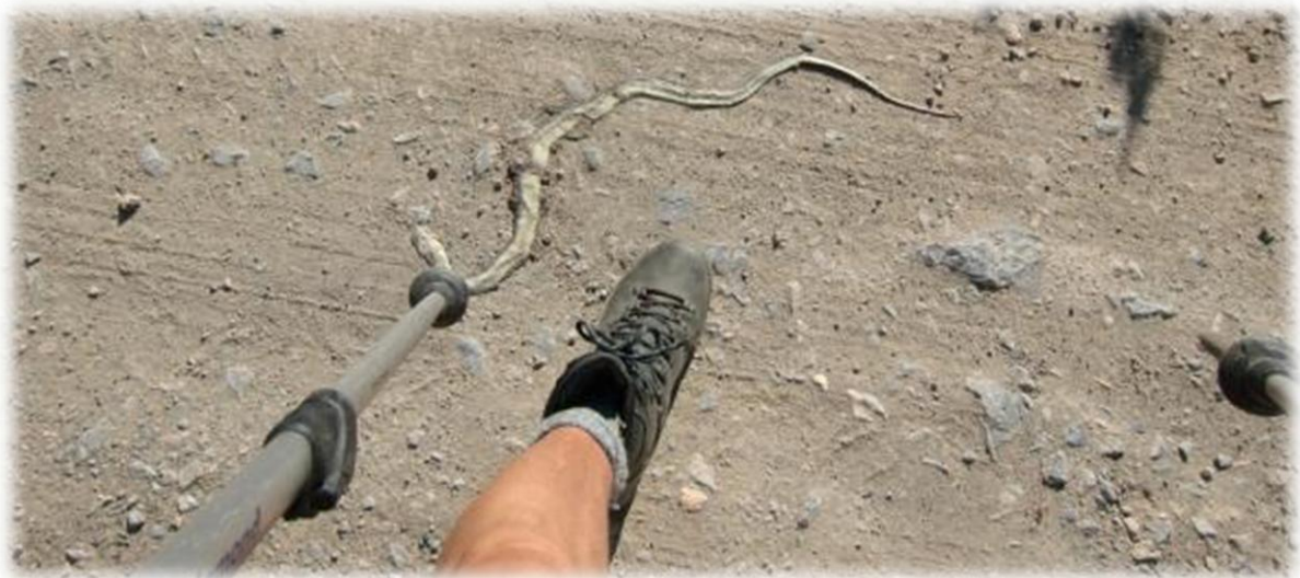
We komen terug een platgereden slang tegen.