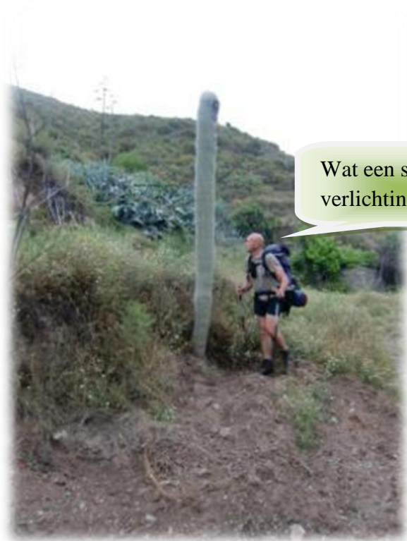
Wat een stekelige verlichtingspaal