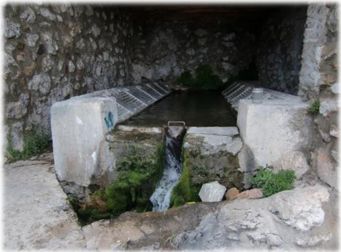
Het overtollige water van de bron, de overloop dus, wordt meestal afgeleid naar een wasplaats