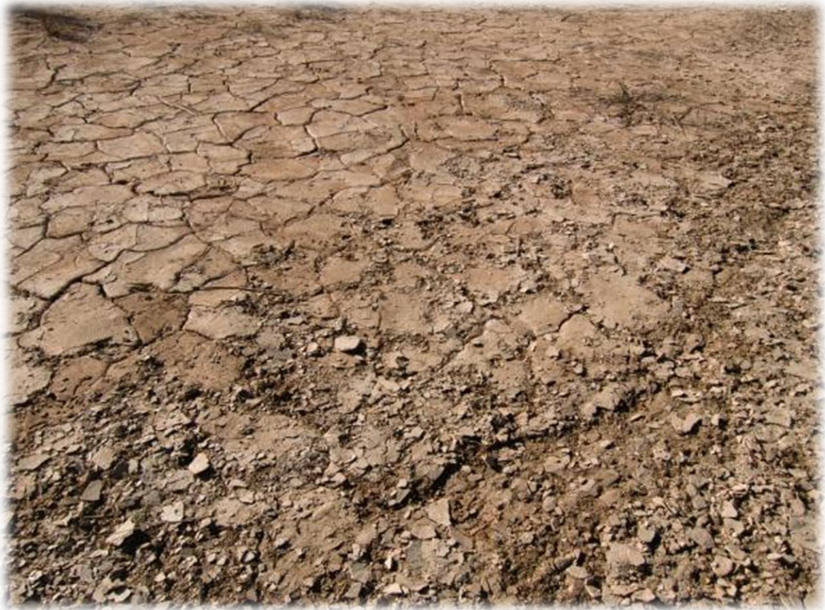
Zo te zien heeft het hier de laatste dagen niet veel geregend.