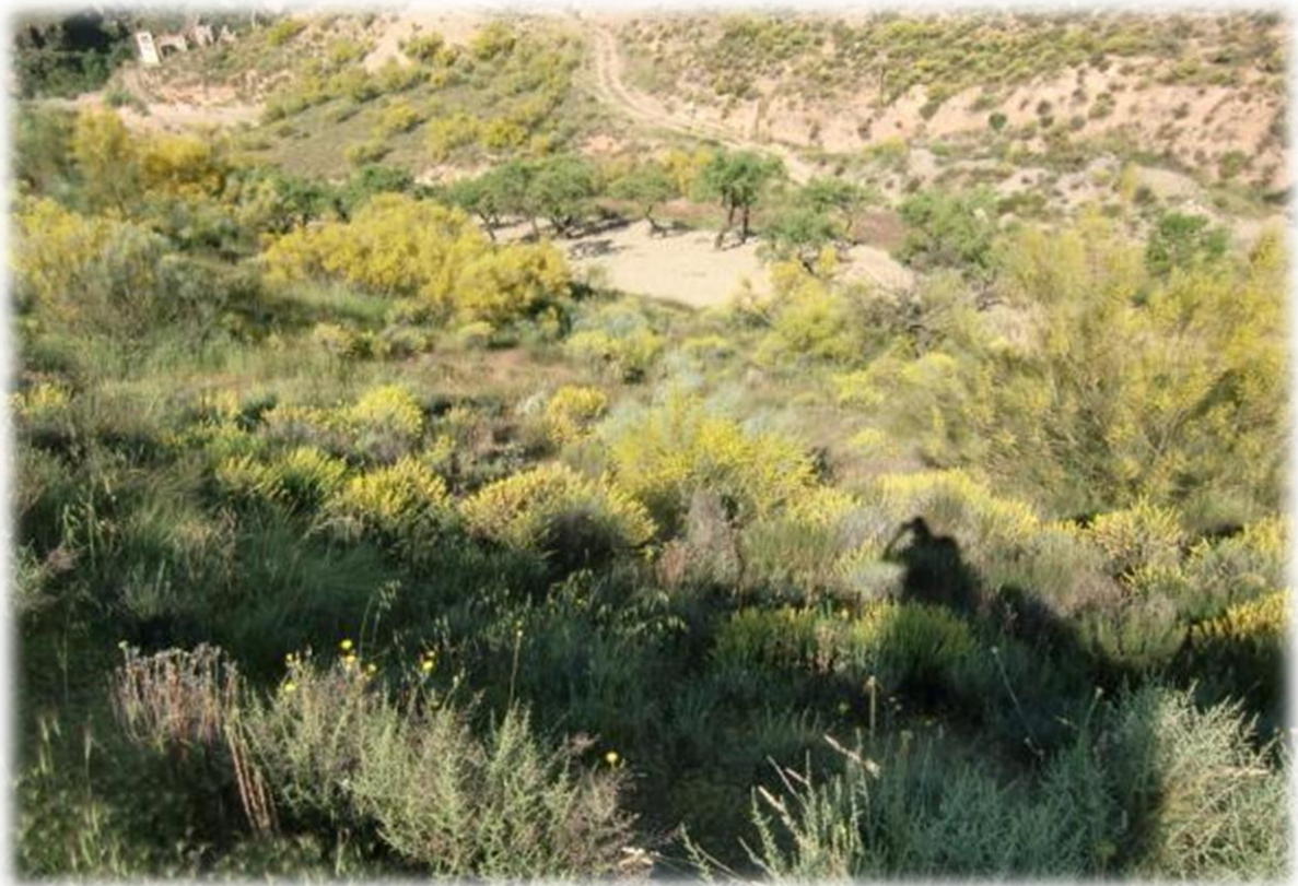
In deze tijd van het jaar staat de bezemstruik in volle bloei. De plant behoort tot de vlinderbloemigen en de bloem verspreidt een zoem zoete geur.