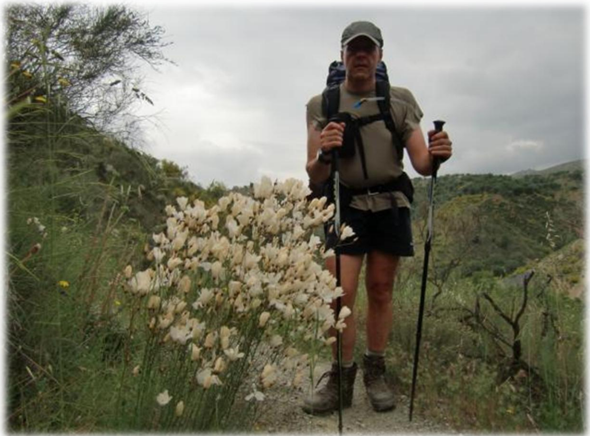
We eindigen vandaag in Cadiar en overnachten er in een klein hotel. Cadiar ligt op de