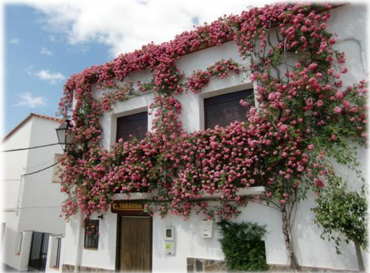
Deze wilde rozenboom heeft slechts één dunne stam maar versiert de volledige gevel met heerlijk geurende bloemen.