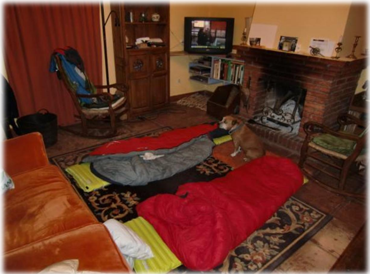
Ludwig en Jan nestelen zich in de woonkamer. Ivan nestelt zich in het bureel op twee