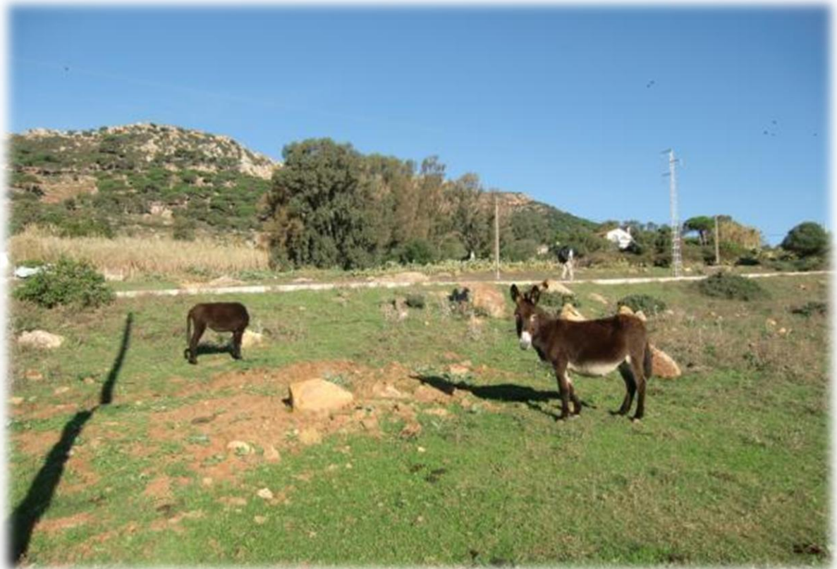
Ezels, geiten, schapen, koeien en paarden lopen zomaar vrij rond. Er zijn geen afsluitingen.