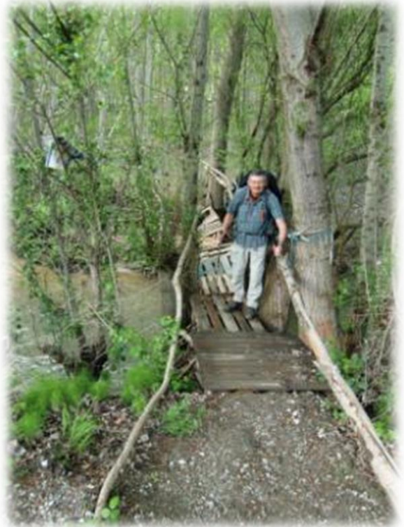
Af en toe is het lopen over een gammel brugje.