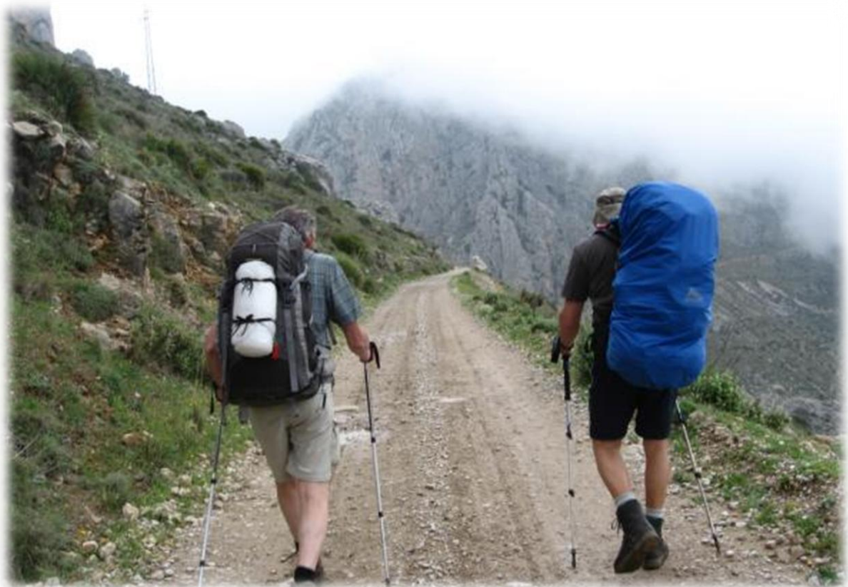
We krijgen zicht op de Pena Negra die voor ons optrent. De top ligt echter in de mist.