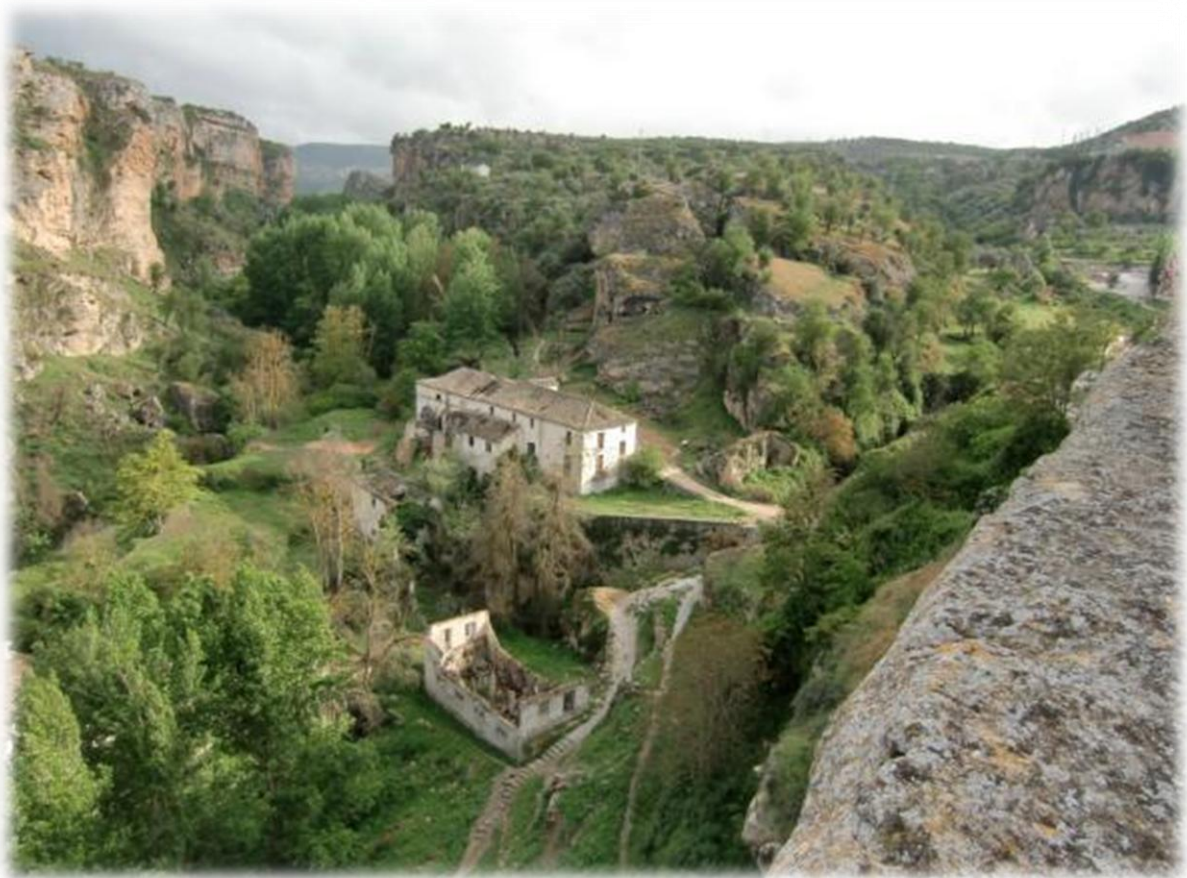
Overblijfselen van de twee bloemmolens.