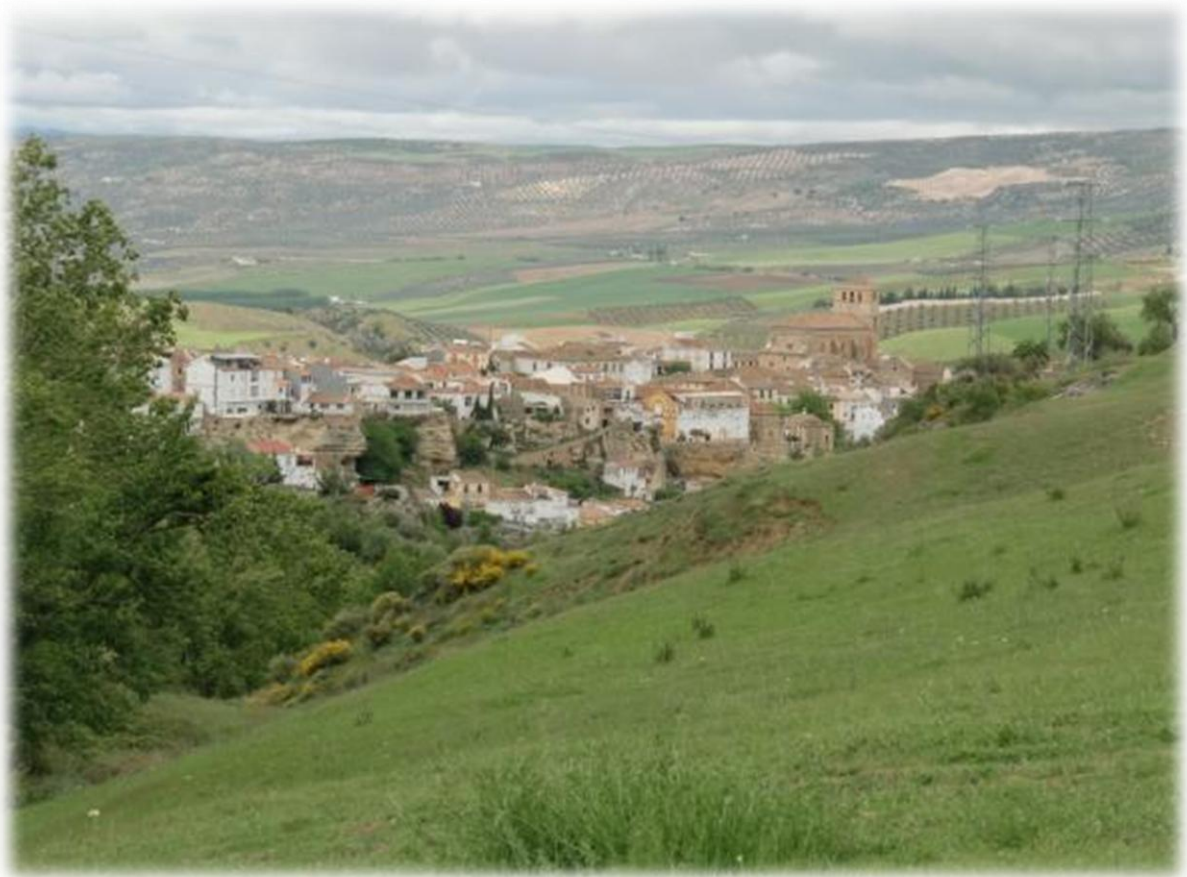
Alhama de Granada, gebouwd aan de rand van een diep ravijn, komt in zicht. Het is een pittoreske plaats in een impressionante omgeving, gekend om zijn moorse thermale baden. Goed bewaard oud Arabisch gedeelte, wallen en toren.