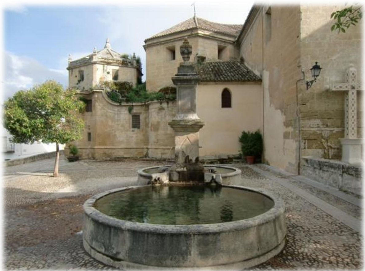
De kerk van Carmen met zijn prachtige fontein met drinkbaar water. Van hieruit heb je ook zicht op de kloof.