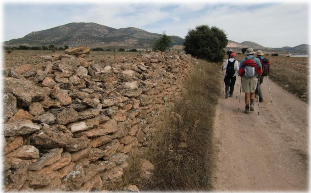
We komen aan de grensscheiding Andalucie met Murcia. Op deze grensscheiding heeft men een grote steen aangebracht.