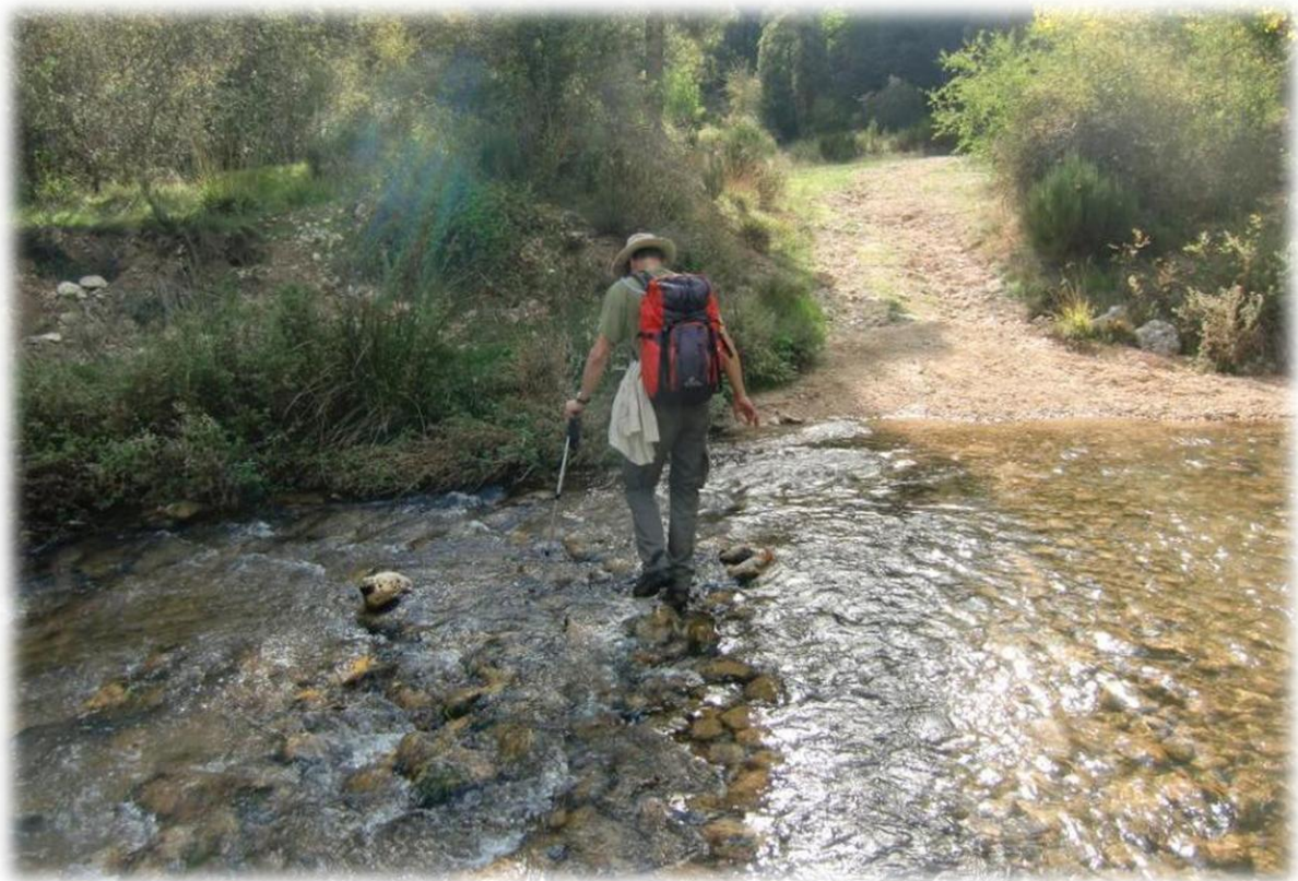
Ook Ivo geraakt aan de overkant met droge voeten.