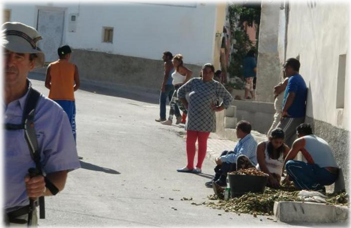
Enkele Roma's zijn amandelnoten aan het ontschelpen. De buitenkant van de 'pit' van deze steenvrucht wordt gekraakt; het vlies wordt verwijderd door de amandel kort te blancheren.