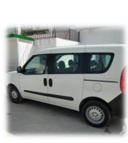
Fiat Doblo (vijfdeurs) Malaga