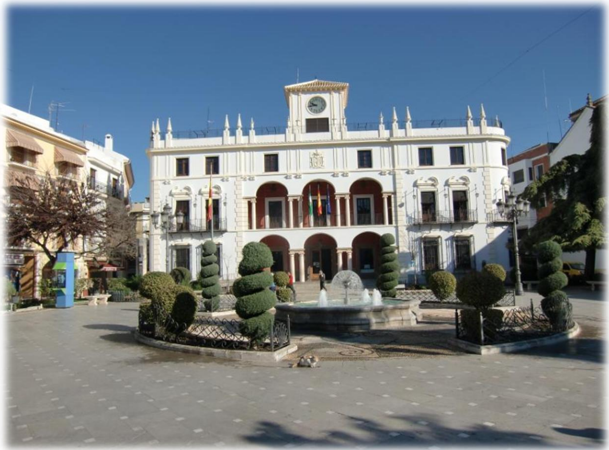
In het stadhuis willen we navraag doen naar de dichtstbijzijnde supermarkt maar niemand kon er ons te woord staan. Guido vraagt het dan maar aan een politieagent die ons meteen helpt.