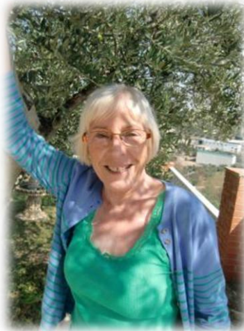
Lut Guns – St-M-Bodegem