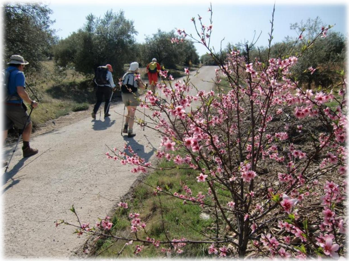
Guido is in goede vorm en trekt, op de hellingen, steevast de kop.