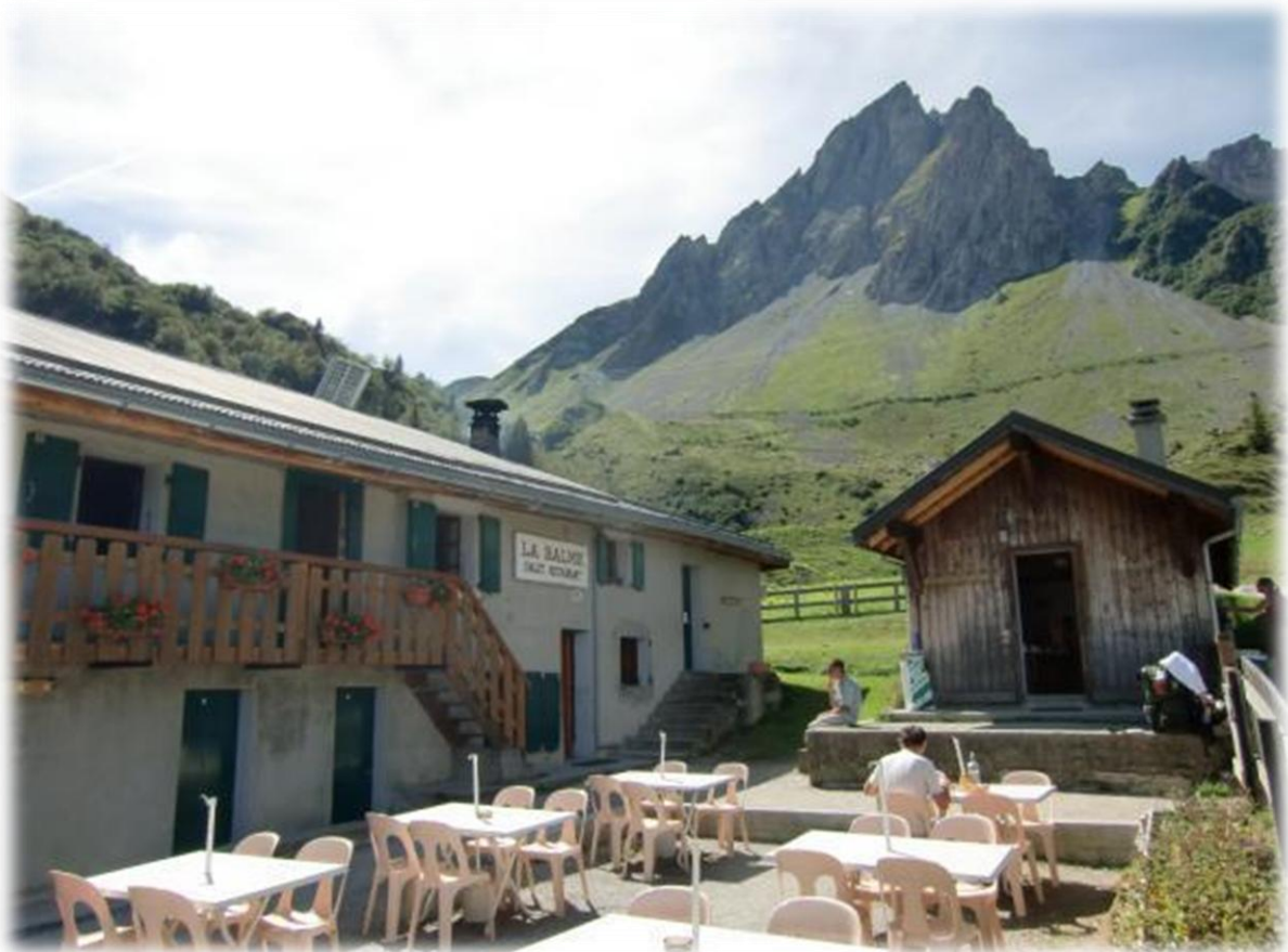
Aan Refuge de la Balme houden we een rustpauze en eten er een eiergerecht. Van op het grote terras heeft men het zicht op de omliggende grillige rotswanden.