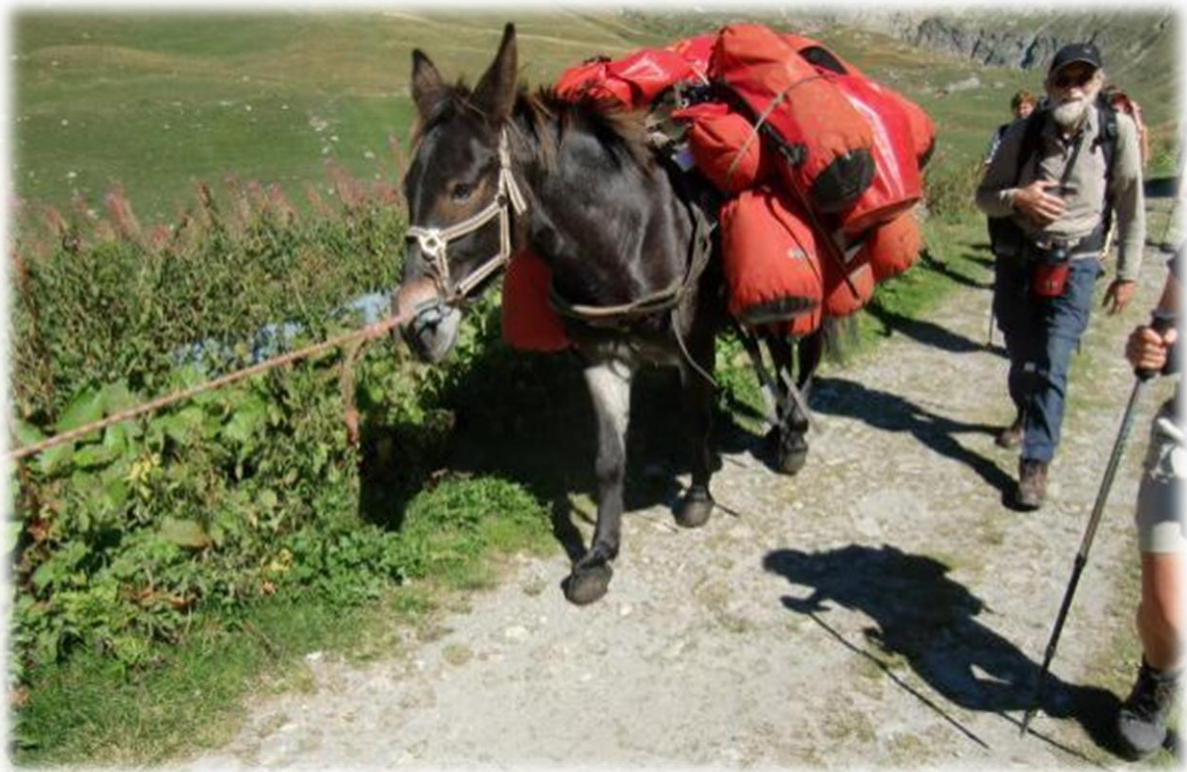
Er kruist ons een groep wandelaars die hun bagage laten dragen door een ezel. Alles is verpakt in waterdichte zakken.