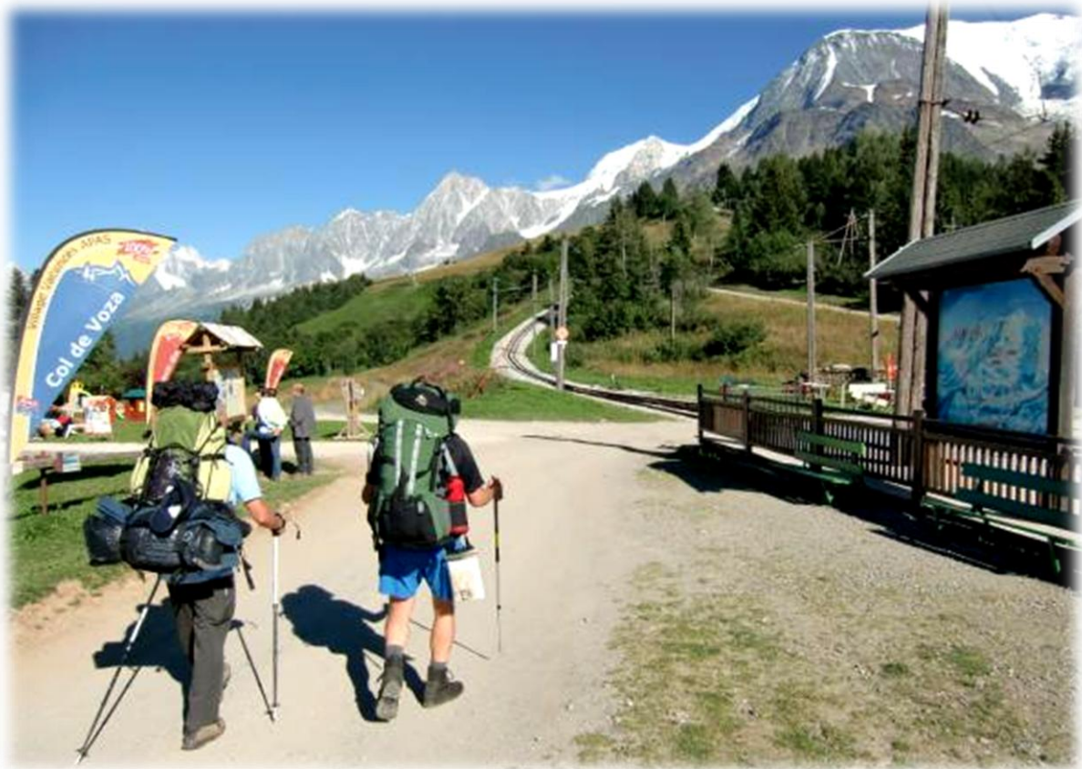
Op de Col de Voza krijgen we een eerste zicht op de Mont Blanc die voor het eerst beklommen werd op 8 augustus 1786 via de, achteraf bekeken, gevaarlijke route over de Glacier des Bossons.