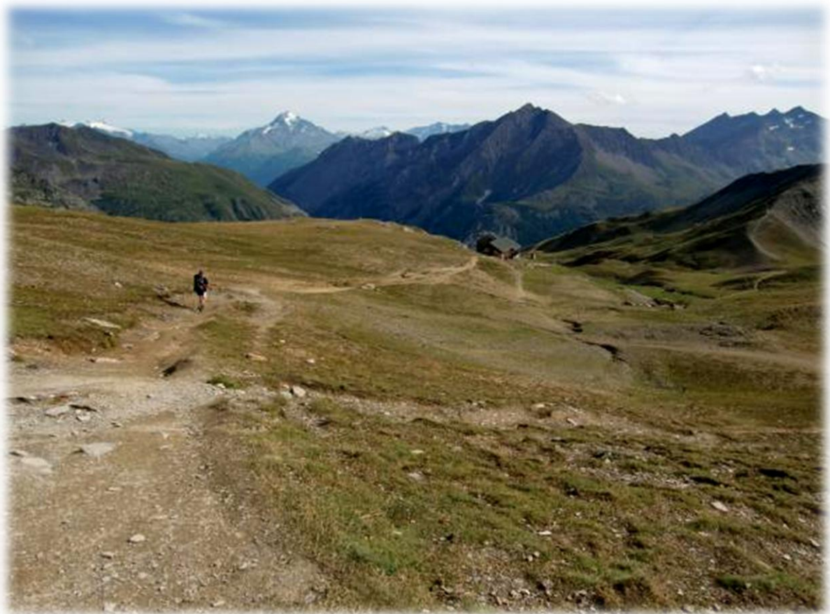
Refuge de la Croix du Bonhomme komt in zicht. De refuge is opgericht in 1924 door Touring -Club de France en kan honderd personen herbergen. Ze wordt bevoorrad per helicopter.