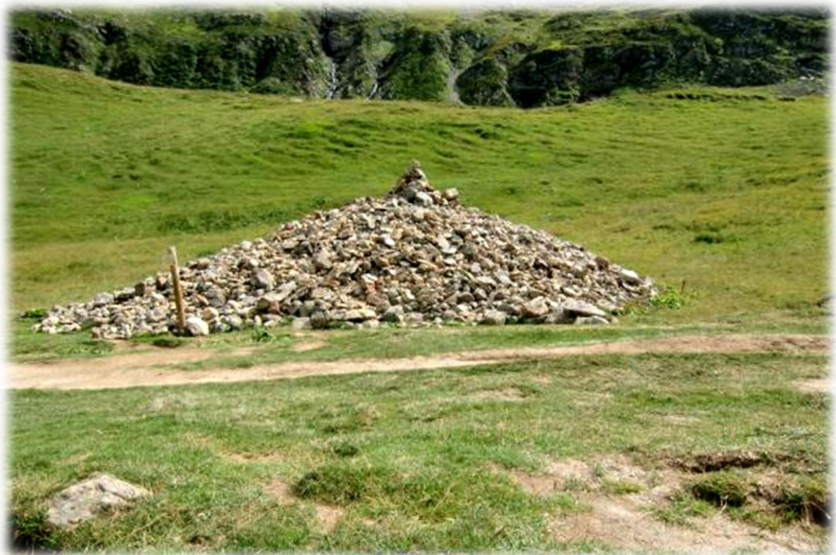
De tumulus, een grote berg stenen op Plan des Dames, ligt daar ter nagedachtenis aan een Engelse vrouw en haar begeleider die er in een verschrikkelijke storm zijn omgekomen.