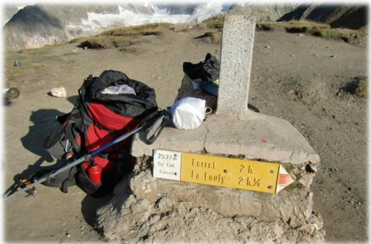
Op de col brengen we met ons vuurtje water aan de kook en maken koffie. Louis nuttigt het ontbijt op Italiaanse bodem en Ludwig ontbijt op Zwitserse bodem.