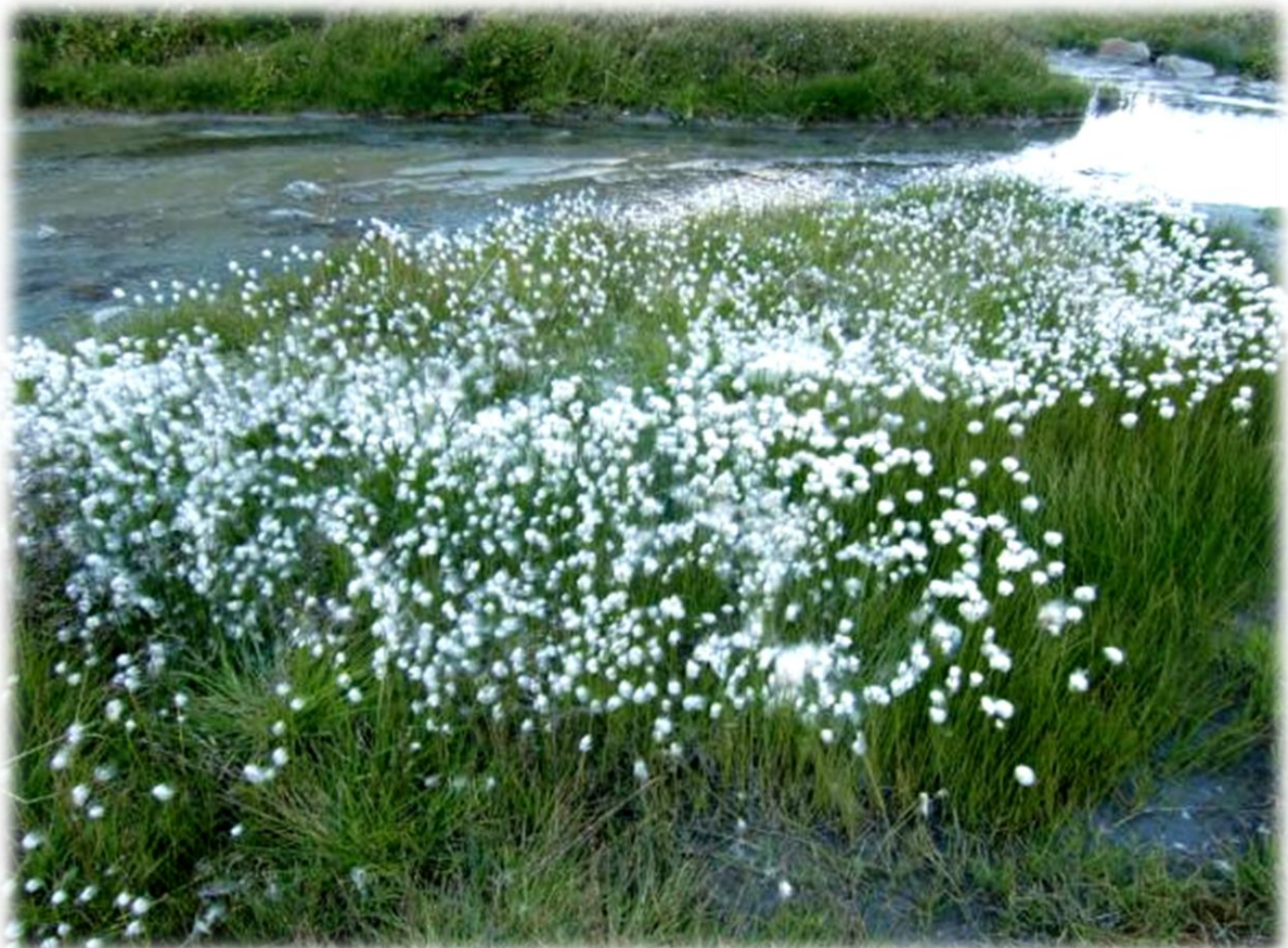
Veenpluis, groeit vooral op vochtige, zure grond. Opvallend is het lange, witte vruchtpluis, waaraan de naam ontleend is.