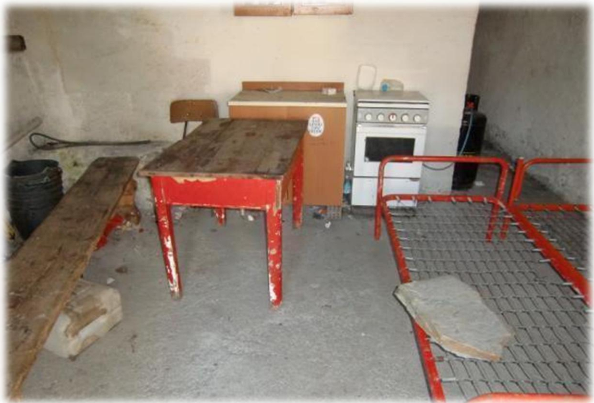
Onderweg komen we een onbemande hut tegen. Je kunt er makkelijk met meerdere personen overnachten.