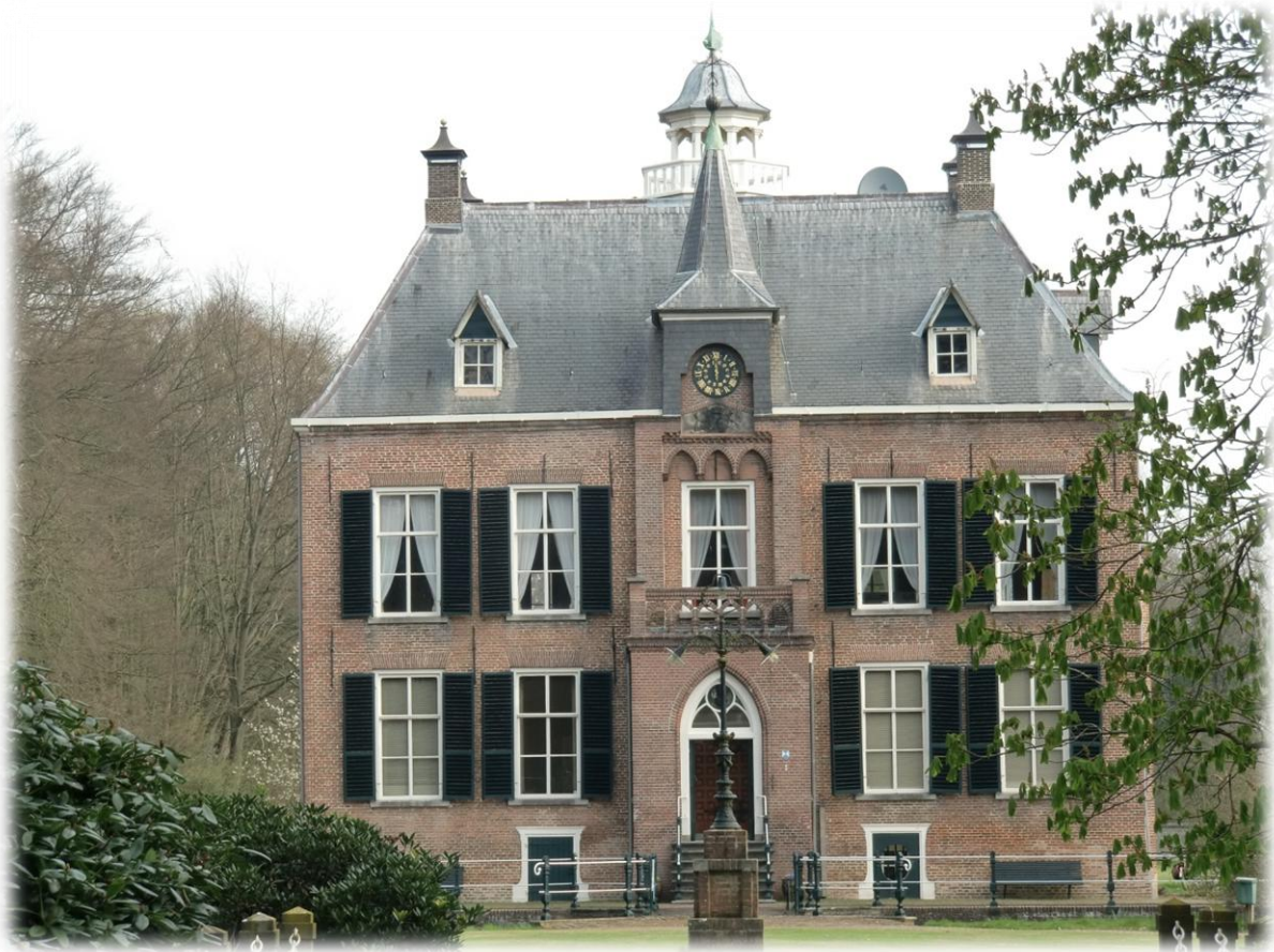
Huis "Den Bramel" in Vorden. Oorspronkelijk gebouwd in de 17 de eeuw maar nadien meerdere keren herbouwd en of gerestaureerd. Vroeger was het een kasteel, nu een landhuis.