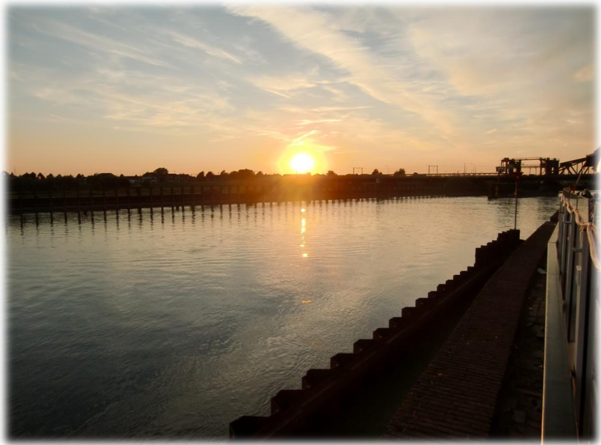
Ondergaande zon aan de IJssel.