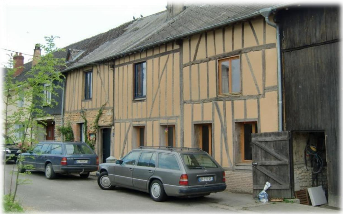
Het huis van Jos en Christelle. Ikzelf verblijf in het naburige huisje dat niet op deze foto te zien is.