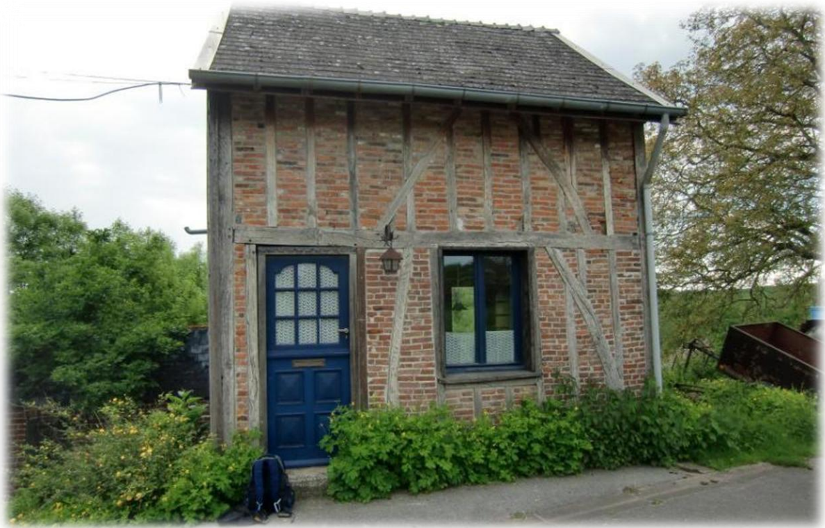
Op de foto bovenaan zie je het huisje zoals het was toen Jos het had aangekocht. Onderaan het huisje zoals het nu is. Ik verblijf in dit huisje voor drie nachten.