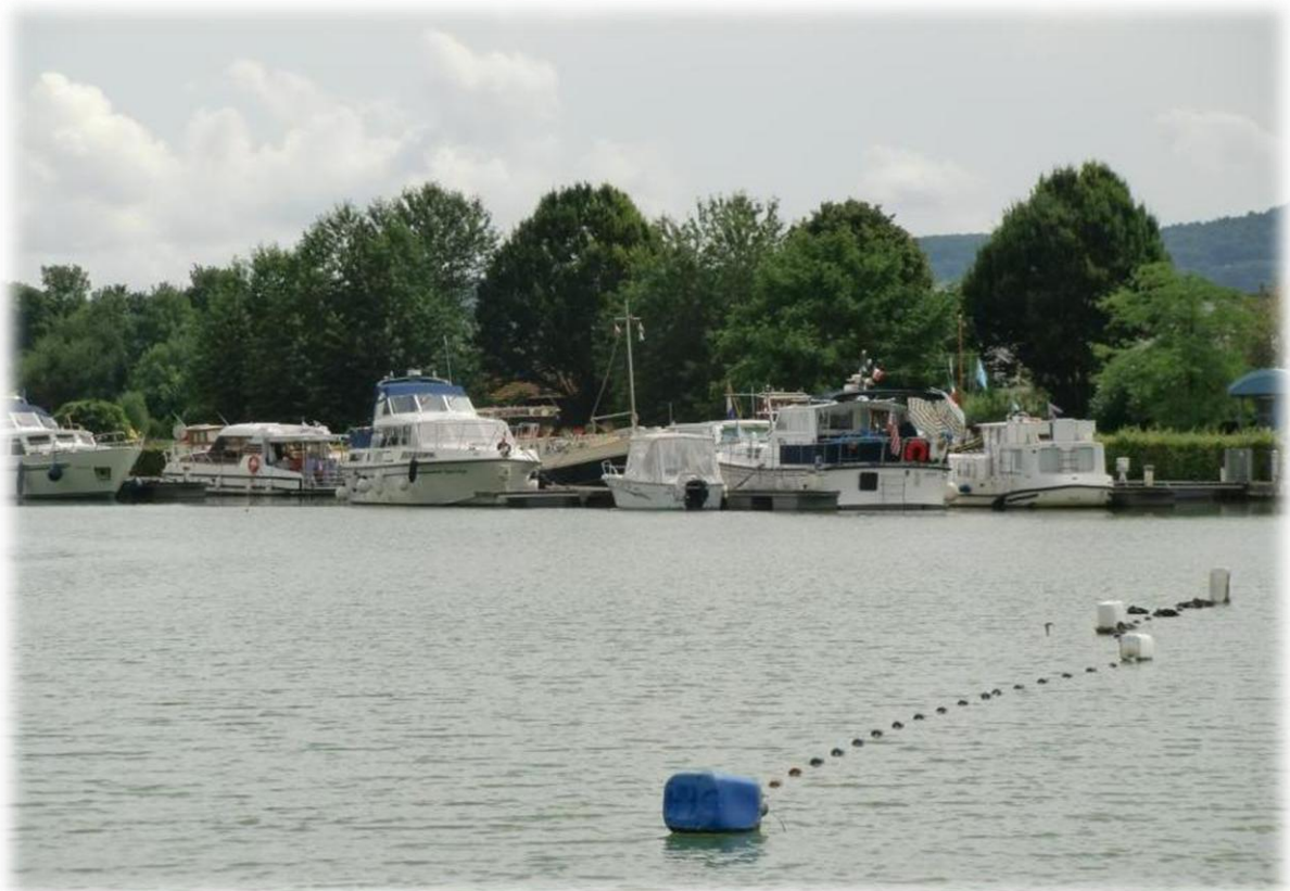
Ik volg de oevers van het kanaal Aisne-Marne. Dit kanaal is 58 km lang en heeft 24 sluizen. Het werd in 1866 in gebruik genomen maar moest na de Eerste Wereldoorlog heropgebouwd worden.