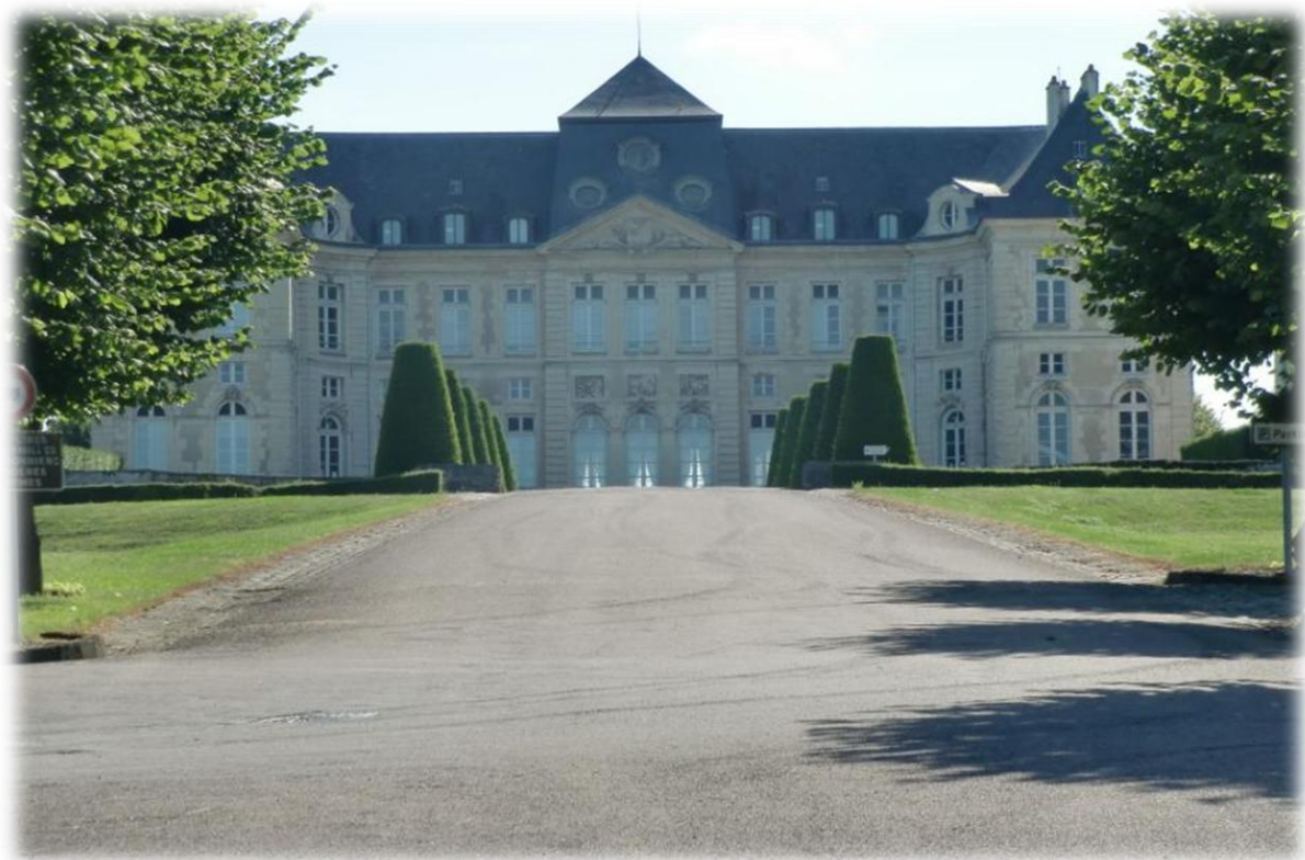
De stad heeft ook nog een kasteel (château) vandaar de naam Brienne-le-Château waar ze graag mee uitpakt maar veel stelt het kasteel niet voor.