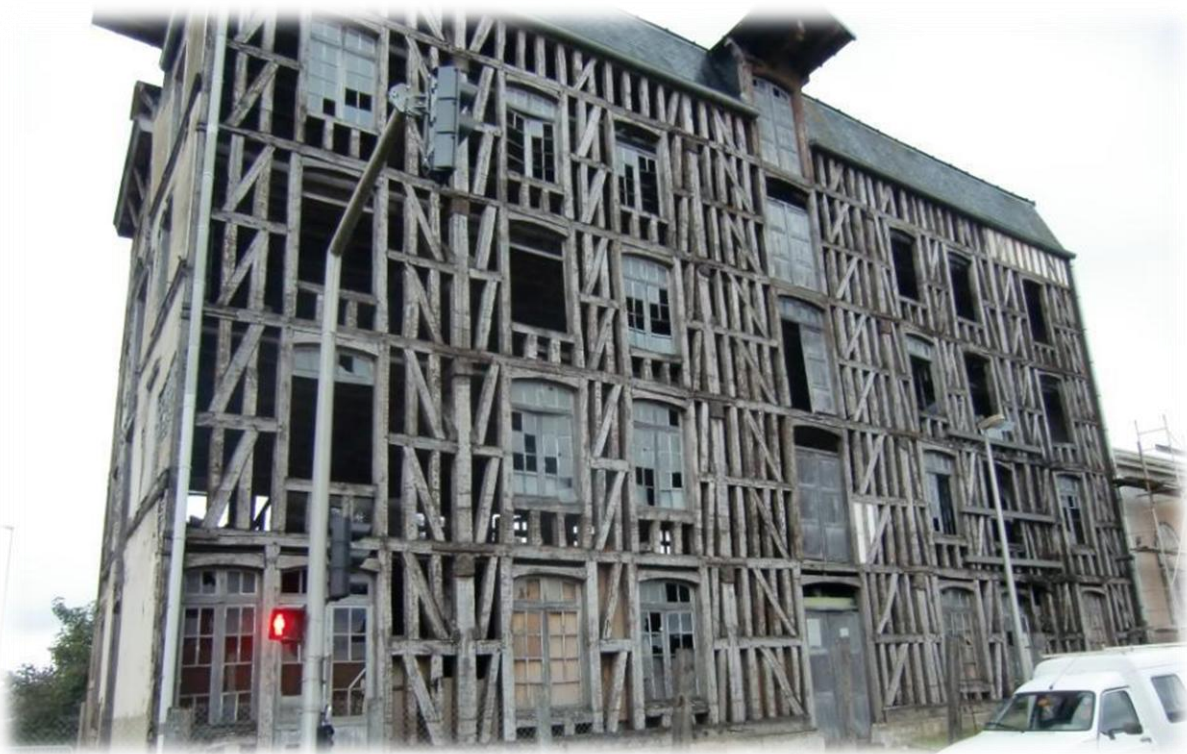
De waterkrachtcentrale in de Seine moet ooit een schitterende vakwerkmolen geweest zijn. Nu giert de wind door de houten balken.