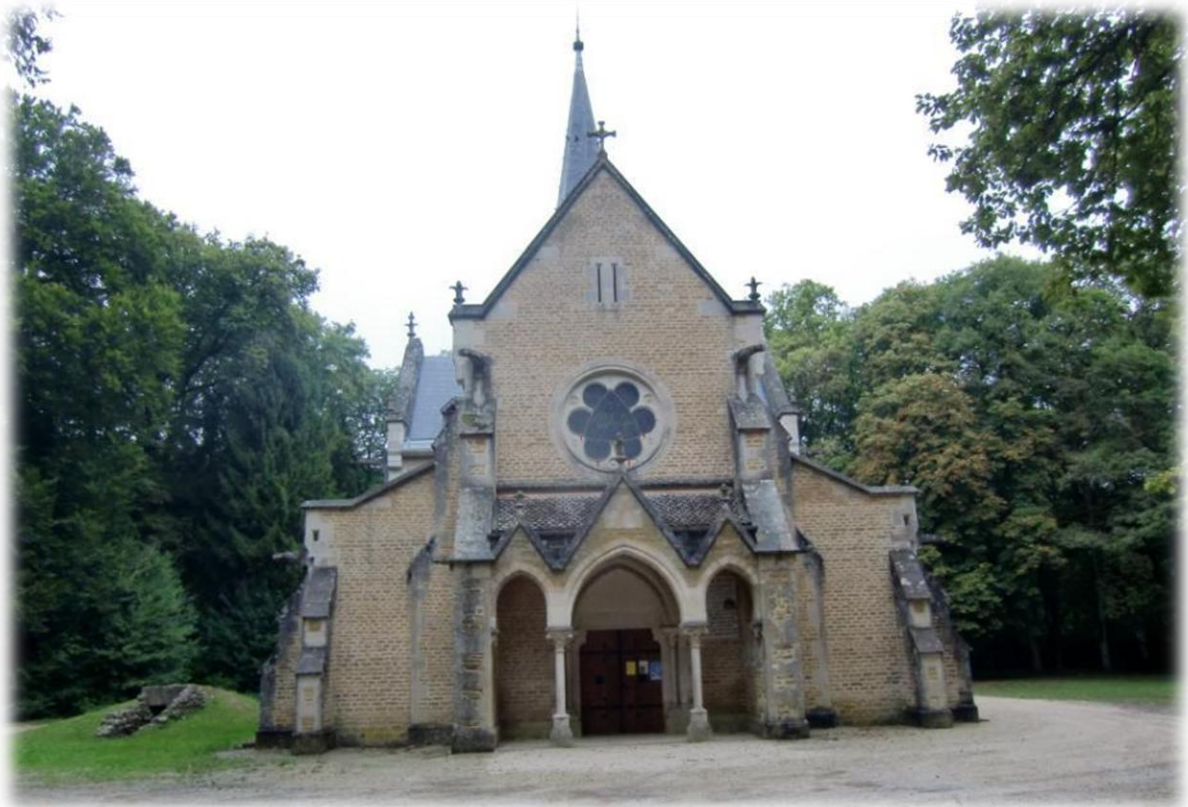
Helemaal boven op de heuvel staat midden in het bos de chapelle Notre-Dame-du-Chêne.