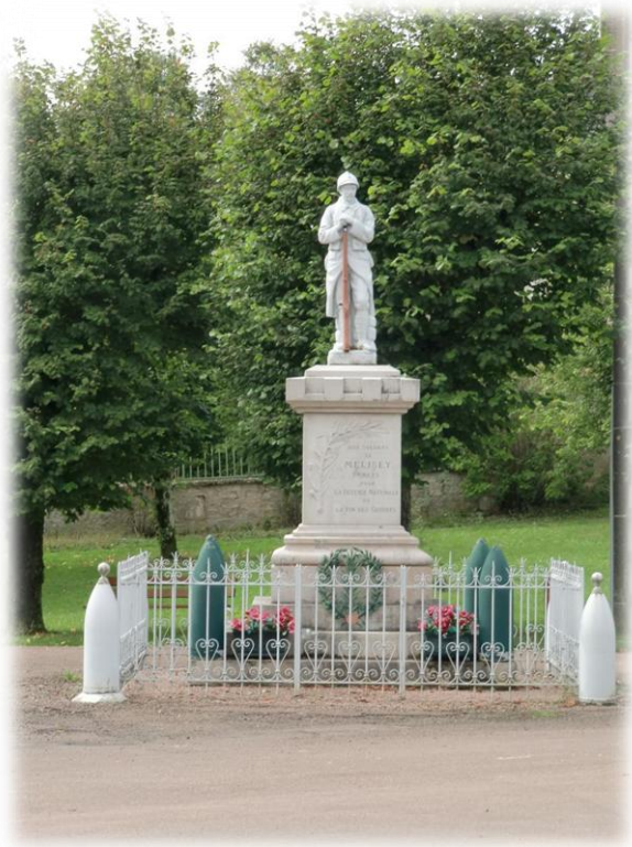
De kerk van Mélisey is in verval en wordt nauwelijks nog gebruikt. Tegenover de kerk staat een gedenkteken voor de gesneuvelden van beide oorlogen.