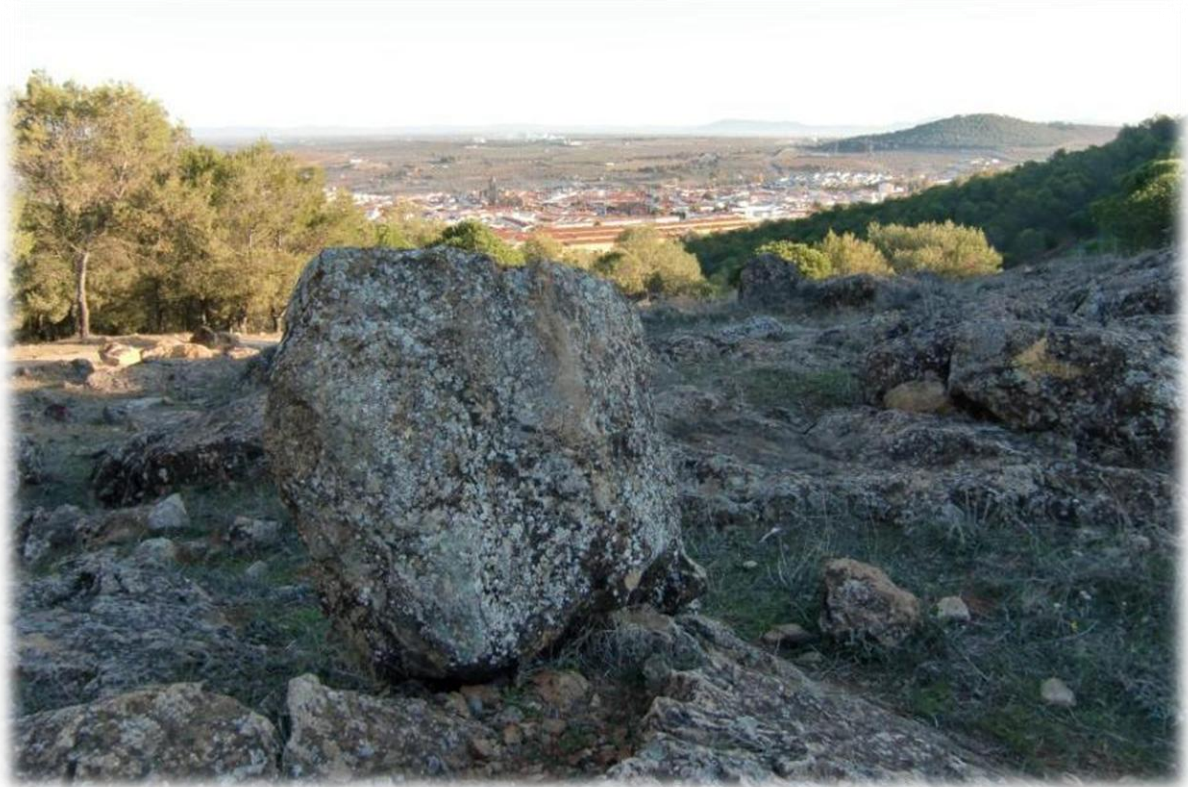
De Via de la Plata, ook wel Zilverroute of GR 100 genoemd, werd ooit aangelegd door de Romeinen tussen Sevilla en Asturië om het noorden en zuiden van Spanje te verbinden. Hierdoor konden zij het zilver dat ze in de Siërra de Gata wonnen makkelijker vervoeren. Na het sluiten van de zilvermijnen werd de route vooral gebruikt om grote kudden schapen van zuid naar noord te brengen.