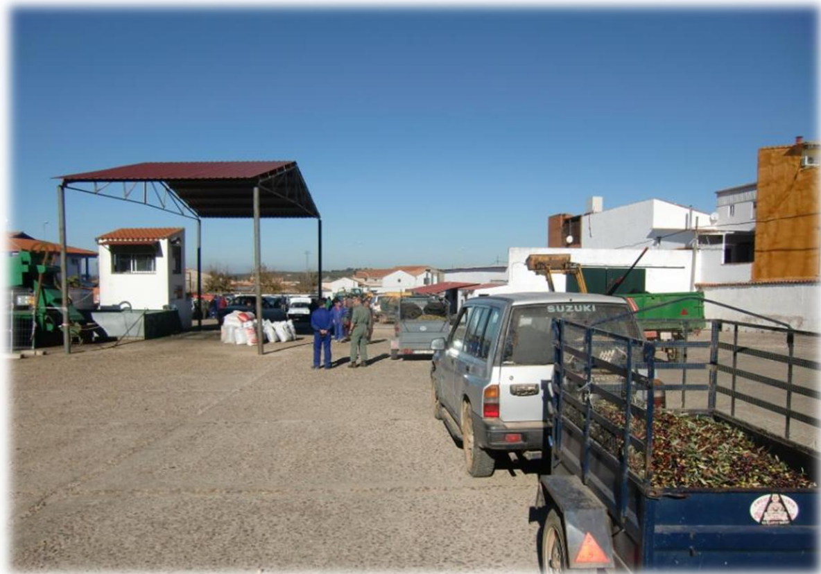
De oogst van de olijven is volop aan de gang en het is aanschuiven om de olijven af te leveren bij de groothandel. Ik merk nu ook dat alle olijven geoogst worden of ze nu rijp zijn of niet.