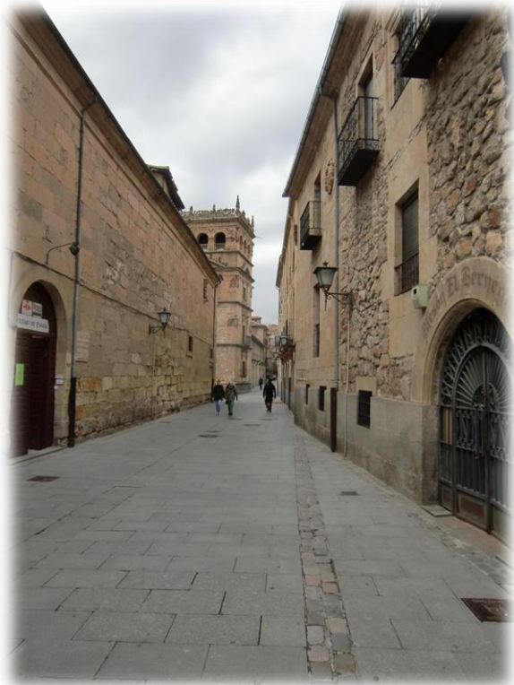
Een van de muren van de basiliek is bezet met jacobsschelpen. Salamanca is de hoofdstad van de gelijknamige Spaanse provincie Salamanca, gelegen in de regio Castilië en León, circa 200 km ten westen van Madrid. De stad is gesticht rond 400 V.C.