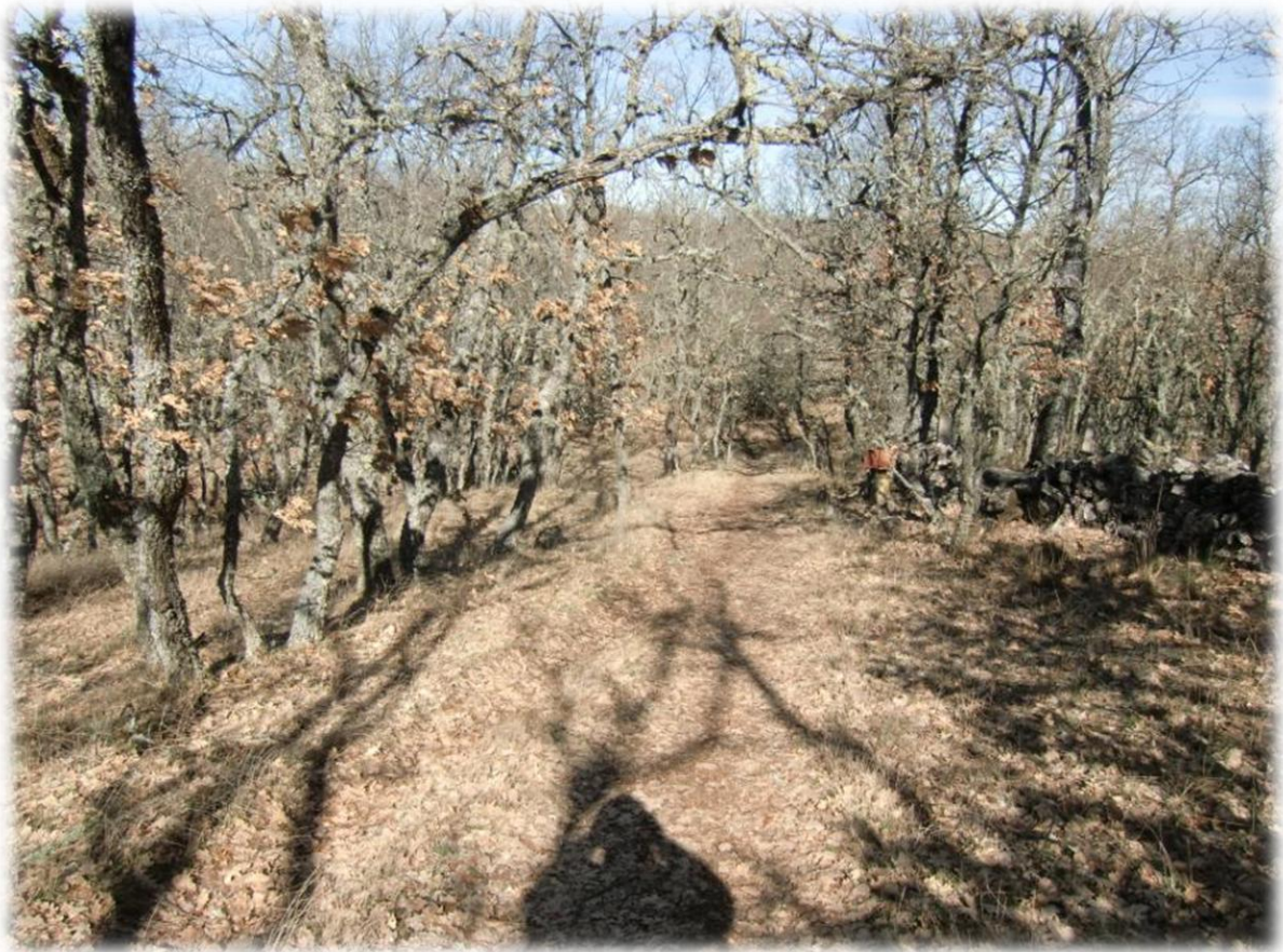
We stappen door een mooi bos waarvan de boomstammen volledig bedekt zijn met korstmossen.