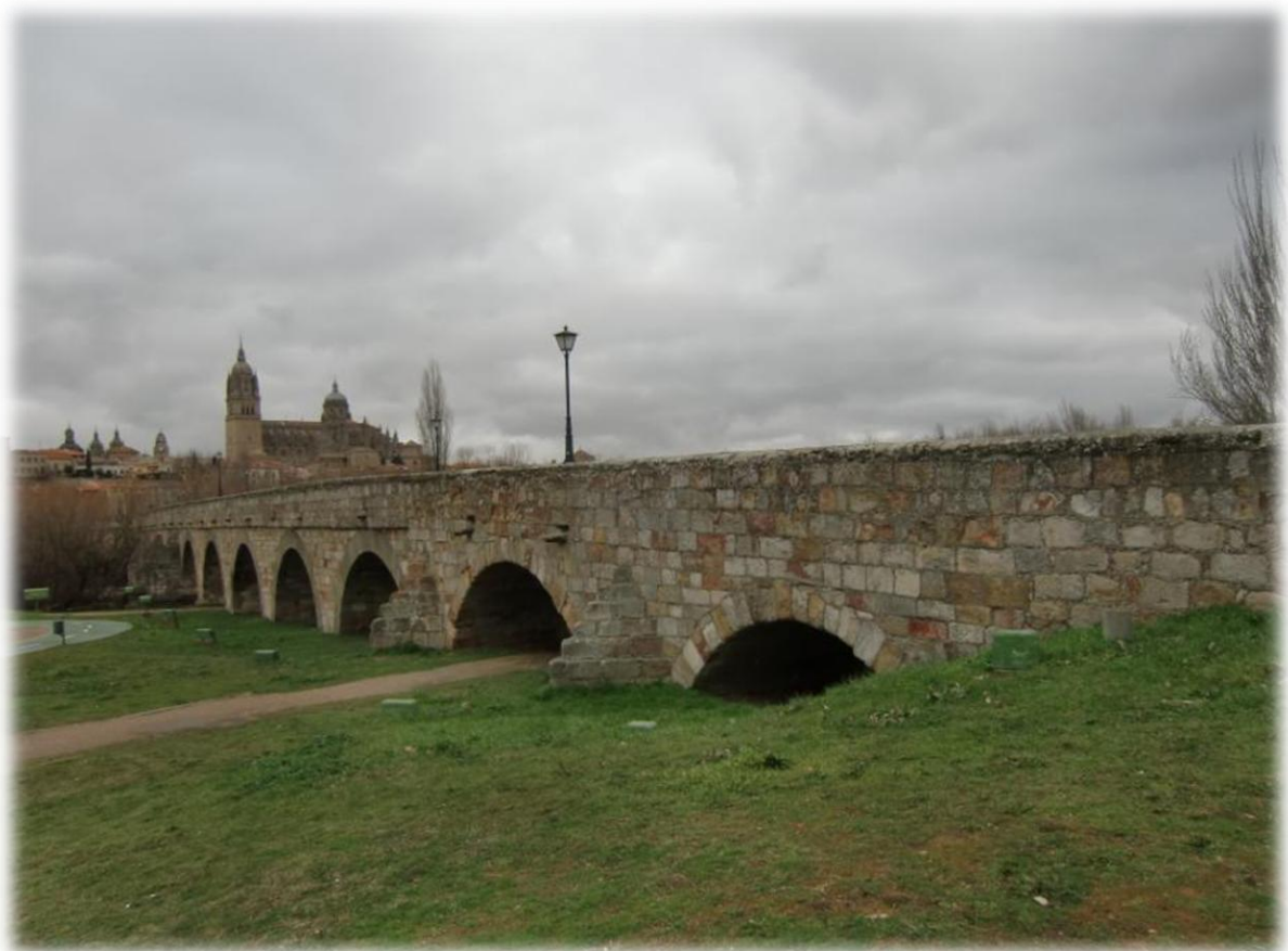
De Puente Mayor del Tormes is een brug met 26 bogen en dateert uit de Romeinse tijd. De datum van de bouw van de brug is niet precies bekend, maar is gelegen tussen de mandaten van de keizers Augustus (27 v.Chr-14 n.Chr) en Vespasianus (69-79).