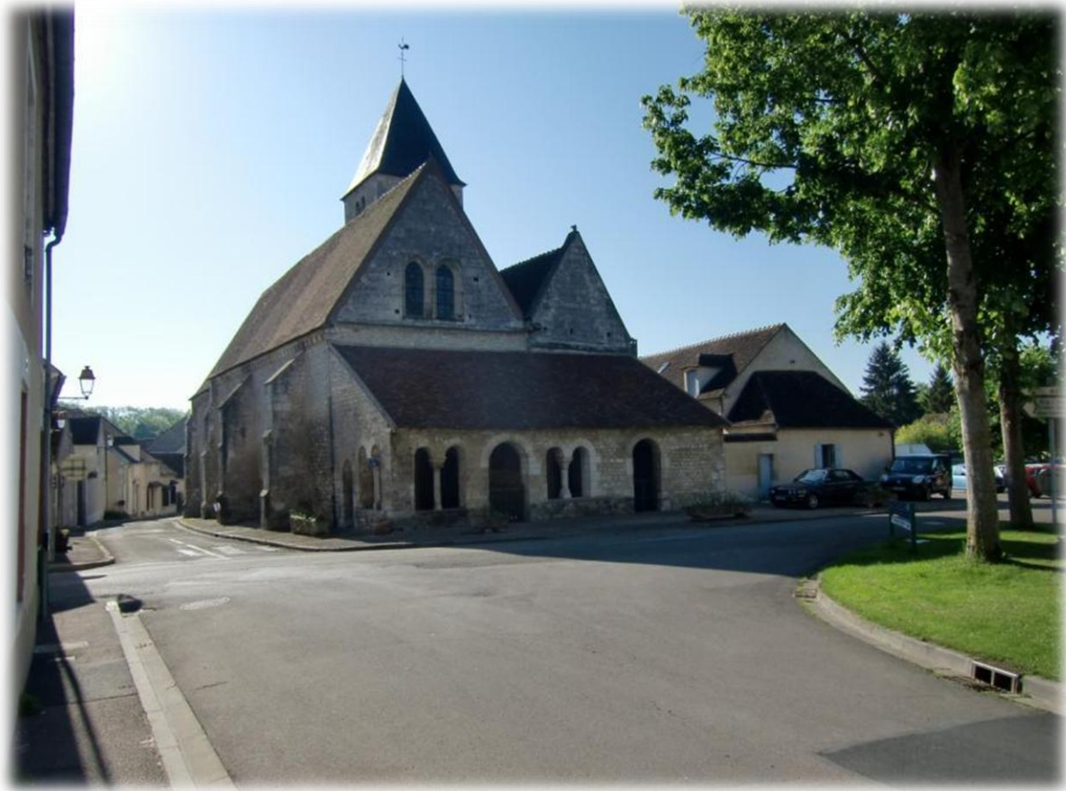
Nog 2.054 km staat er hier op een paaltje. Het lijkt veel maar in denk toch in Santiago de Compostela aan te komen in mei 2016.