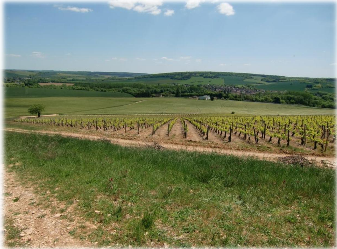
Wijngaarden verminderen nu in aantal. Bossen en landbouwgrond domineren nu meer en meer het panorama.