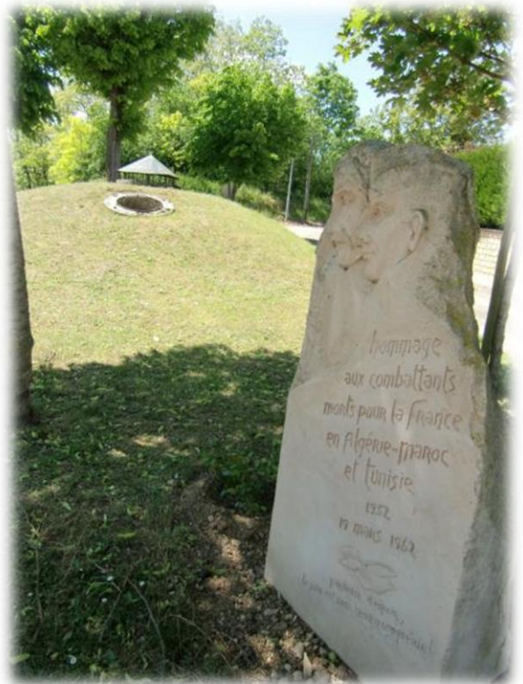
Het schilderachtige dorpje Cravant bezit nog steeds de witte toren van het vroegere belfort. Ook een oorlogsbunker heeft men bewaard in het centrum van het dorp.