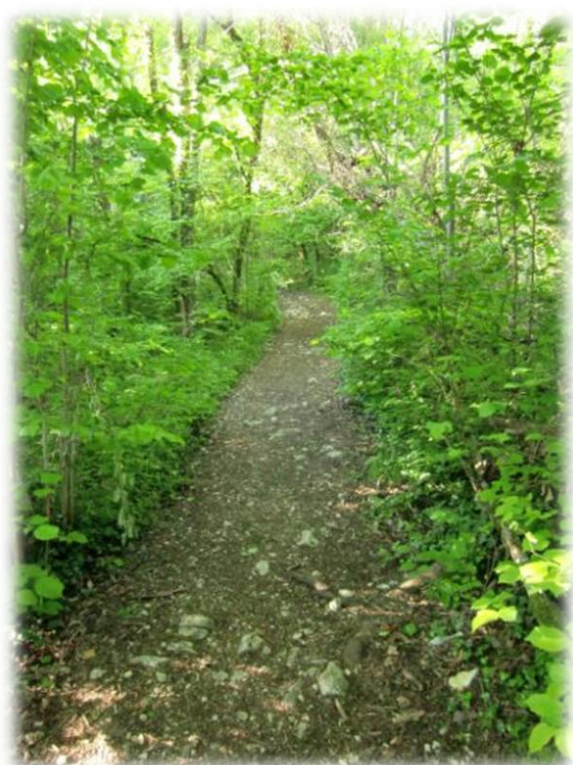
Mijn wandeltocht zet zich verder langs de muren van het kasteel van Arcy-Sur-Cure. Dit dorp is ook bekend voor zijn druipsteengrotten die door het publiek kunnen worden bezocht.