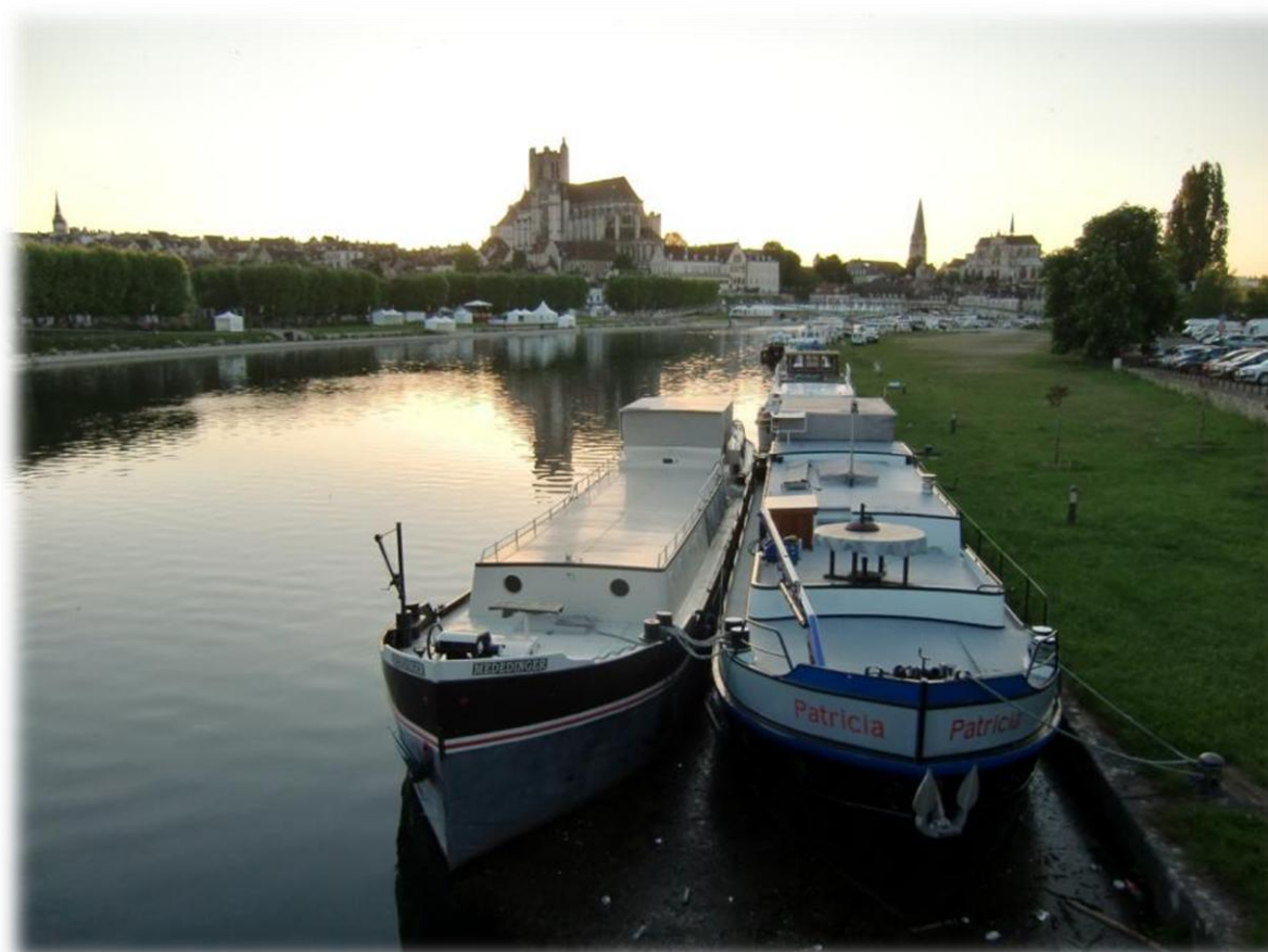
Auxerre is de hoofdstad van het departement Yonne (Bourgondië) en ligt aan de rivier Yonne. De belangrijkste industrieën zijn de handel in wijn uit Chablis, de textielindustrie en de houtindustrie.