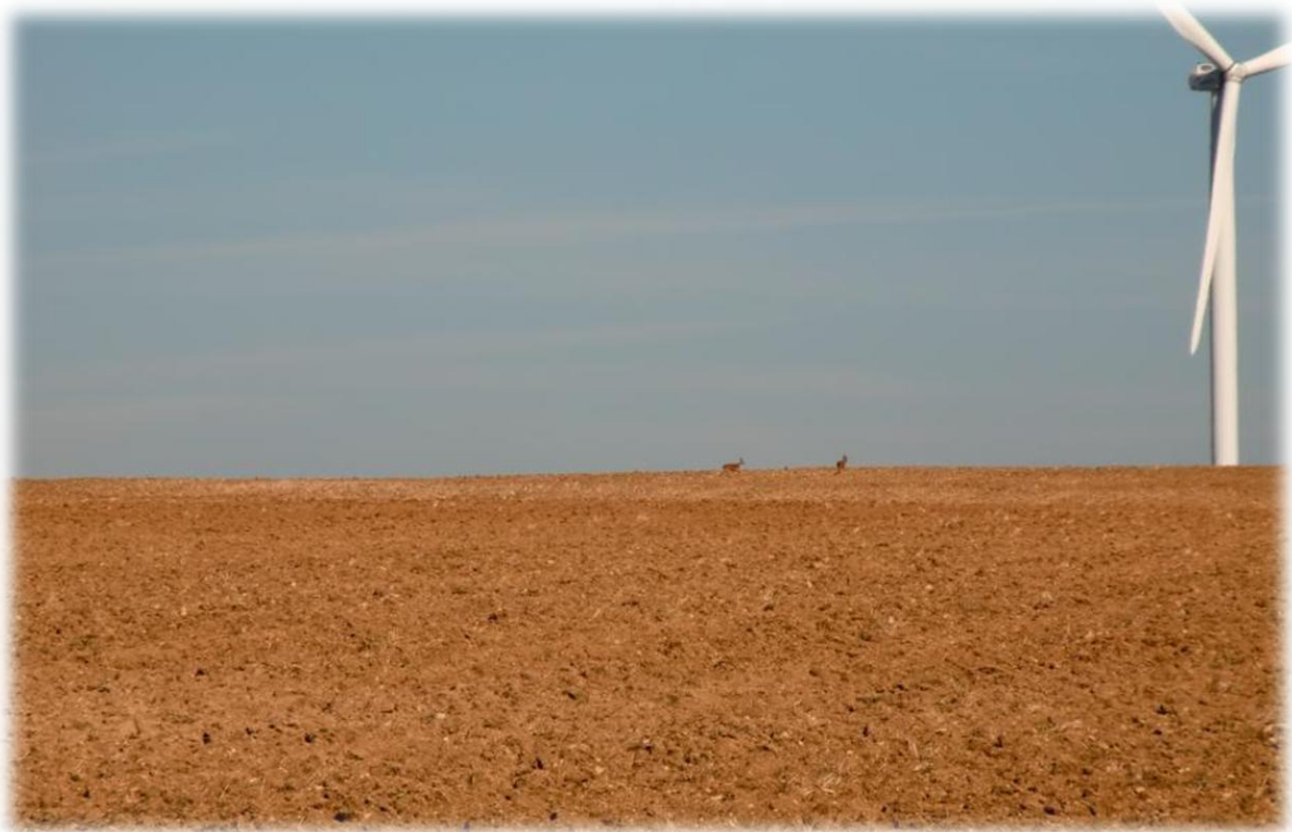
Enkele reeën lopen over een pas geploegd veld. Men is hier tevens reeds bezig met het binnenhalen van de oogst.