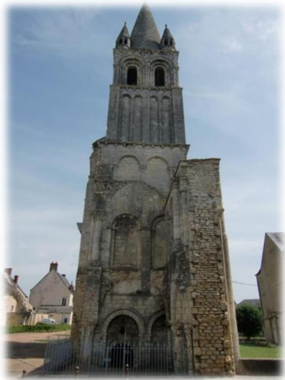
In Déols staan nog de overblijfselen van de Benedictijner abdij Notre-Dame-Du-Bourg-Dieu. De bouwwerken van de abdij zijn begonnen in 917 en werd herbouwd in 1150.