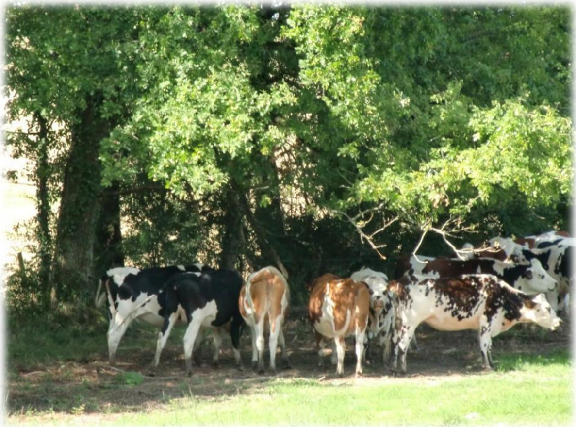
De Limousinkoe heeft vanaf hier definitief afgedaan. Hier zijn het terug de kleurrijke koeien wit-zwart en wit-bruin. Links boven een schaduwpelgrim.