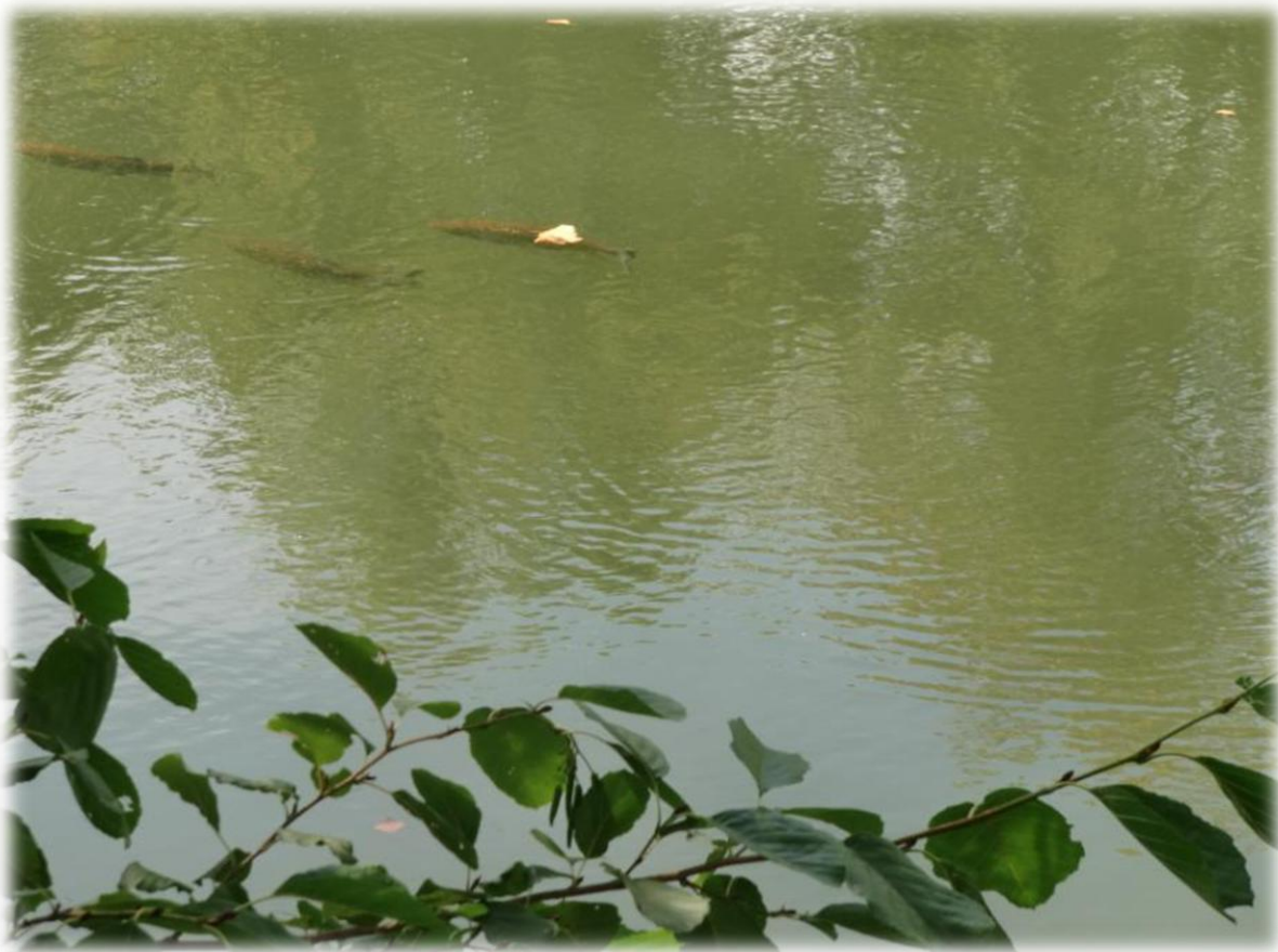
De rivier Isle deelt de stad in twee. De Isle ontspringt ten noorden van Thiviers en mondt uit in Fronsac in de Dordogne. De Isle is 235 km lang en dat er vis op zit is wel duidelijk.