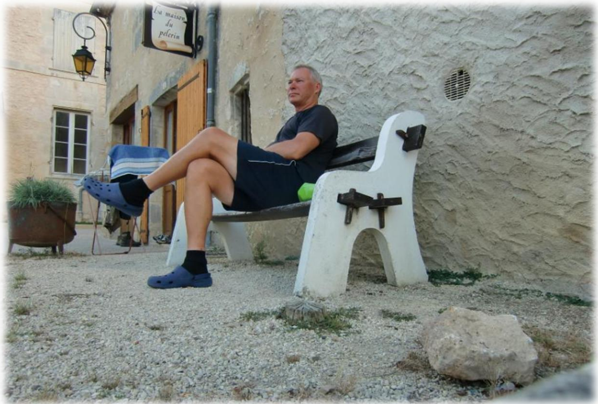
Het boomstronkje (schelp) juist voor de bank.