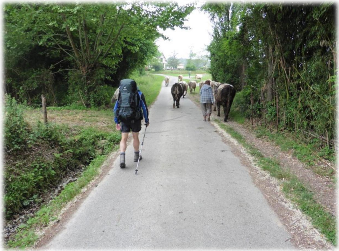
Uit een zijweg komt een kudde koeien. De boerin doet ons teken om achter het vee te blijven. De koeien hebben hier duidelijk voorrang.