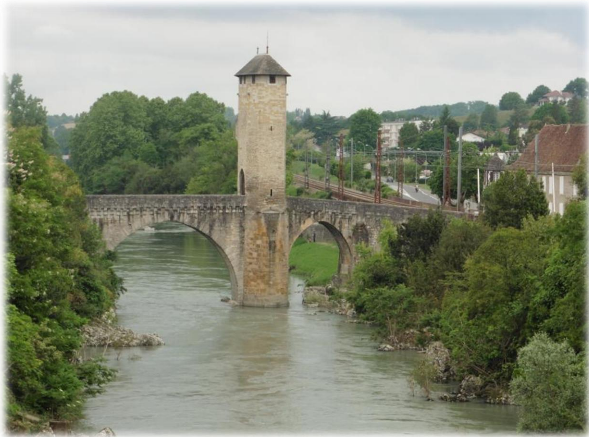
De versterkte oude brug uit de 13 de eeuw, over de Gave de Pau werden in augustus 1569 de aanvallende Hugenoten tegengehouden.