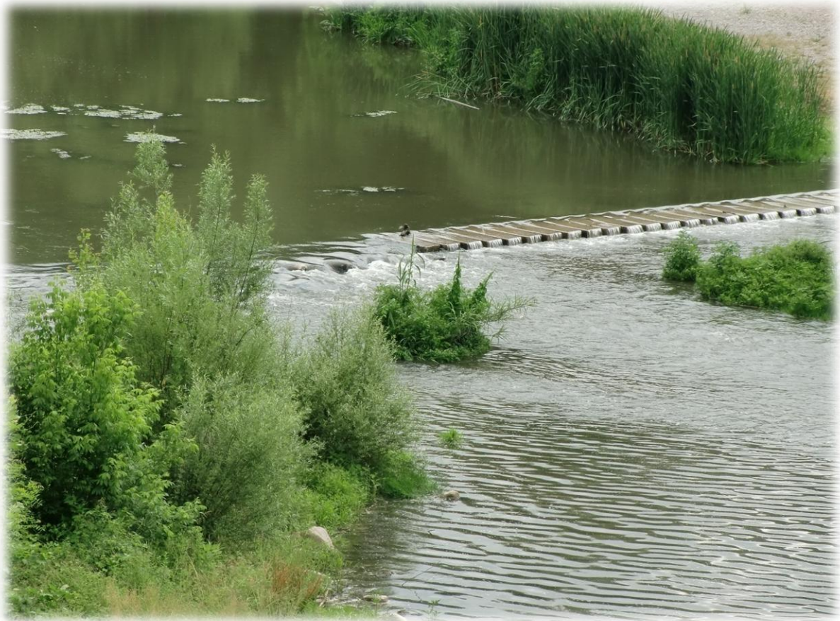
De rivier Fluvia ontspringt in Garrotxa op 920 m hoogte en heeft een lengte van 97,2 km en mondt uit in Aiguamolls.