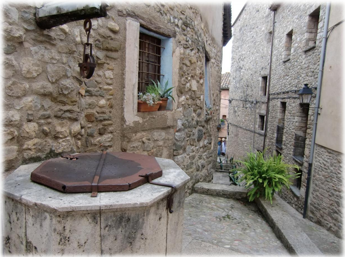
Besalú heeft heel wat bronnetjes. Hier en daar treft men dan ook nog de overblijfselen aan van waterputten die nu niet meer in gebruik zijn.