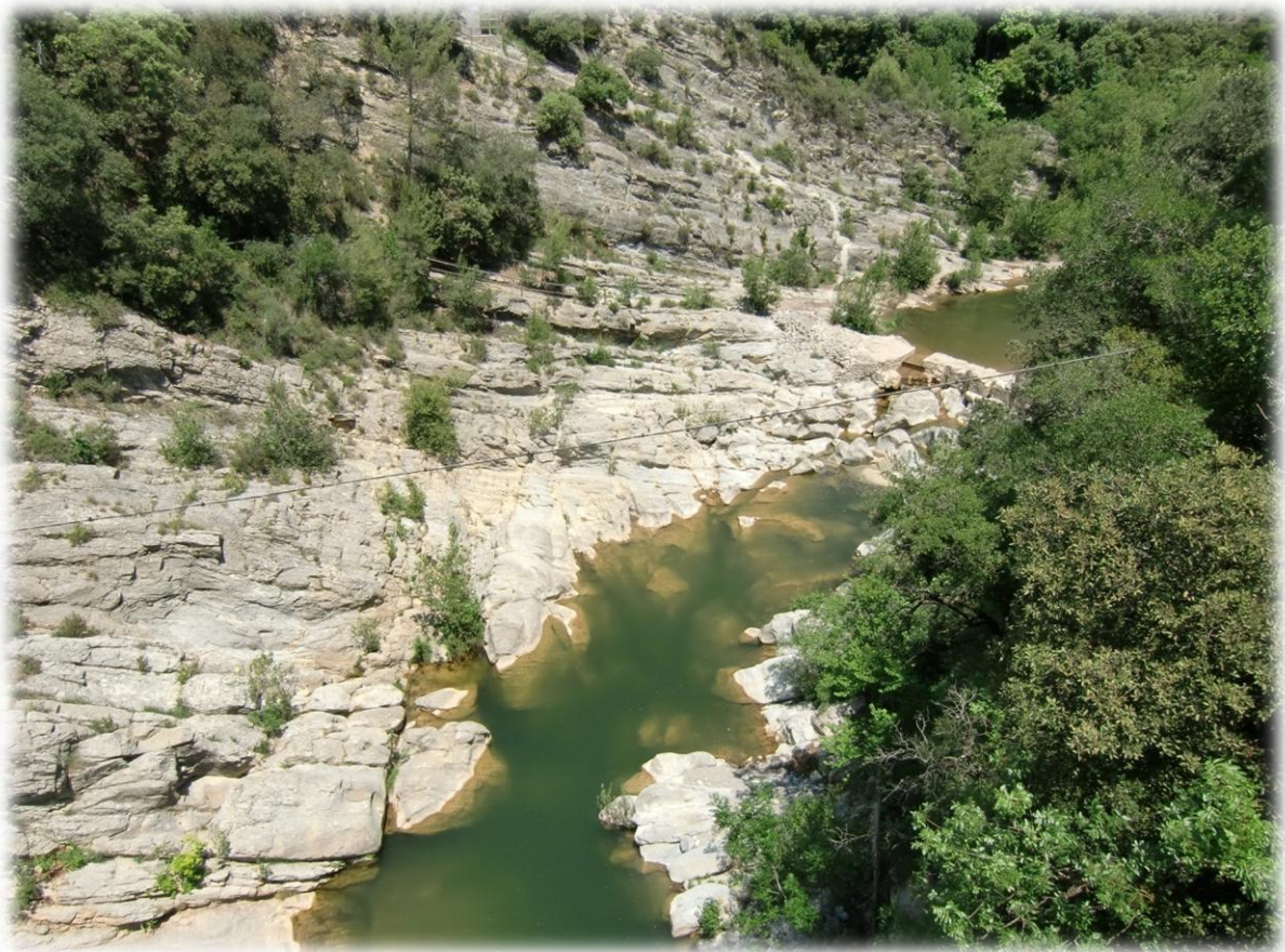
Het gebied waar we nu inlopen lijkt soms wat op het noorden van Corsica.