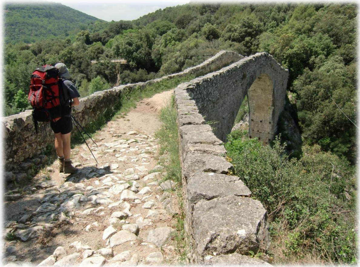
De Romaanse brug over de rivier de Llierca. La Garrotxa heeft een uniek vulkanisch gebied. Dat bestaat uit 30 kraters en een beschermd gebied van ruim 12.000 hectaren. Het is een land van mythen en bandieten.