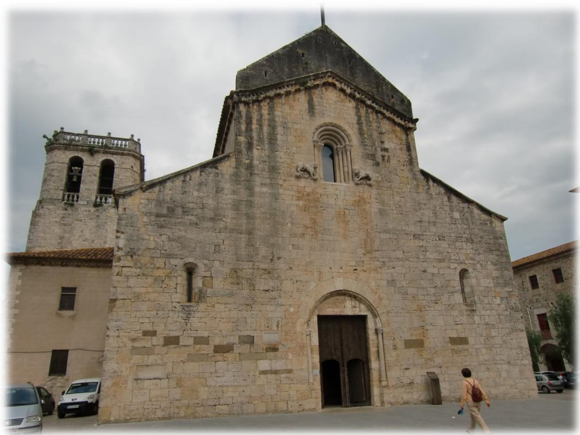
Het klooster Sant Pere met klokketoren werd in de twaalfde eeuw gebouwd op de fundamenteën van de kerk Sant Pere. In het klooster zijn 6 graven van vroegere abten en graven.