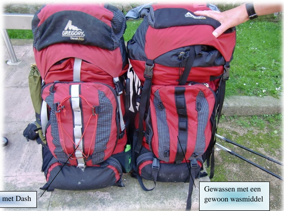
Gewassen met Dash