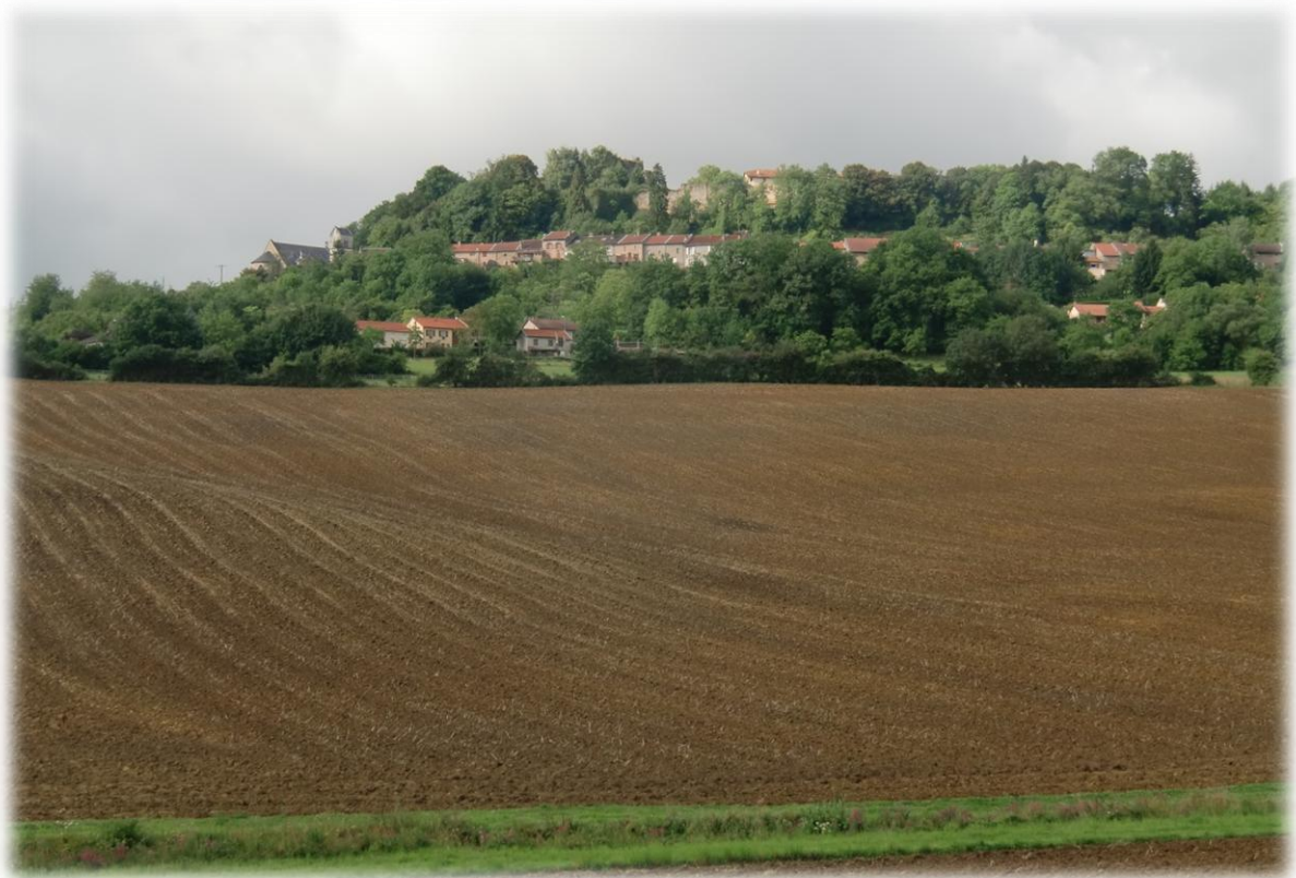
Op de achtergrond zien we hoog boven de Moezelvallei het dorpje Prény dat eveneens op onze route ligt.