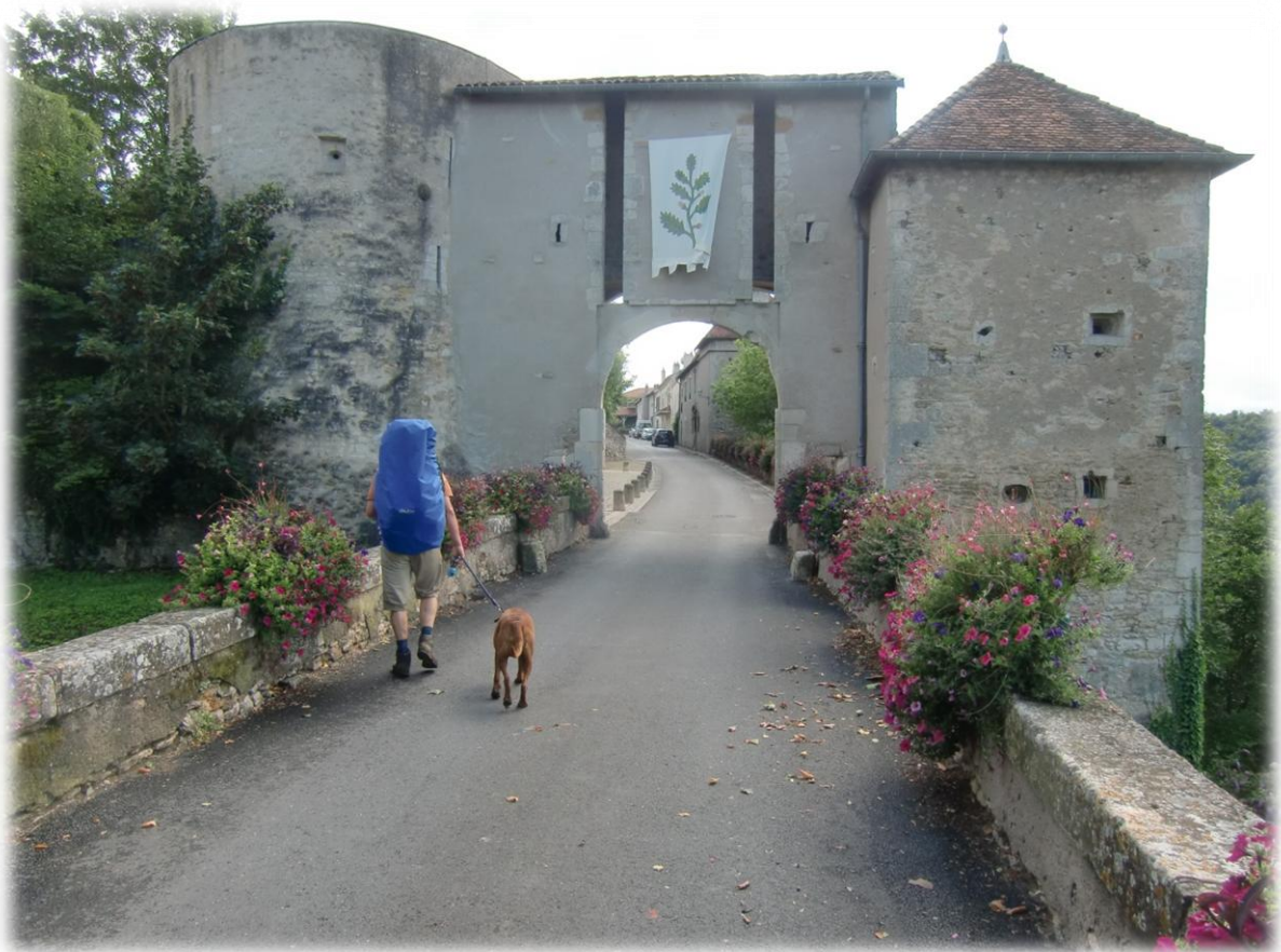
We komen in de bovenstad van Liverdun. Het oorspronkelijk versterkte middeleeuwse stadje ligt heel schilderachtig op een vooruitspringende rots in een bocht van de Moezel.