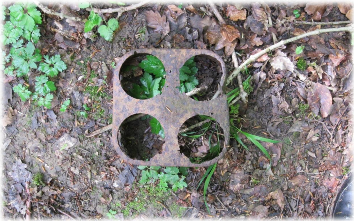
Henk heeft in de buurt van een bunker een oud roestig voorwerp gevonden. Hij denkt dat het de verpakking is van mortieren.