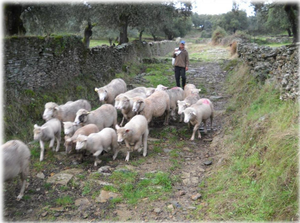
Een boer laat zijn schapjes uit. De schapen doen niet wild terwijl we hen kruisen, ze zijn blijkbaar mensen gewend.