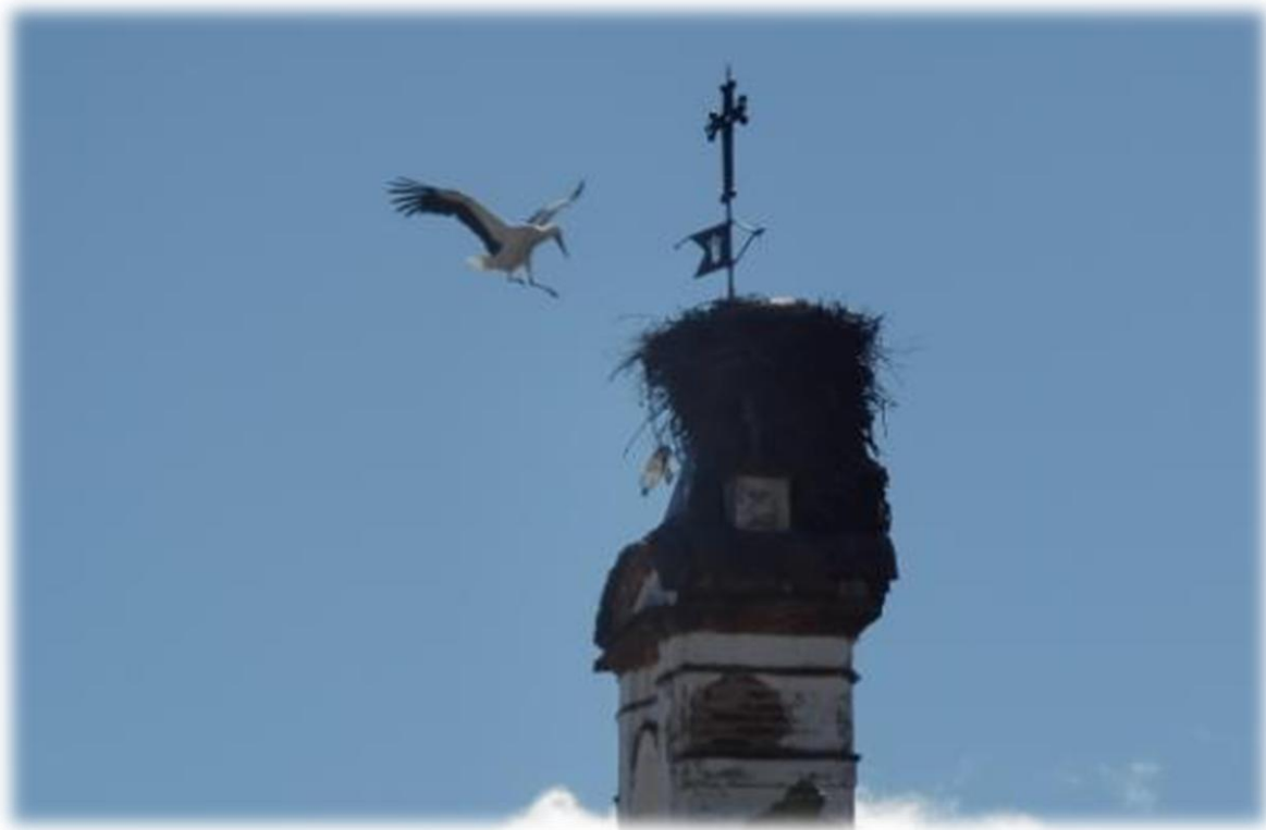
Een ooievaar heeft net enkele rondjes rond het dorp gevlogen en maakt nu een perfecte landing op het nest.