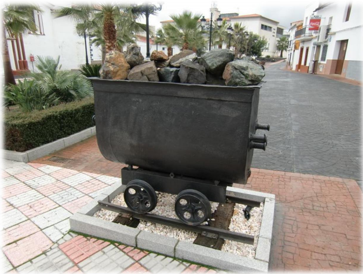
In Cala staat nog een mijnwagonnetje waarmee het erts naar boven werd gebracht. De pelgrimsroute Via de la Plata, ook wel de zilverroute genoemd, passeert hier in de buurt.