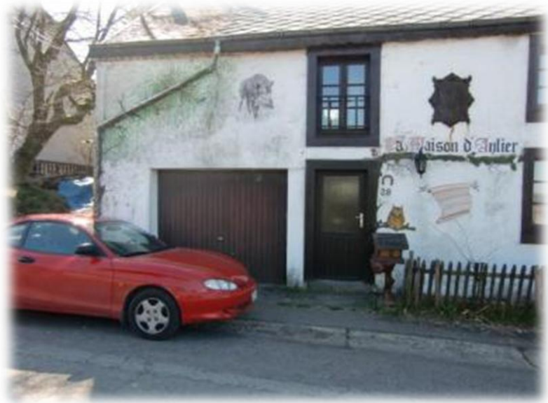
Links een wel erg originele brievenbus. Rechts een beschilderde voorgevel. Let ook eens op de afvoerbuis waar men een boom heeft van gemaakt.