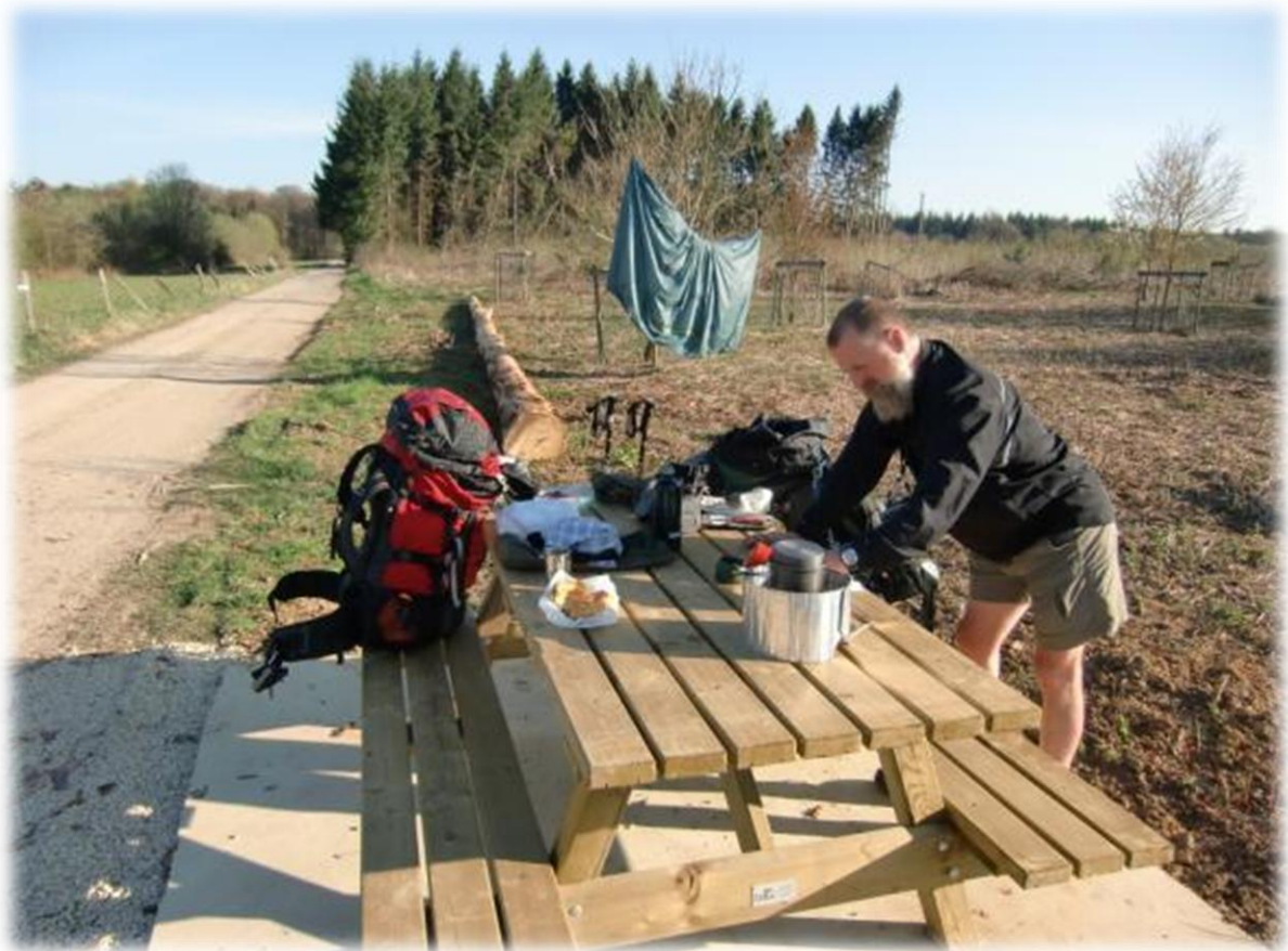
Rond 09.00 uur maken we koffie, eten verse koffietoek van de Spar en laten de tent drogen.