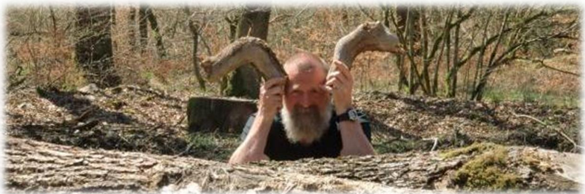
Kijkt zegt Staf, ik ben een duivel.