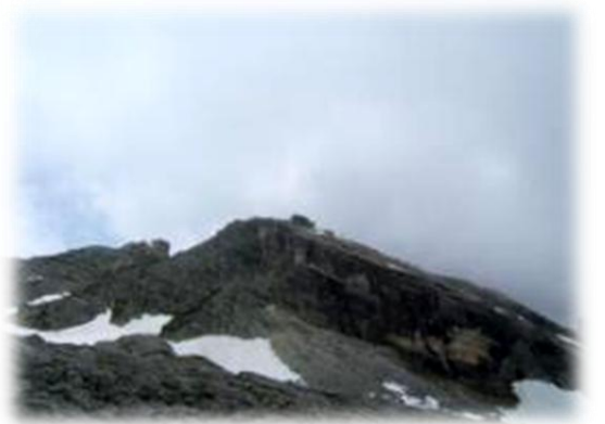
De klettersteig bevindt zich op de linker foto. Van aan de punt schuin links naar beneden (boven de rode lijn)