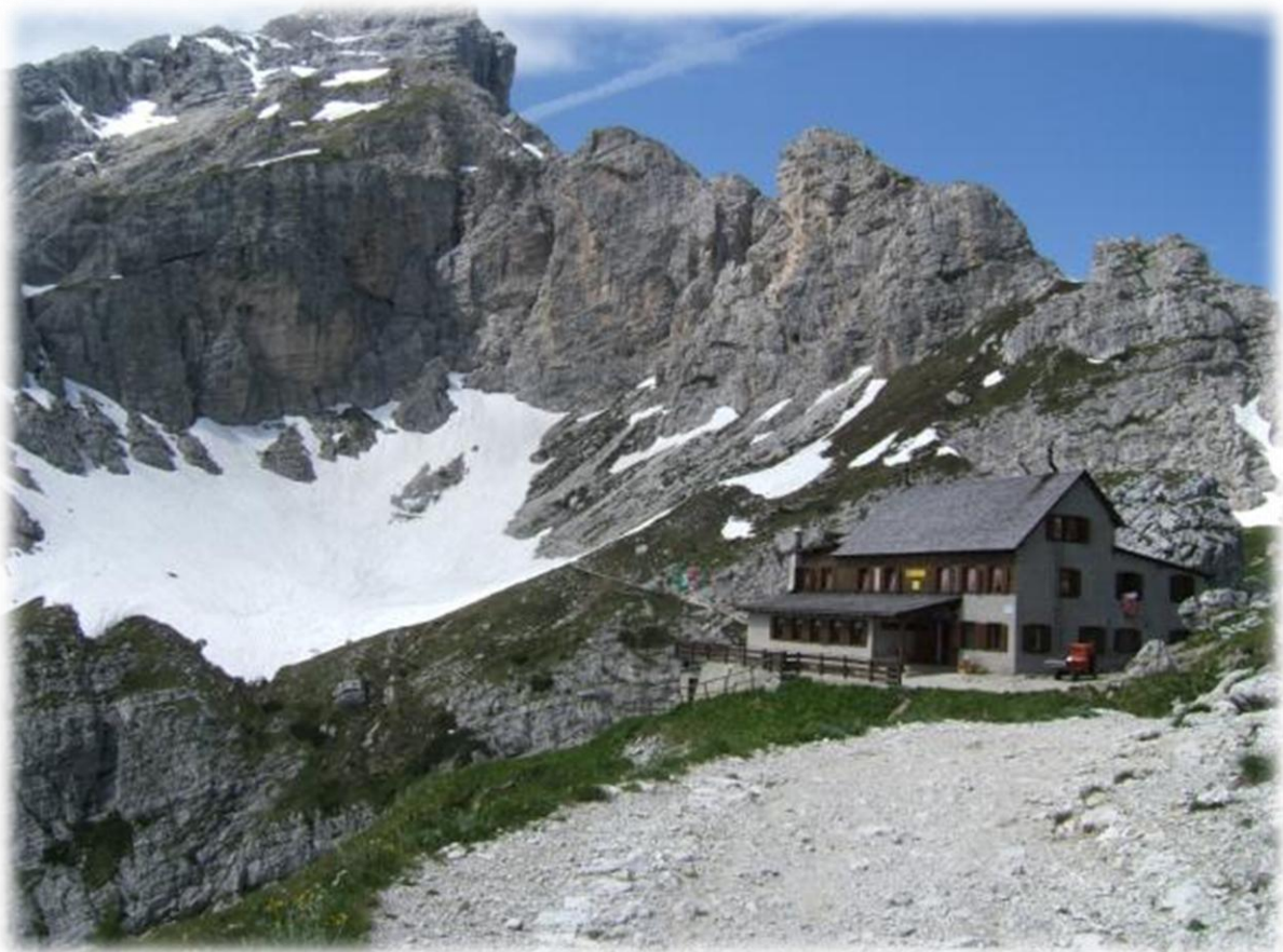
Na een flinke klim komen we aan Rifugio A. Sonino (2.132 m). De refuge is al open.