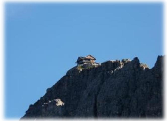
Rifugio Nuvolau ingezoemd en vergroot