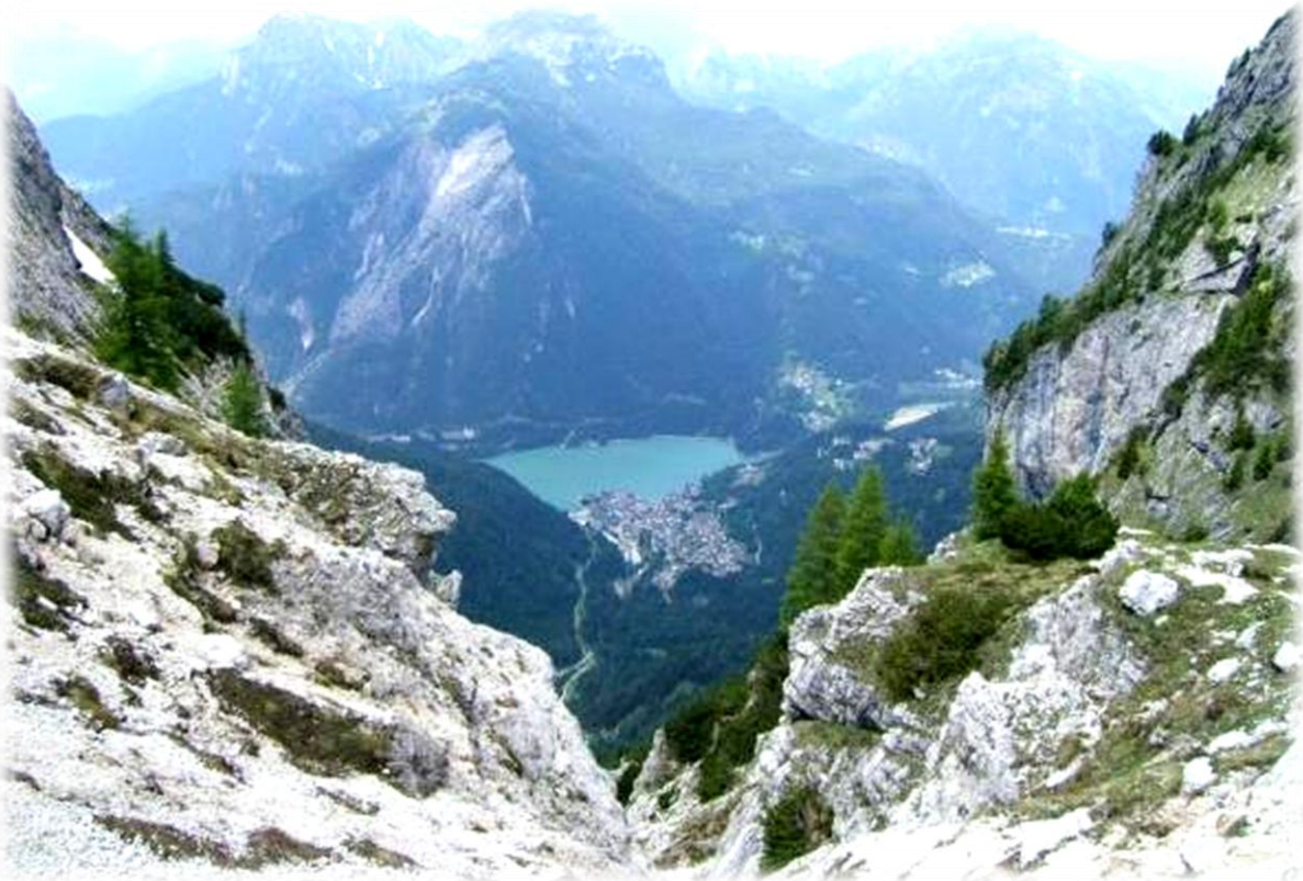
Zicht op het Lago di Alleghe (966 m)