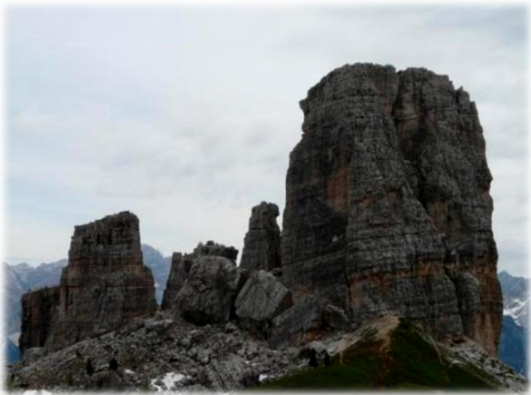
We passeren de alom bekende rotsformatie Cinque Torri