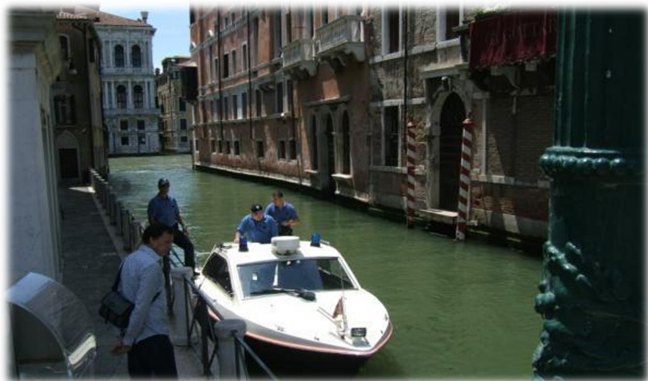
Ook de politie doet het in een bootje