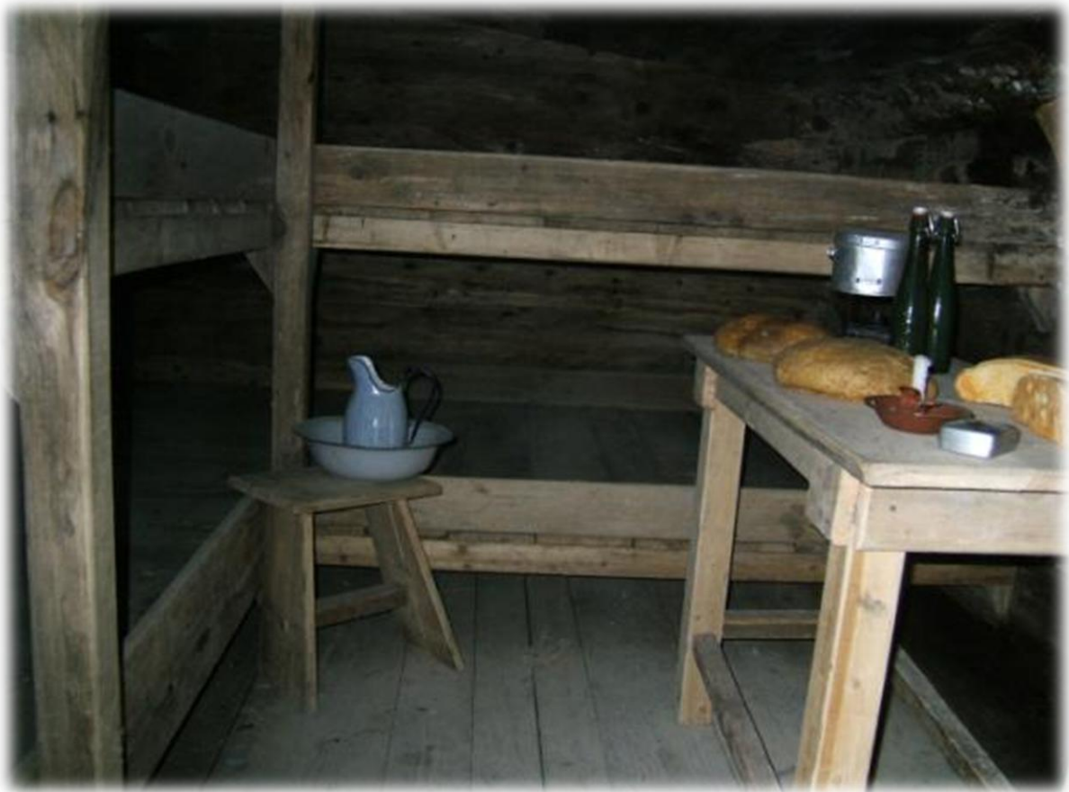
Leef- en slaapruijnte in een van de kamers in de tunnels.