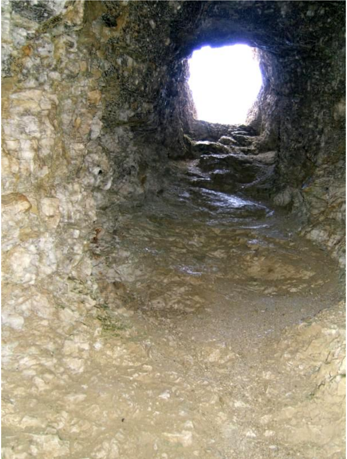
Er zijn ook zijtunnels die leiden naar een venster