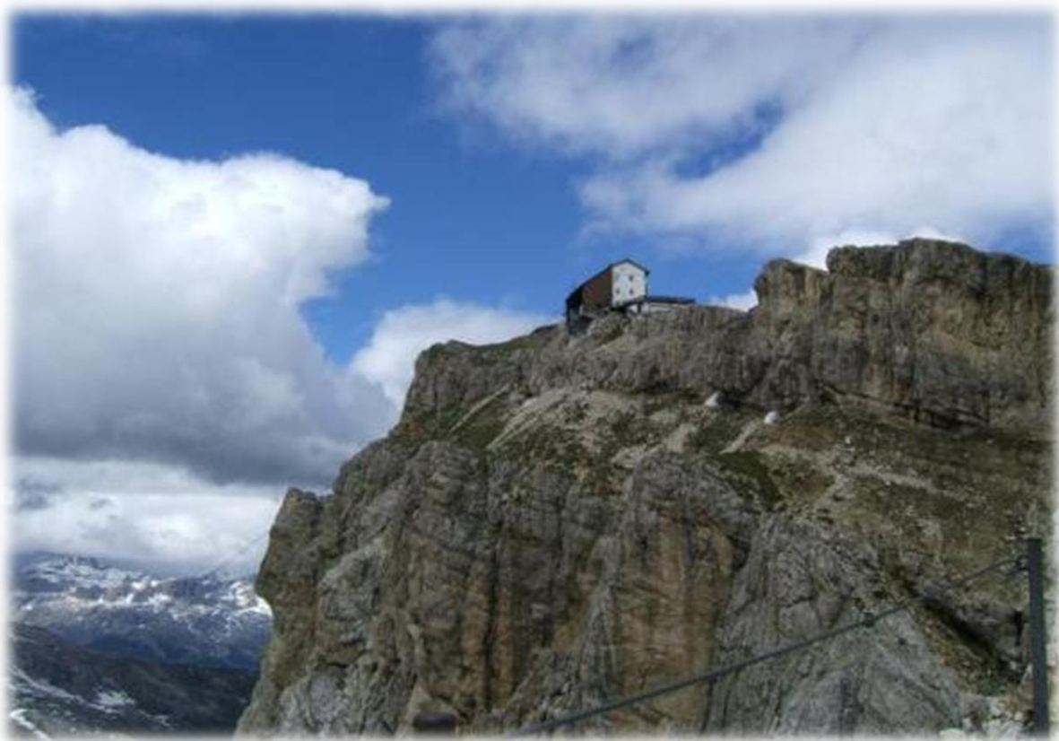
Blik op Rifugio Lagazoui.