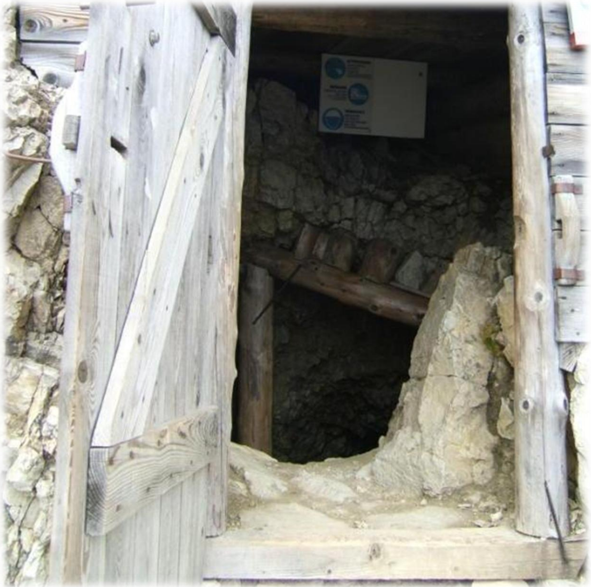
Bovenaan de uitgang of de ingang zoals jezelf verkiest.