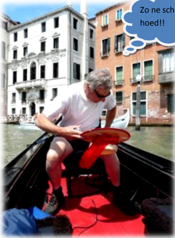
Zo ne schone hoed!!