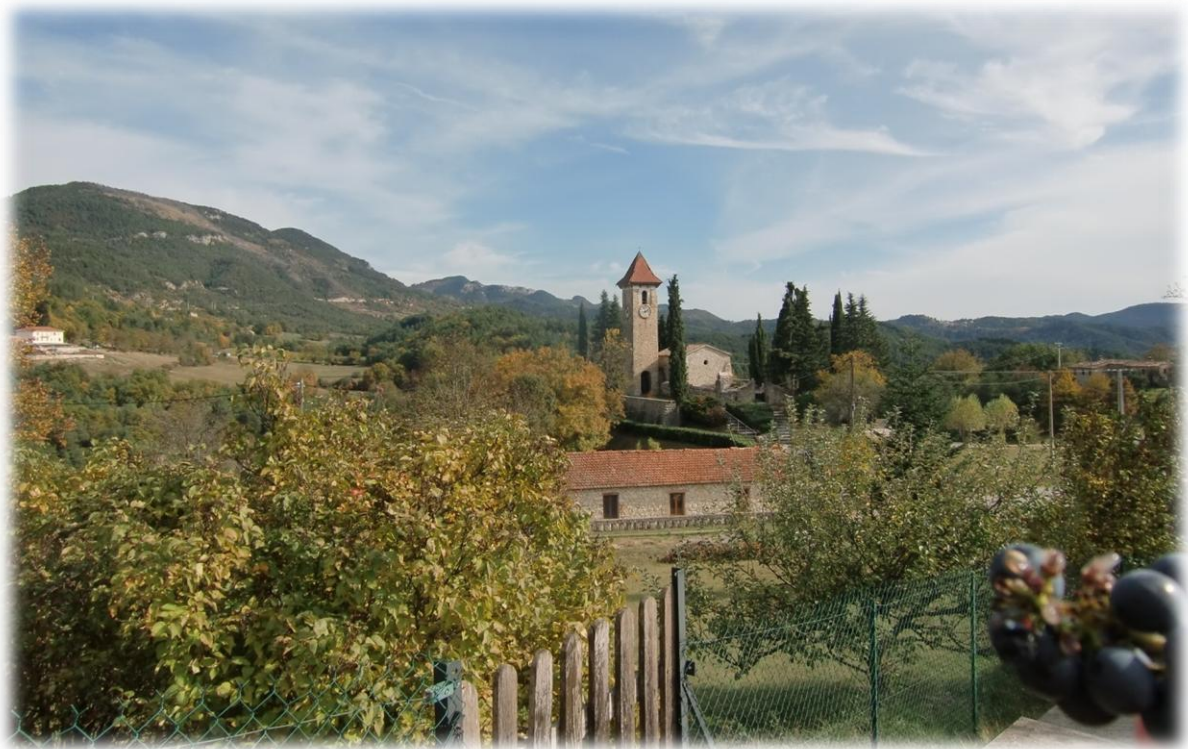
De vierkante donjontoren van de 13 de eeuwse Saint-Rochkerk is het enige middeleeuwse erfgoed dat over gebleven is. De spits zelf bestaat uit gelakte tegels.