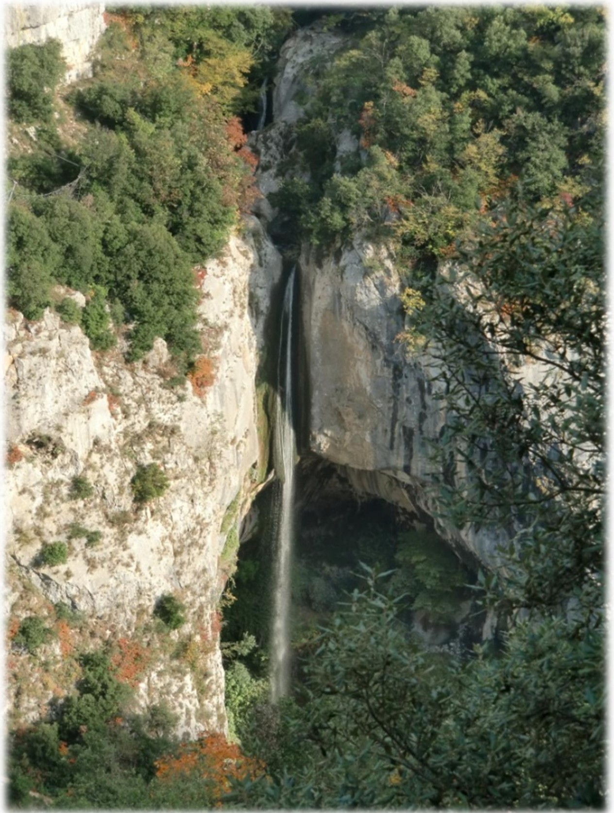
Af en toe krijgen we prachtige vergezichten over de vallei van de Loup.