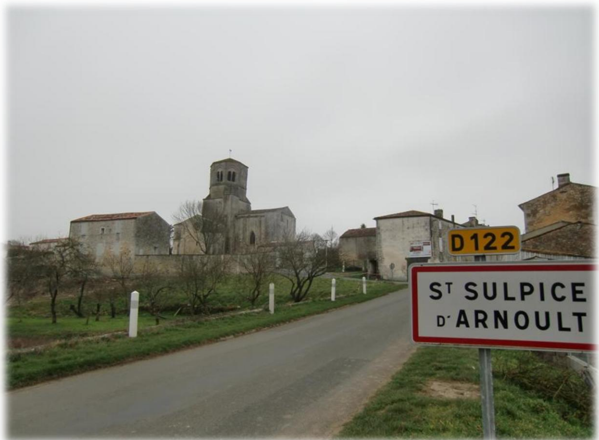
L'Arnoult is een zijrivier van de Charente. L'Arnoult heeft een lengte van ongeveer 40 km.