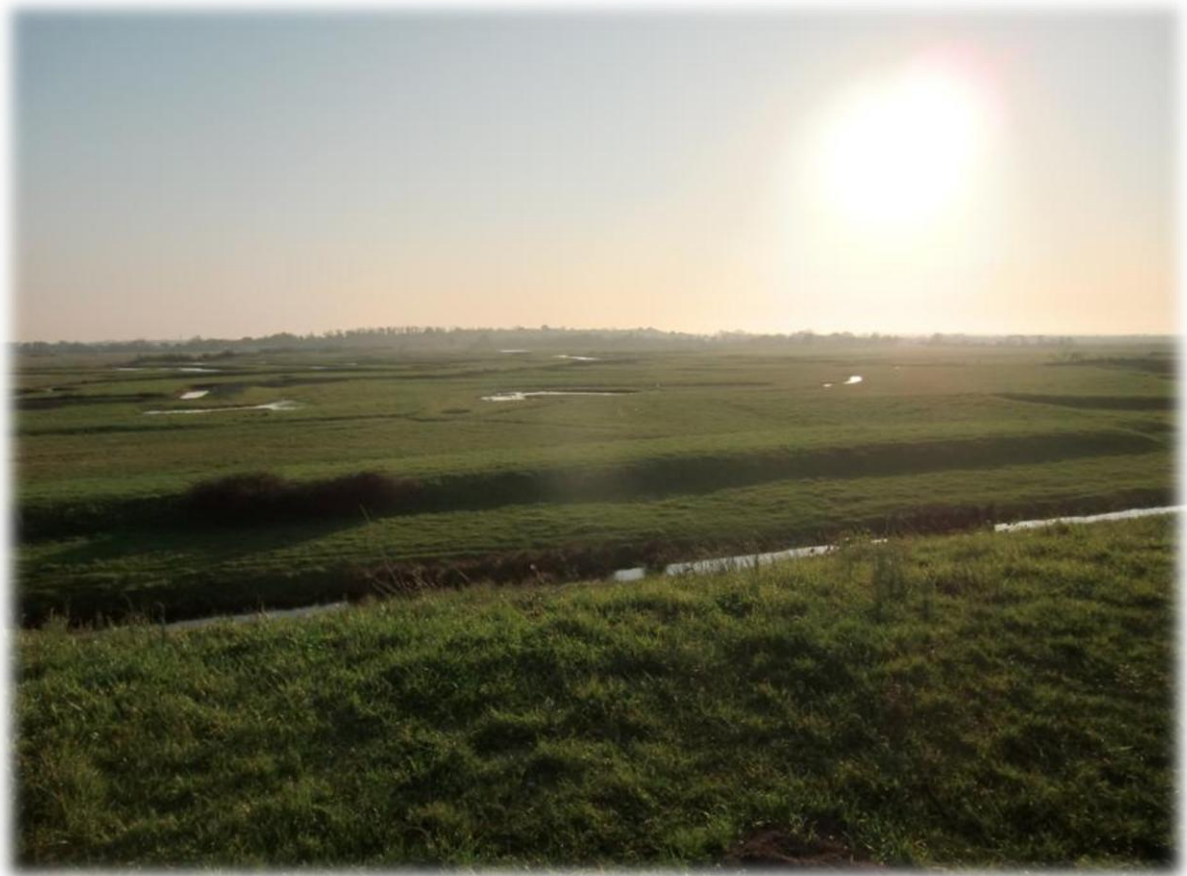
Van op de wallen heeft men een weids uitzicht op de omliggende polders en de eilanden Aix en Oléron.