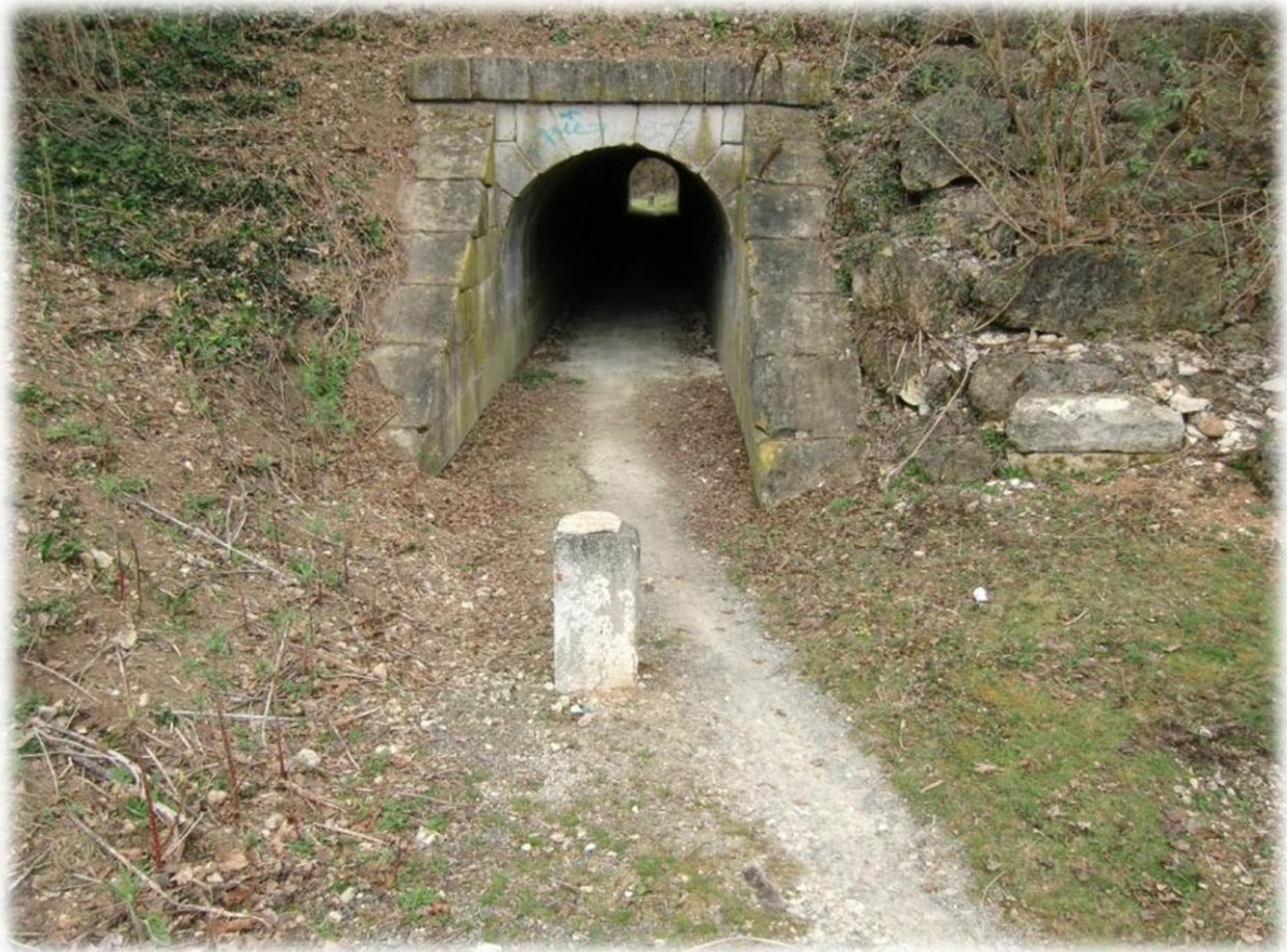
Moet me weer klein maken om door een tunneltje onder een spoorweg te gaan.