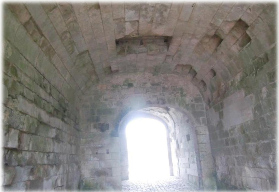
De ingang naar het fort. Let op het grote gat in de zoldering. Indien de indringers toch de poort hadden kunnen forceren werden ze overgoten met kokende pek.