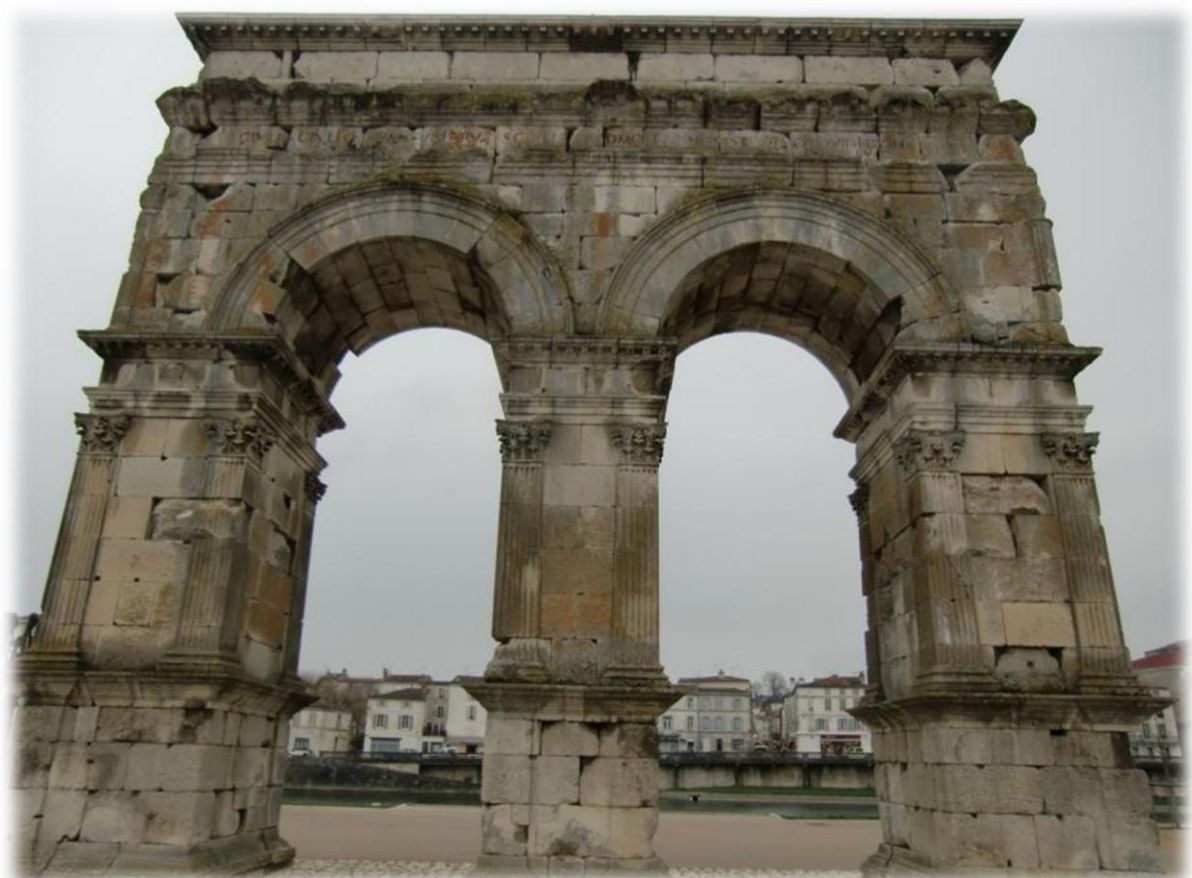
Ook de oude triomfboog (19 na Chr) is in zeer goede staat bewaard gebleven en staat op de rechter oever van de Charente.