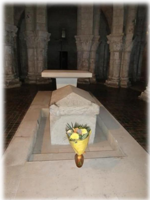
De kathedraal van Saintes heeft een mooie crypte die toegankelijk is voor het publiek. In de crypte bevindt zich de sarcofaag met het lichaam van de 3 de -eeuwse martelaar Eutropius, de eerste bisschop van Saintes.