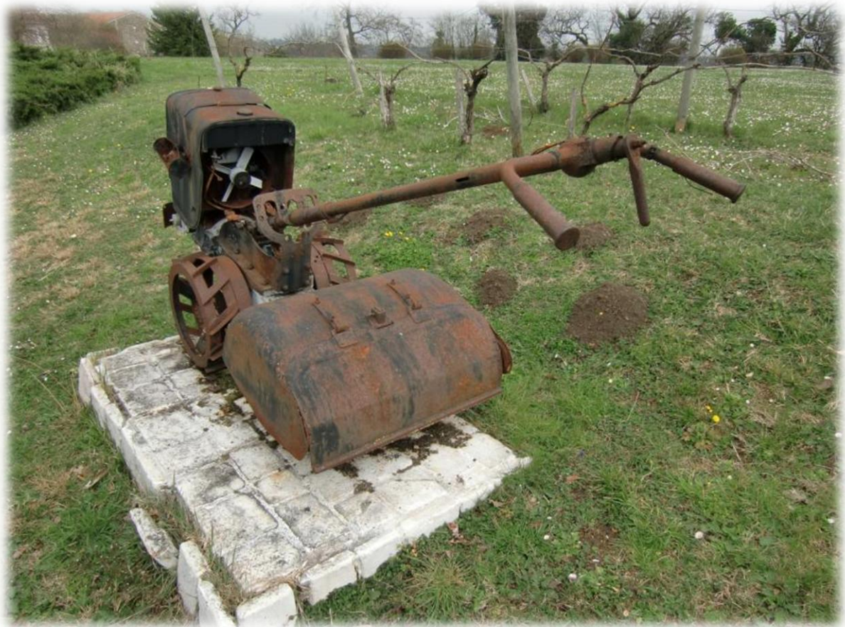
Ha, hier staat mijn eerste grasmachine.