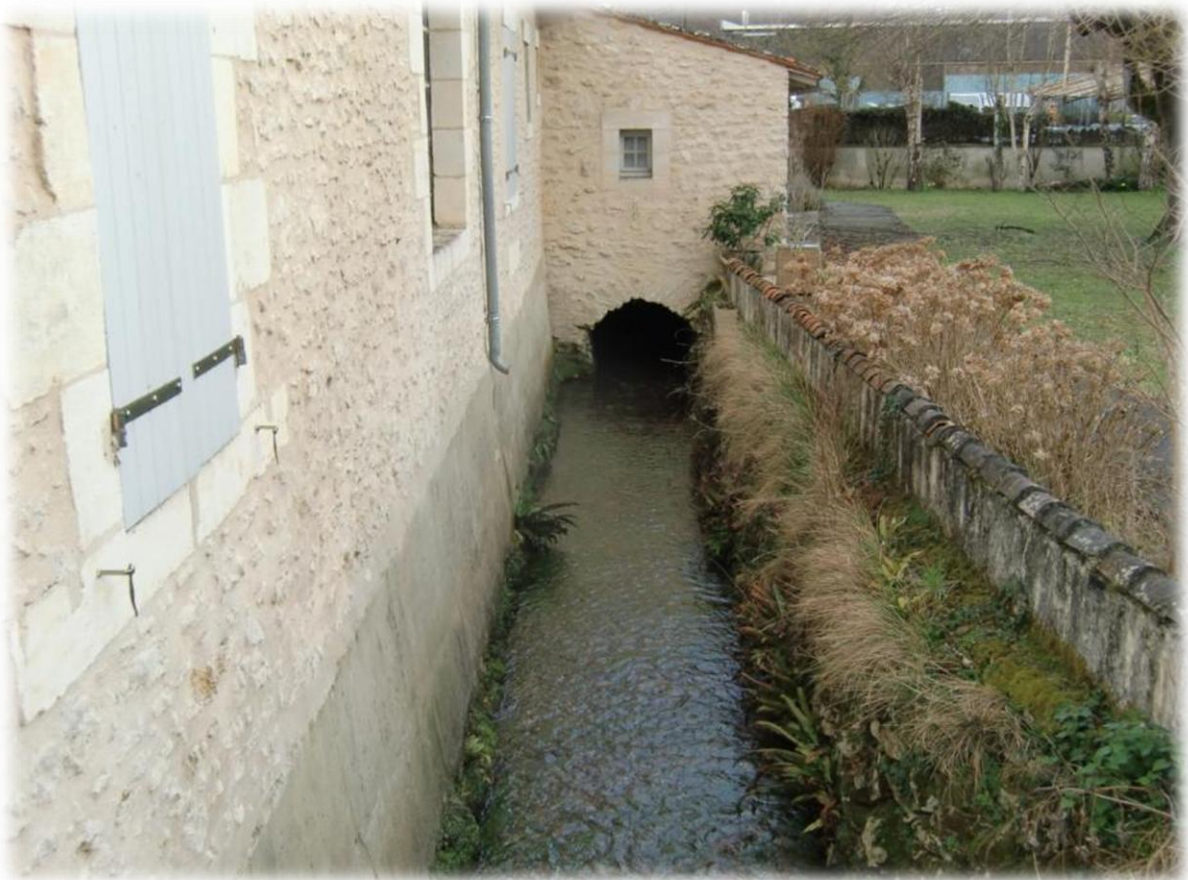
De grachten en de beken lopen hier gewoon door de tuinen en als het moet ook onder de woningen.