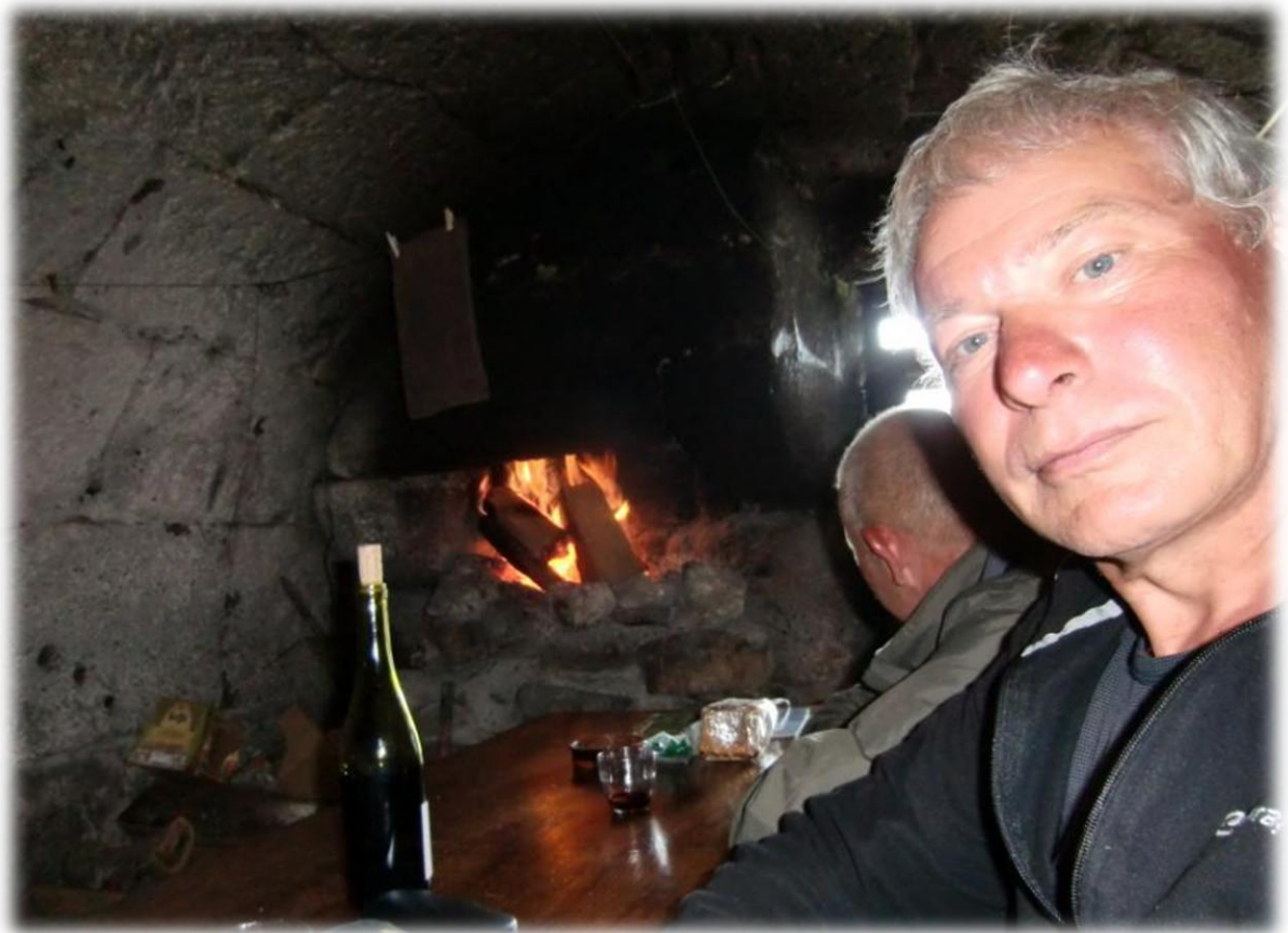
De gîte is een oude herderswoning. Er is nu enkel wat elektriciteit aanwezig door middel van een klein zonnepaneel. Het drinkbaar water mag je er uit een jerrycan halen.