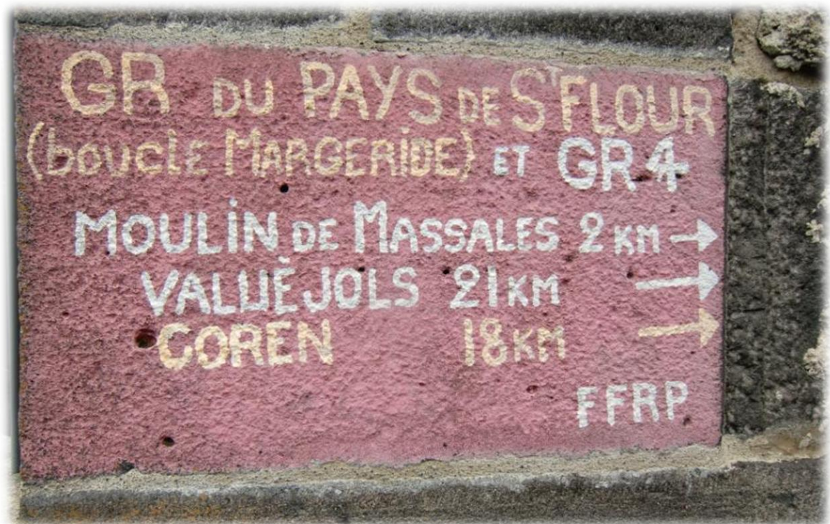
We naderen ons eindpunt Saint-Flour. Het stadje ligt op een vulcanisch voorberge te en trekt voornamelijk dagjestoeristen aan.