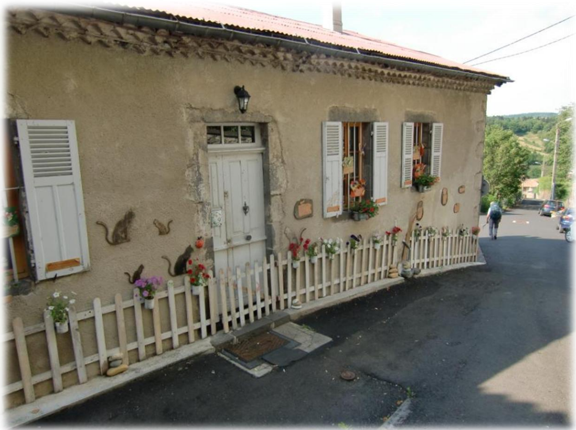
De middeleeuwse steegjes bevinden zich nog steeds binnen de versterkte poorten en de overblijfselen van de omwalling.