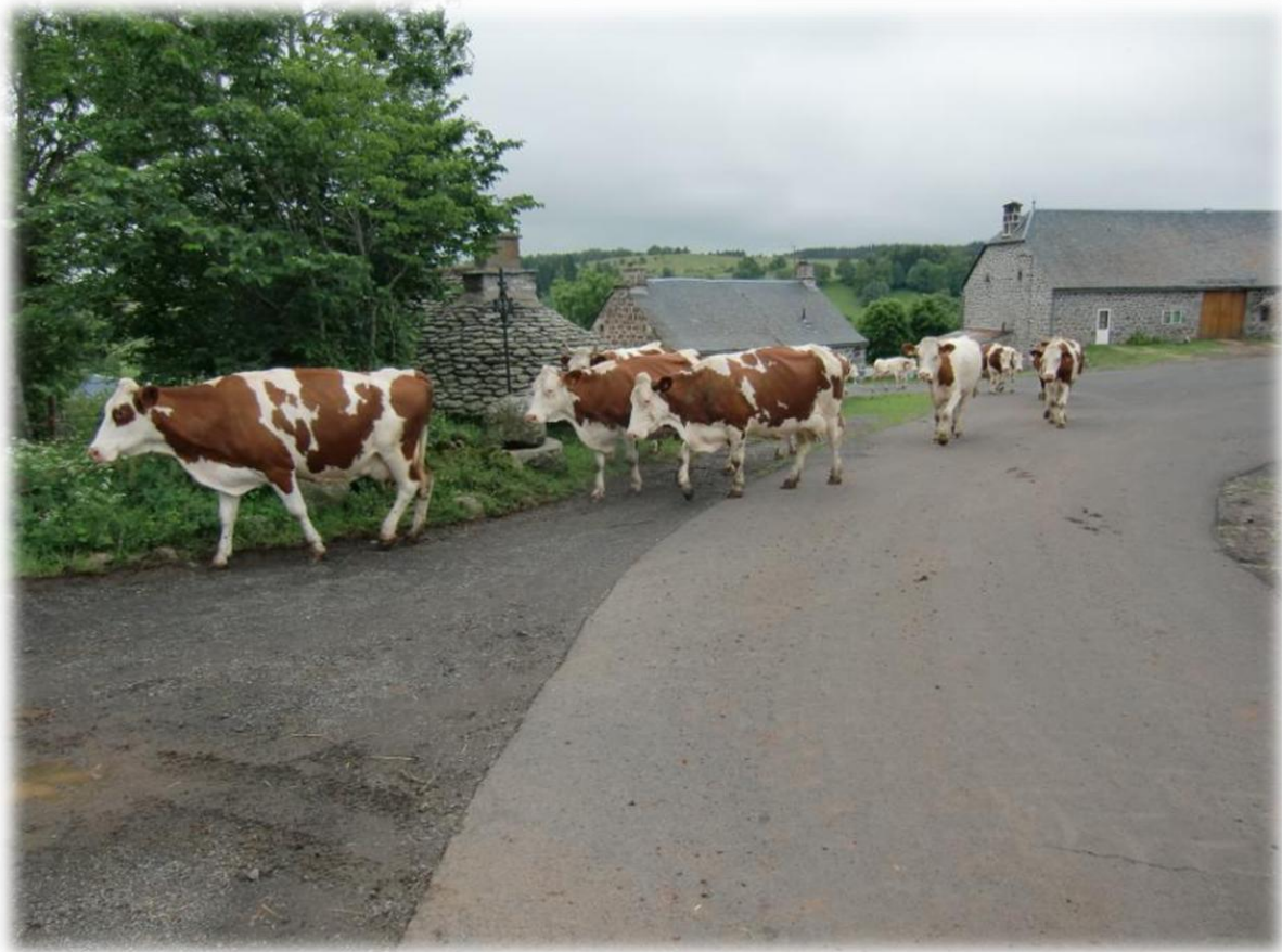
In het kleine dorpje Le Chemin gaat een kudde koeien van aan de boerderij naar de weide. De koeien kennen de weg en zijn niet vergezeld van de boer.