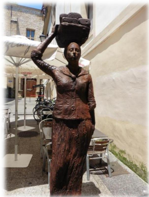
San Sebastian, de mooiste stad van de Noord-Spaanse costa, is een mengelmoesje van heuvels, surfstranden en historische gebouwen.