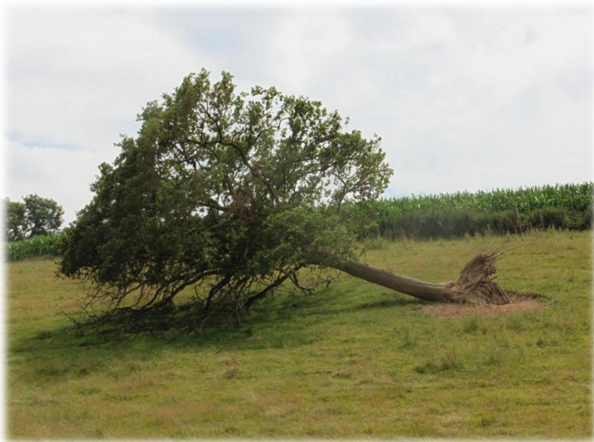
Een omgewaaide boom die mogelijks nog in leven kan blijven omdat er nog een deel van de wortels in de grond zit.