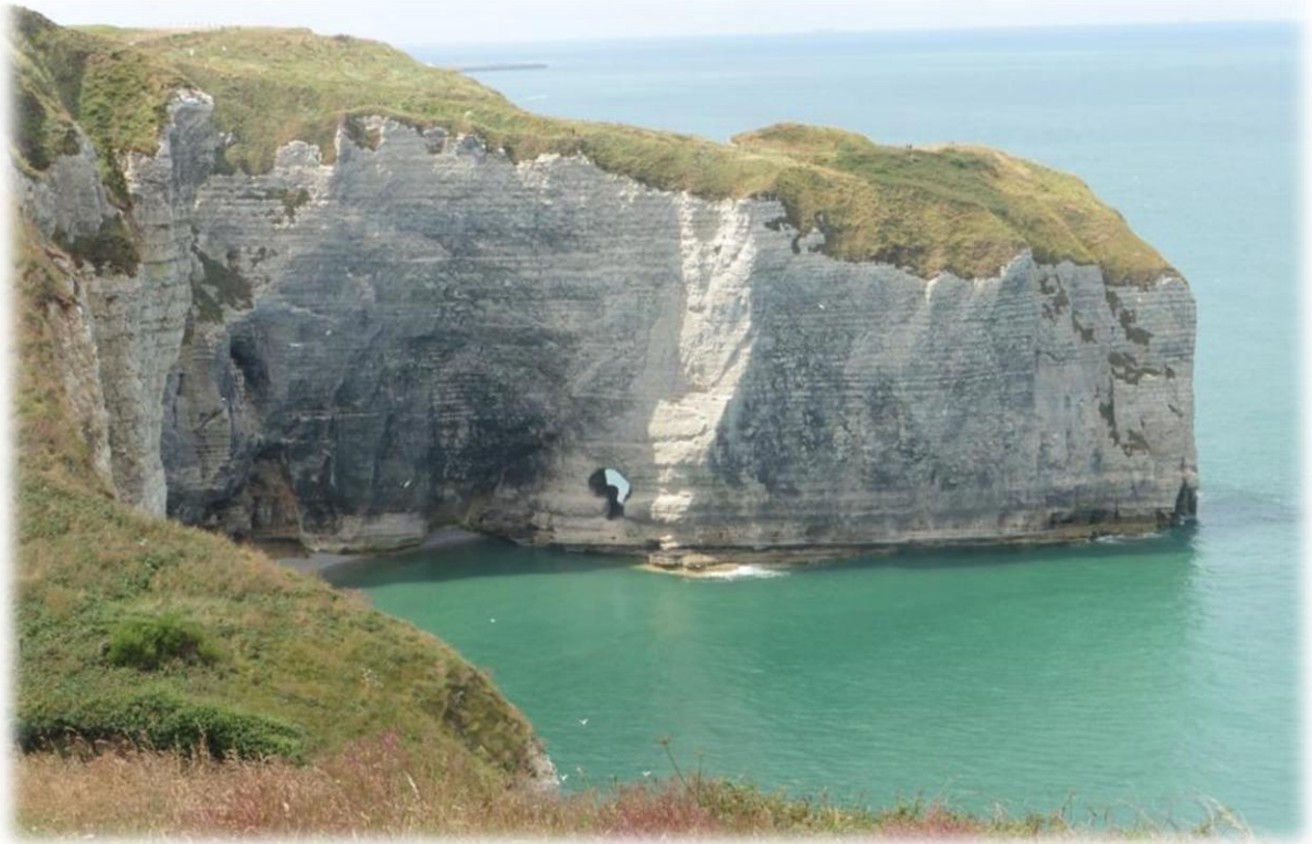
Door water en wind worden er tevens gaten gemaakt in de krijtrotsen.