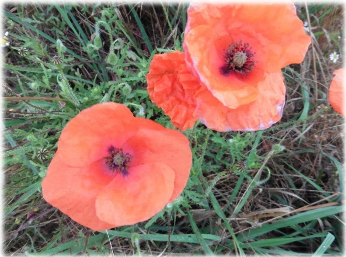
Langs onze paden treffen we veel klaproos of papaver aan. In het Vlaams wordt de klaproos soms kollebloem (toverkol of kol = heks) genoemd.