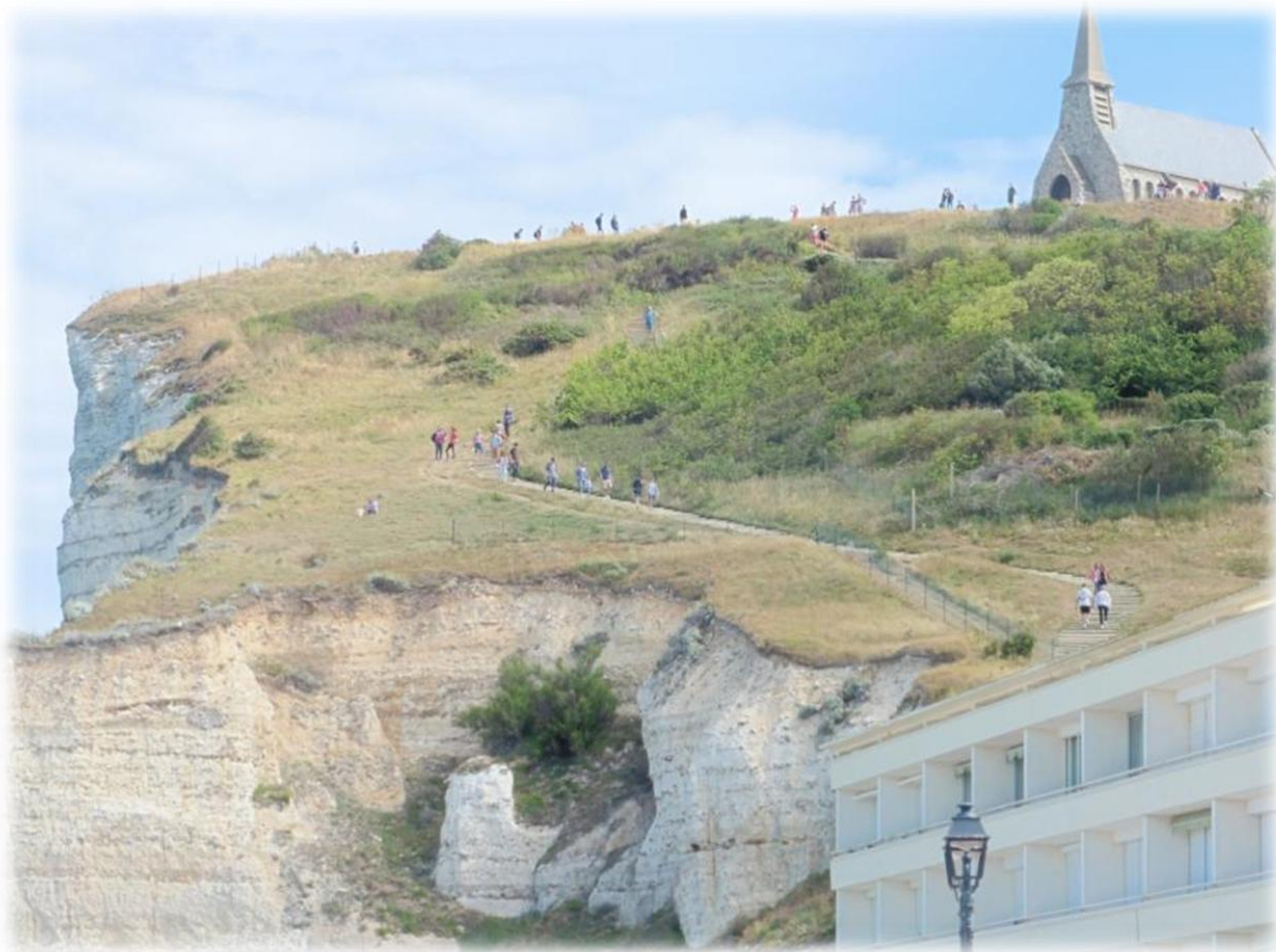
De chapelle Notre-Dame de la Garde staat boven op de Falaise d'Amont en dateert uit 1854. Tijdens de tweede wereldoorlog werd ze vernield en nadien terug opgebouwd in 1950.