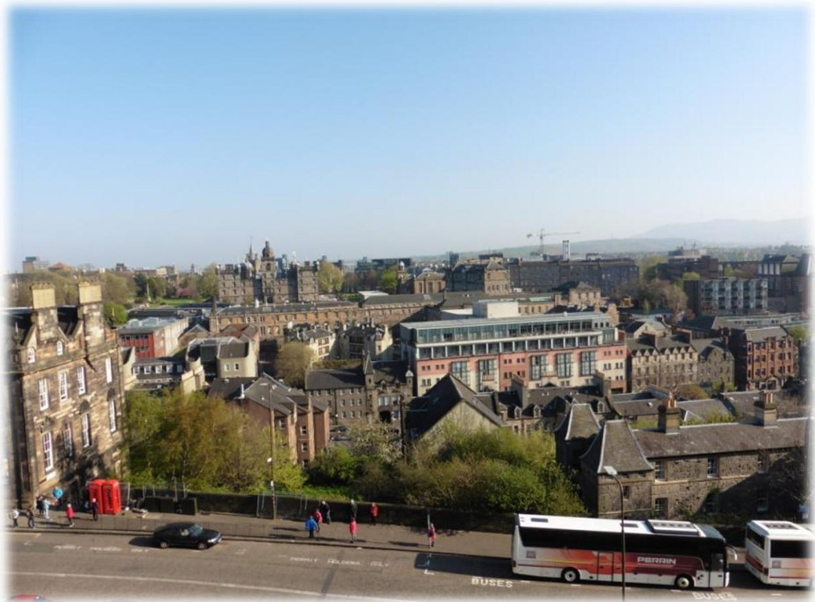
Edinburgh is sinds 1437 de hoofdstad van Schotland en is na Glasgow de grootste stad van Schotland.