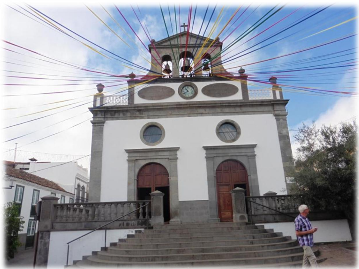
De kerk werd gebouwd in de 18 de eeuw. De klokken werden door inwoners van Gran Canaria, die emigreerden naar Cuba, vervaardigd in Cuba en werden per schip overgebracht.