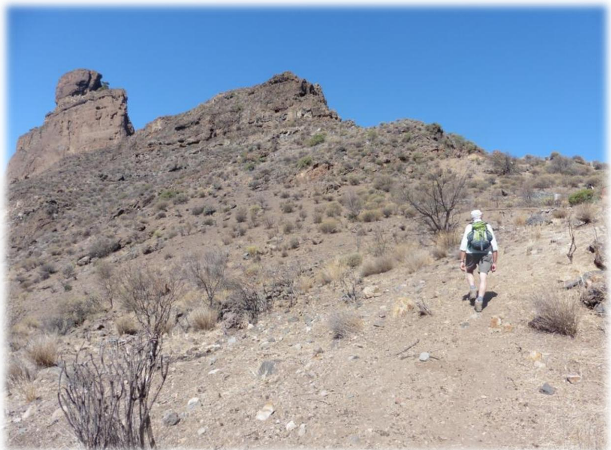
Onze tweede wandeling vandaag gaat naar de heilige berg Roque Bentayga. Het is de top van de berg op de foto hierboven.