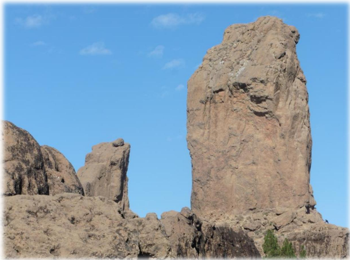
Roque Nublo wordt ook wel eens wolkenrots genoemd omdat dit gesteente, bij bewolking, dikwijls boven de wolken uitsteekt. Rechts is Roque Nublo, links noemt men de kikker.