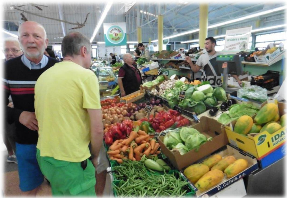
Vervolgens brengen we een bezoek aan de overdekte markt van Vega de San Mateo.