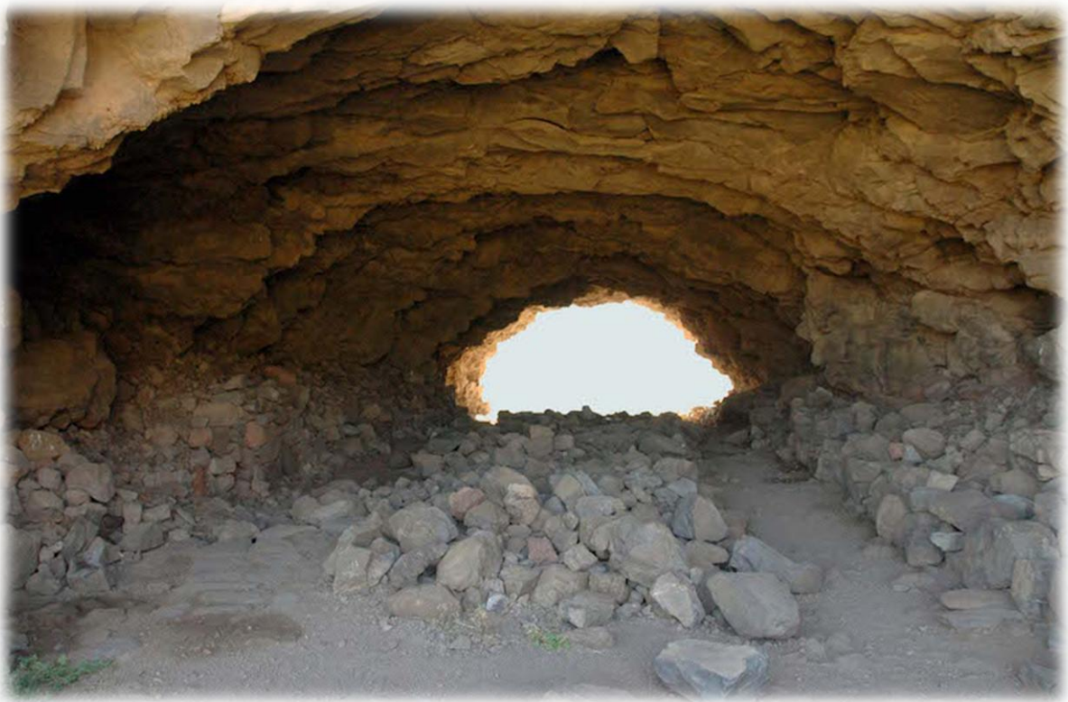
De foto bovenaan is de berg Fortaleza. Het kleine gaatje in de rode cirkel is de toegang tot de grote grot (onderste foto) die door de gehele berg gaat. Fortaleza is gelegen in een diep breed