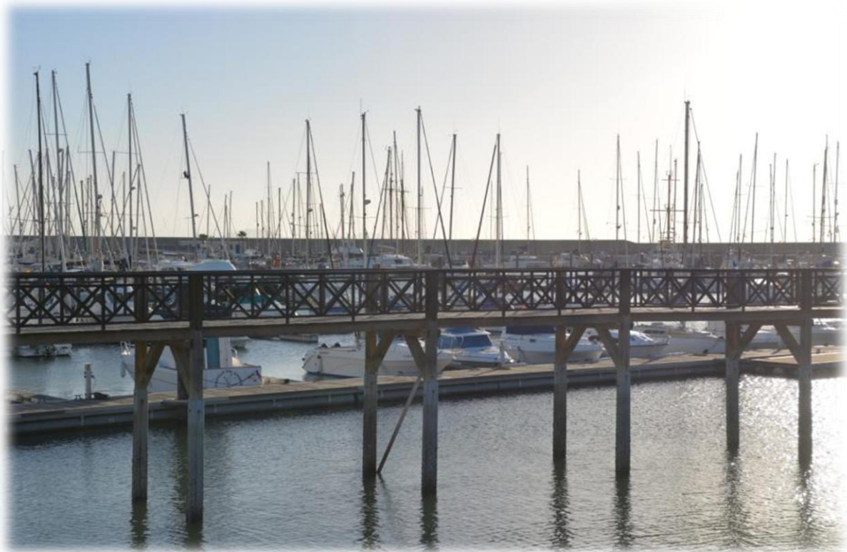
Marina Rubicón is de moderne jachthaven van de badplaats Playa Blanca. Het is niet gelegen in het centrum, maar ligt ten noorden van Playa Blanca. Marina Rubicón is een haven die op