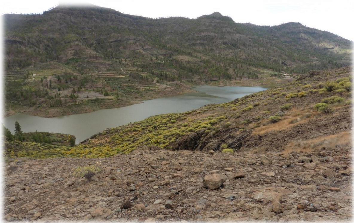
Het stuwmeer van Chira bevindt zich op een hoogte van 875 m. Sinds zijn bouw in 1964 is dit meer al enkele keren overgelopen in het meer van Soria.