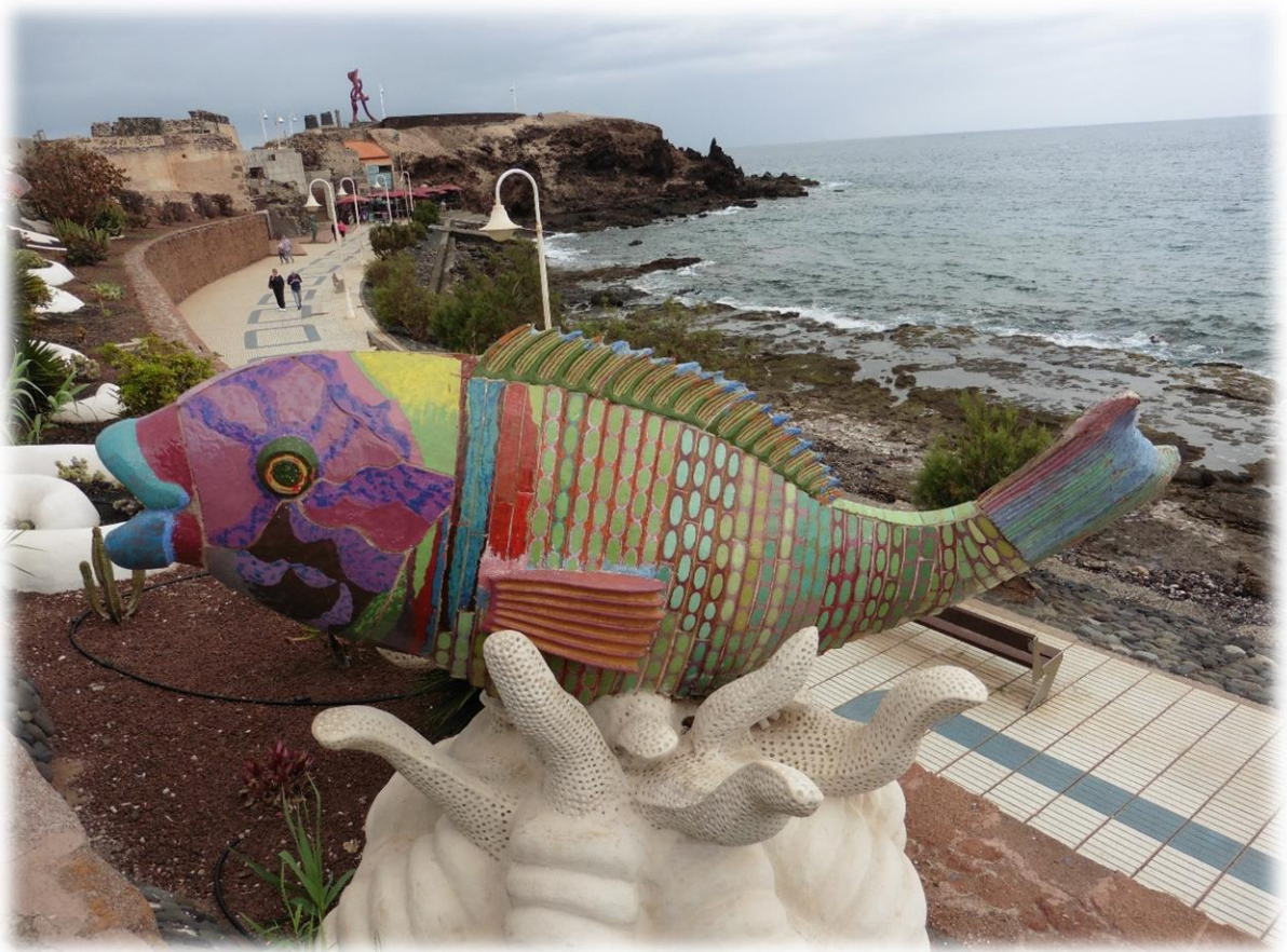
De kustlijn in het dorp heeft veel prachtige bronzen beelden staan in en aan de zee. Ook metersgrote kleurrijke vissen sieren het straatbeeld.