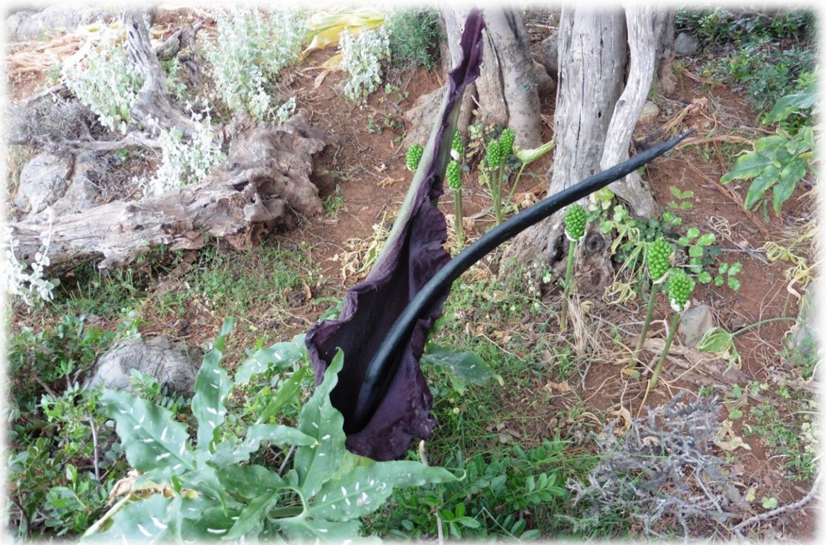
Dit is een Dracunculus vulgaris of drakenwortel. Een prachtige bloem al wil je hem niet in je tuin hebben.