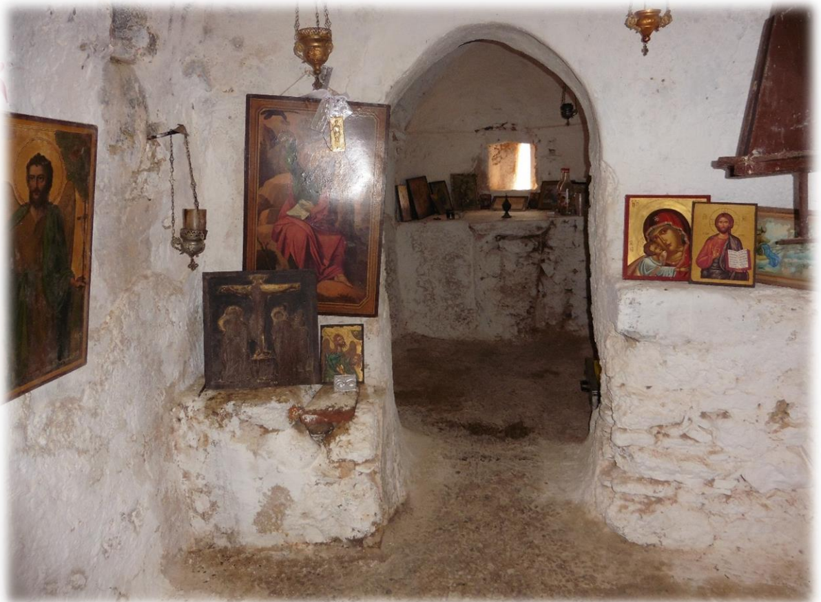
Helemaal boven op de kaap staat een prachtige kapel. Het is de bedevaartskapel Profitis Lias.