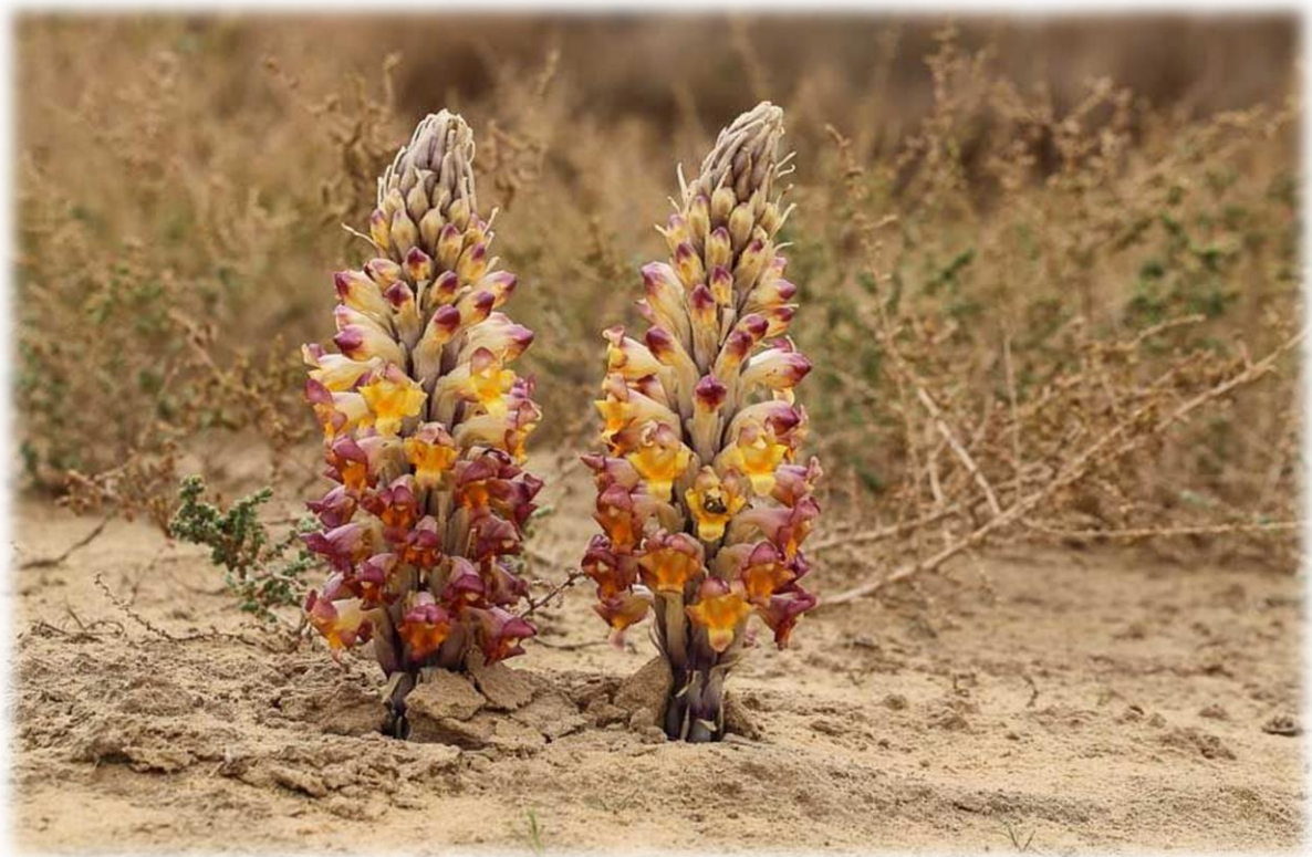
Redelijk zeldzaam is de Cistanche Tubulosa . Deze bloem is lid van de bremraapfamilie. Het geslacht bestaat uit alleen planten die volledig parasitair zijn en geen bladgroen bezitten. Dit