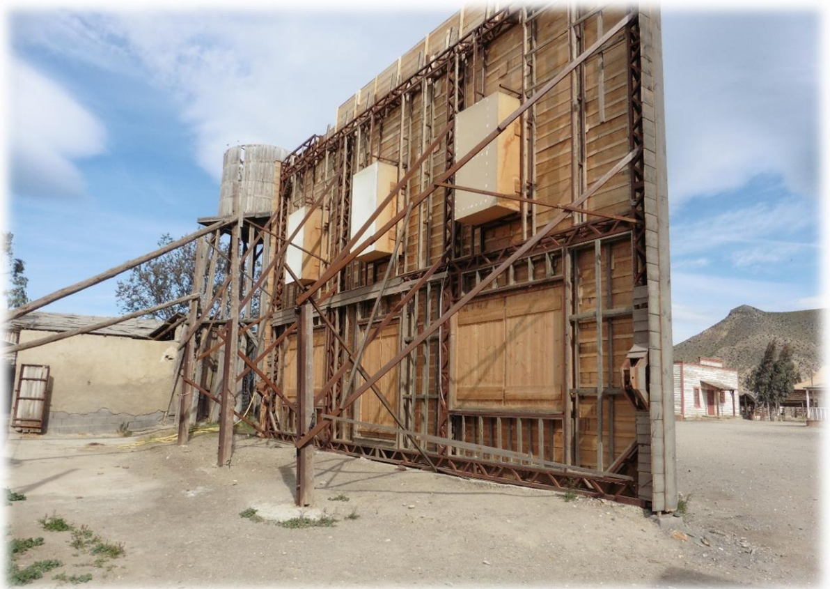
Als je even achter de gevel van een gebouw gaat kijken dan zie je pas dat alles nep is.