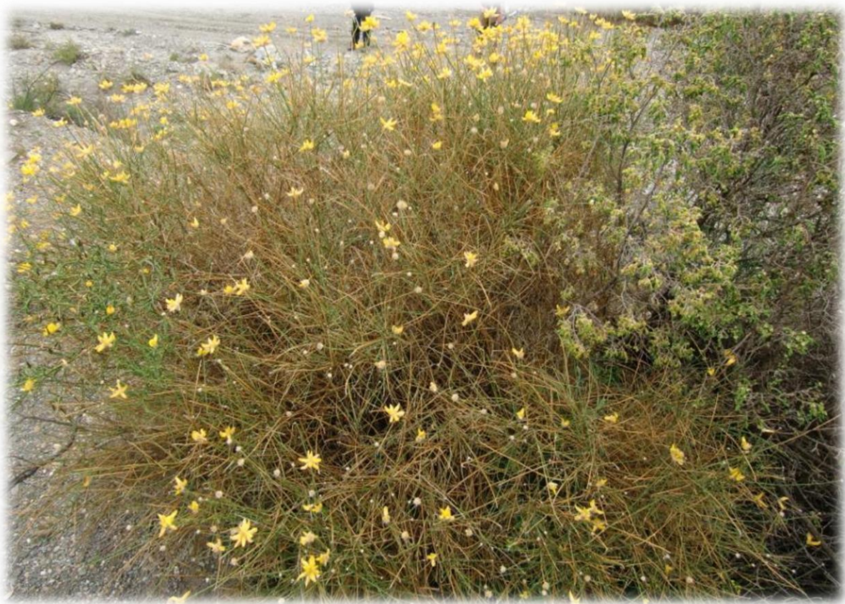
Van nature komt de Verbascum spinosum of Toorts hier veelvuldig voor. Verschillende soorten zijn in Amerika, Australië en Hawaï ingevoerd.