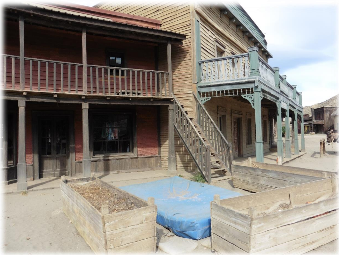
Bloembakken verbergen, voor de camera, mooi de matras waar de acteur op terecht komt als hij over de balustrade wordt geworpen.