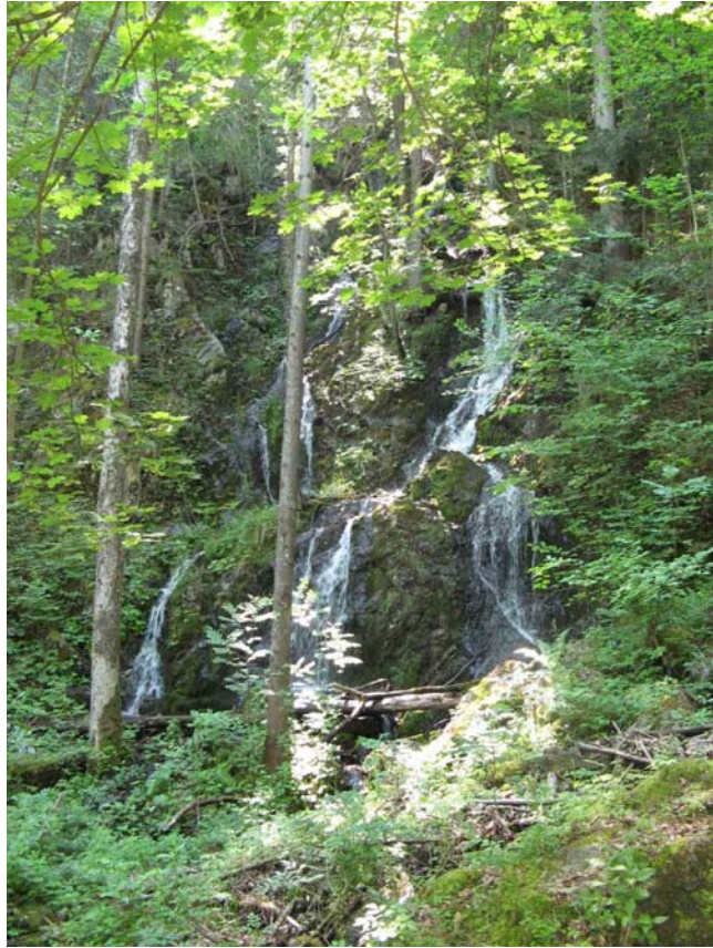
Watervallen aan de Hechtsee