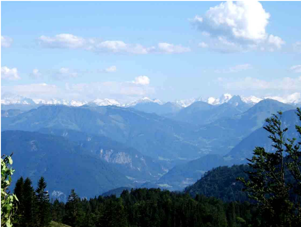
Heel wat drieduizenders verschijnen aan de horizon

Van een Hüttenruhe om 22.00 uur is geen sprake meer. Het is al na elven als we naar onze tentjes trekken. Maar zo hebben we het graag. We hebben contact gemaakt met de menselijke kant van de bewoners van de hut die, in deze tijd van het jaar, de tijd hebben om eens met hun gasten te praten.