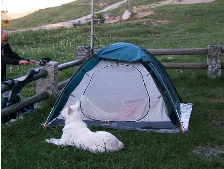
Ora waakt bij de tent terwijl Jo en Ludwig de klettersteig aan het doen zijn