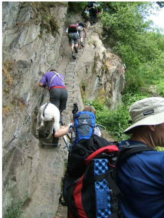
Ora en de rest van de groep