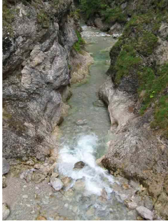
Op weg naar Ritzaualm