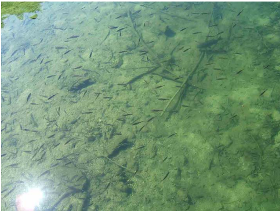
Vis in overvloed

Nadien volgen nog de Längsee en de Hechtsee.