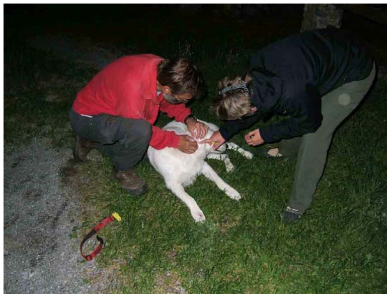
Ora wordt elke avond ontdaan van teken