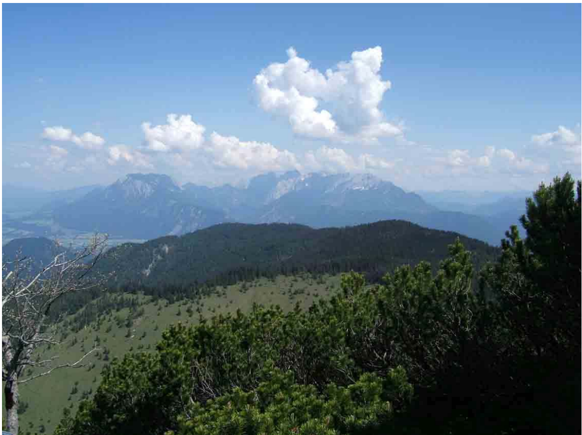
Zicht van op de kam. Op de achtergrond ligt Wilden Kaiser