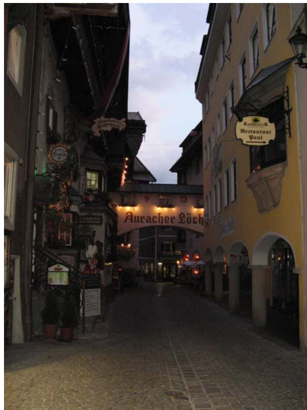
Het oude stadsgedeelte van Kufstein