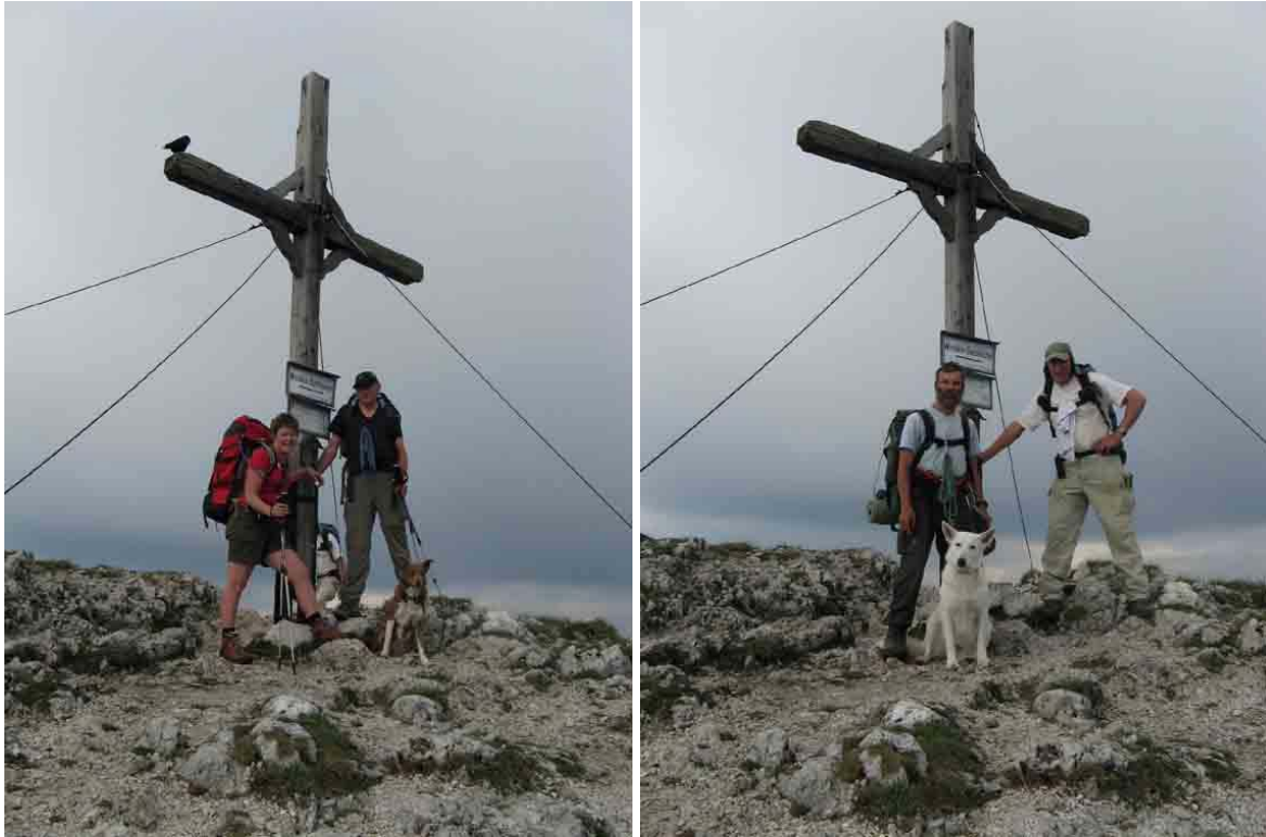
Met z'n allen op de Pyramiden Spitze

Aangekomen op de Spitze is het al na vijven. We kunnen op of in de buurt van de top bivakkeren doch de meerderheid verkiest om een stuk af te dalen. Het is echter 20.00 uur vooraleer we, op een kammetje in het bos, een eerste plekje vinden waar we twee tentjes kunnen opzetten. Juist gepast voor het invallen van de duisternis. We hebben vandaag dertien uur gestapt, hebben zowat 1.500 meter geklommen en zijn 400 meter gedaald.