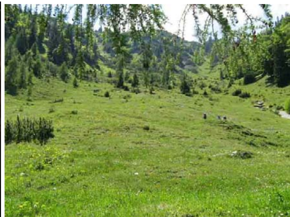
beklimming van de alm, bovenaan in het midden is het Joch