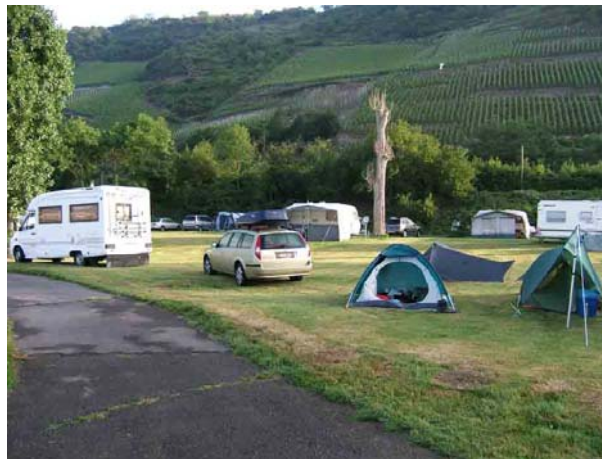
De camping in Boppard