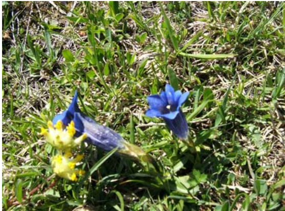
Gentiaan in bloei

Gekomen op de kam van Trainsjoch bevinden we ons op de grens Oostenrijk-Duitsland. Dit staat tevens aangegeven met een grenspaal. We hebben nu ook meteen zicht op Trainsalm, de plaats waar we straks willen overnachten. Voordat we afdalen naar Trainsalm besluiten we om even uit te rusten daar het mooi weer is en we tijd genoeg hebben (denken we toch).