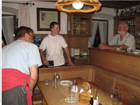
Rechts de hüttenwirt, in het midden zijn echtgenote