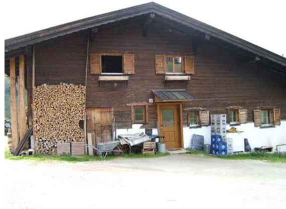
Trockenbachalm met veel lege bakken water