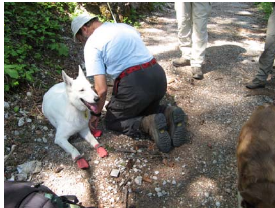
Ora krijgt schoentjes aan om haar voetzolen niet te beschadigen