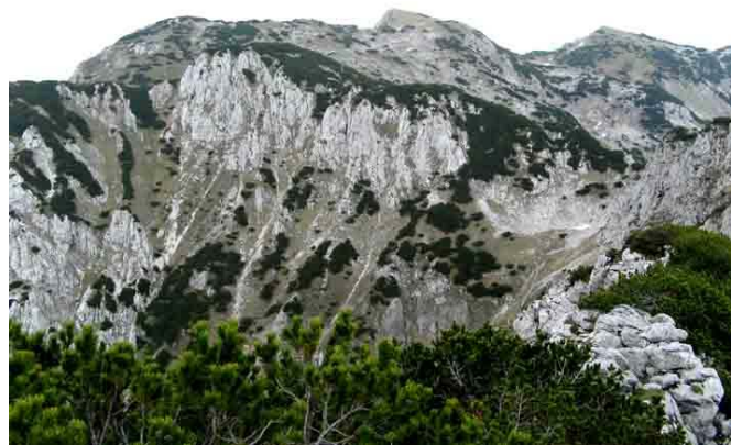
Zicht van op Einserkogel