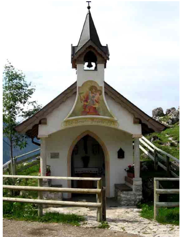
Kapel aan Ritzaualm