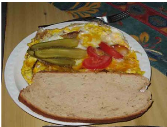
Spek met eieren, meer moet dat niet zijn