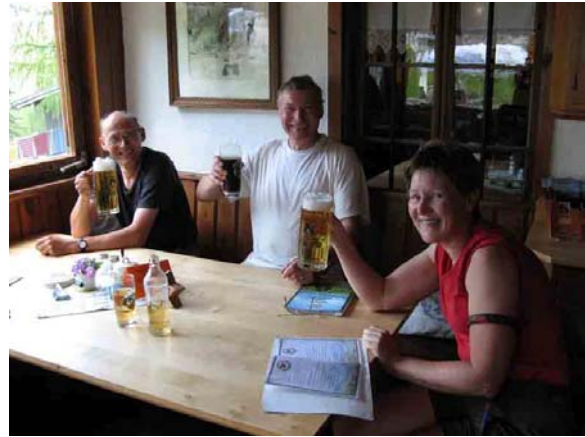
De Wilde Kaiser aan de Kaindl Hütte