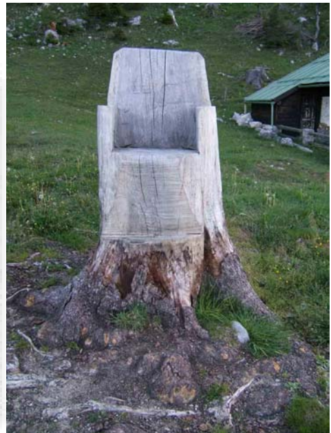
Een aangepaste boomstronk nodigt uit om te gaan zitten