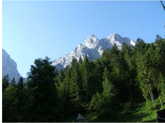
De Wilde Kaiser

Vanaf Anton-Karg-Haus is het terug klimmen geblazen. Via de Bettlersteig is het 500 meter klimmen tot juist onder de Brandkogel. Vervolgens een mooie afdaling naar de mooi gelegen Kaindl Hütte.