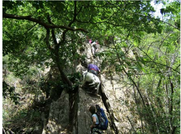
de 34 kg zware Ora hangt vast aan Jo