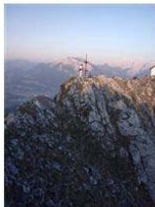
Klettersteig op de Brunnstein